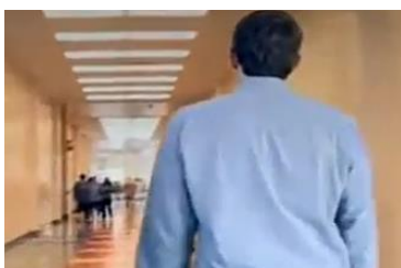
Afbeelding 15: Scène 8.