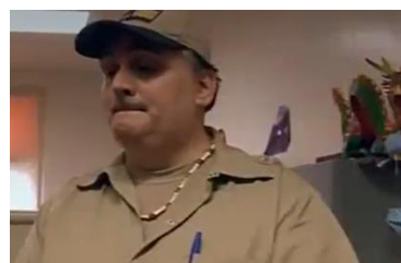
Afbeelding 14: Scène 15.

Ten slotte zijn scène vier en vijftien goede voorbeelden van hoe de setting kan worden ingezet om het perspectief te benadrukken. Deze scènes vinden plaats in de slaapkamers van de delinquenten (afbeelding 13 en afbeelding 14). De slaapkamers zijn persoonlijke ruimtes van de delinquenten. Door hen in deze setting te interviewen wordt het idee geschetst dat de delinquenten Theroux een kijkje laten nemen in hun persoonlijke leven. In scène 4 bespreken zij ook kort de persoonlijke spullen van Mr. Rigby. Zij geven zich in deze setting bloot aan