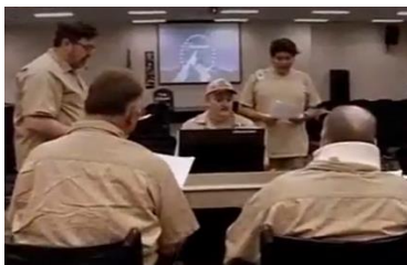
Afbeelding 20: Scène 14.

Ten derde zijn er tussen de scènes door korte shots van zwart beeld. Tijdens deze shots is er een non-diëgetisch geluid te horen van een deur die wordt gesloten. Dit geluid geldt als een logisch bewijs dat de delinquenten zijn opgesloten in Coalinga. Dit benadrukt het idee dat de delinquenten gevaarlijk zijn voor de samenleving en onderstreept een representatie van de delinquent als crimineel en gevaarlijk.