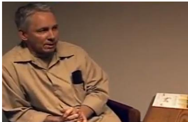
Afbeelding 11: Scène 12.

zorgen voor een open en ontspannen stemming. Deze opvallende tegenstelling in pathetische bewijzen benadrukken de representatie van de pedofiel als gevaarlijk en duister en geven aan dat de donkere en onheilspellende wereld van de pedofiel recht tegenover de lichte, ontspannen en normale buitenwereld staat. Deze representatie wordt verder ondersteunt door het gebrek aan daglicht gedurende de gesprekken met de delinquenten. Dit dient namelijk ook als een logisch bewijs dat de mensen en het onderwerp zo ernstig en monsterlijk zijn dat ze het daglicht niet kunnen verdragen.