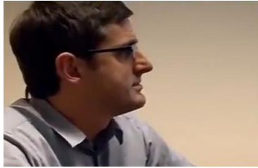
Afbeelding 6: scène 10