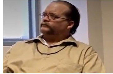
Afbeelding 7: scène 10