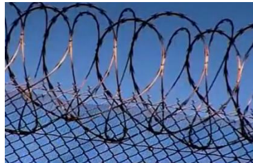
Afbeelding 19: Scène 16.

Ten derde zijn er verschillende shots waarbij close-ups van tralies te zien zijn (afbeelding 19). Deze close-ups benadrukken dat de delinquenten gevangen zitten in Coalinga. Hierdoor wordt Coalinga vergeleken met een gevangenis. Dit is een logisch bewijs voor het idee dat de delinquenten crimineel zijn en draagt zo bij aan een representatie van de pedofiel als een bedreiging voor de samenleving.