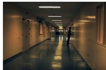
Afbeelding 2: Scène 11.