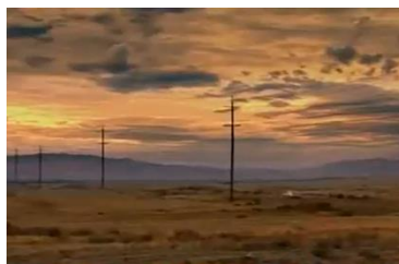
Afbeelding 10: Scène 10.

Binnen de mise-en-scène van de documentaire THEROUX: A PLACE FOR PAEDOPHILES zijn er een aantal elementen die bijdragen aan het perspectief dat de documentaire biedt. Ten eerste wordt in de documentaire de algehele setting van de locatie weergegeven door het openingsshot, enkele exemplarische shots en het eindshot. Deze verschillende shots laten vergezichten van de omgeving zien (afbeelding 10). Deze vergezichten benadrukken dat het ziekenhuis erg afgelegen ligt, ver weg van de bewoonde wereld. Hierdoor wordt er een ‘wij versus zij’-discours geconstrueerd. Wij bevinden ons in de bewoonde wereld maar zij, de slechte mensen, staan zowel fysiek als mentaal ver weg van de normale samenleving. Dit discours suggereert dat de pedofiel de Ander is en een bedreiging voor onze samenleving. Ook dit fungeert als logisch bewijs dat de pedofiel een vreemd wezen is dat niet in onze normale samenleving hoort. Daarbij wordt door het laten zien van deze afgelegen locatie benadrukt dat de pedofielen ver van de samenleving worden behandeld. Dit suggereert dat zij te gevaarlijk zijn om in de samenleving te behandelen. Deze shots ondersteunen een representatie van de pedofiel als iemand die anders is dan wij en een gevaar is voor onze samenleving.