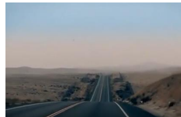
Afbeelding 4: Scène 22.