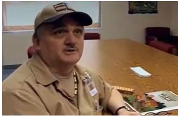
Afbeelding 8: scène 8