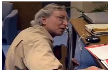
Afbeelding 18: Scène 6.