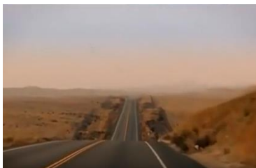
Afbeelding 1: Scène 2.

De structuur van de documentaire heeft een opvallend patroon. De documentaire begint met het beeld vanuit een auto die door een woestijn richting Coalinga rijdt (afbeelding 1). In deze scène introduceert Theroux het ziekenhuis. In het ziekenhuis vinden verschillende interviews plaats tussen Theroux, de seksdelinquenten en de therapeuten. Tussen deze interviews in zijn er shots van lange, donkere gangen van het ziekenhuis (afbeelding 2). Op het einde van de documentaire gaat de camera achteruit door een gang (afbeelding 3) en rijdt de auto weer weg van het ziekenhuis (afbeelding 4). Deze structuur waarbij Theroux een donker gangenstelsel ingaat, versterkt het idee dat Theroux de duistere wereld van de pedofilie betreedt. Aan het einde van de documentaire komt Louis weer uit deze duistere wereld om zijn ontdekkingen te delen met de kijker. Deze narratieve structuur, en met nadruk de donkere gangen en het feit dat Theroux door een onbewoond stuk land moet rijden om bij de locatie te komen, is een logisch bewijs dat de wereld van de pedofilie een duistere en gevaarlijke wereld is die ver weg staat van de normale samenleving en draagt bij aan de representatie van de pedofiel als eng en gevaarlijk