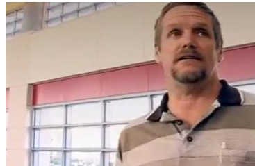
Afbeelding 12: Scène 6.

Ten derde speelt de setting van deze interviews een belangrijke rol in het negatieve perspectief op de pedofilie. De gesprekken met de therapeuten vinden plaats in grote open ruimtes (afbeelding 12). Deze open setting suggereert een vrij, open en ontspannen gesprek. De gesprekken met de delinquenten vinden echter plaats in kleine gesloten ruimtes (afbeelding 11). Deze setting suggereert dat de wereld van deze delinquenten erg gesloten is. Dit dient als een logisch bewijs dat de delinquenten en het onderwerp van pedofilie niet in de openbaarheid horen, maar diep opgeborgen in ruimtes afgesloten van de buitenwereld. Deze tegenstellingen in logische bewijzen benadrukken de obscuriteit van de pedofilie.