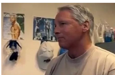
Afbeelding 13: Scène 4.

Ten derde speelt de setting van deze interviews een belangrijke rol in het negatieve perspectief op de pedofilie. De gesprekken met de therapeuten vinden plaats in grote open ruimtes (afbeelding 12). Deze open setting suggereert een vrij, open en ontspannen gesprek. De gesprekken met de delinquenten vinden echter plaats in kleine gesloten ruimtes (afbeelding 11). Deze setting suggereert dat de wereld van deze delinquenten erg gesloten is. Dit dient als een logisch bewijs dat de delinquenten en het onderwerp van pedofilie niet in de openbaarheid horen, maar diep opgeborgen in ruimtes afgesloten van de buitenwereld. Deze tegenstellingen in logische bewijzen benadrukken de obscuriteit van de pedofilie.