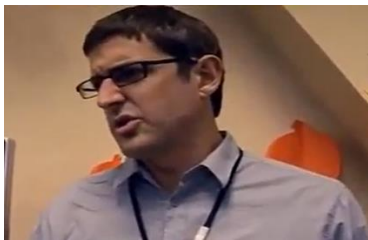
Afbeelding 17: Scène 6.

(afbeelding 18). Deze cameravoering suggereert dat Theroux een groot en belangrijk personage is, terwijl de delinquent als minder belangrijk wordt weergegeven. Dit is een logisch bewijs dat de delinquent niet alleen letterlijk maar ook figuurlijk lager staat dan Theroux en benadrukt een representatie van de pedofiel als een minderwaardig personage. Het is echter opvallende dat de therapeut in dit gesprek aanhaalt dat hij een zelfde muzikale interesse heeft als de delinquent. Waarschijnlijk zijn zij zelfs naar de zelfde concerten geweest. Ondanks de cameravoering nuanceert dit gesprek de negatieve representatie van de delinquent. Door een gemeenschappelijke interesse aan te halen, normaliseert hij de seksdelinquent. Hiermee wordt aangegeven dat ook de pedofielen normale mensen zijn.