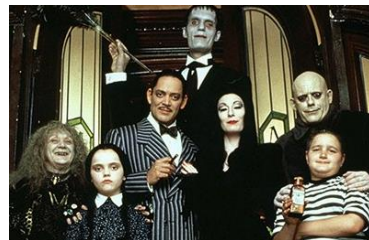
Afbeelding 21: THE ADDAMS FAMILY

Ten slotte zijn er enkele scènes waarbij delinquenten liederen zingen. Een exemplarische scène die bijdraagt aan een perspectief op pedofilie is te zien in scène 14. In deze scène zien we een groep van delinquenten die rondom een piano staan (afbeelding 20). Zij zingen de titelsong van THE ADDAMS FAMILY: “They’re creepy and they’re kooky, Mysterious and spooky, They’re altogether ooky, THE ADDAMS FAMILY.” Deze tekst een verwoording is van de representatie van de pedofiel. Ze zijn eng, gek, mysterieus en gevaarlijk. Daarbij dient deze scène als een directe verwijzing naar de welbekende Addams Family. Dit is een fictieve familie die houdt van alles wat macaber en obscuur is. Zij passen hierdoor niet in de normale