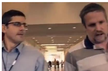
Afbeelding 5: Scène 6

Ook de non-verbale communicatie van Louis Theroux draagt bij aan het perspectief van de documentaire op pedofilie. Ten eerste is er een verschil te zien tussen de houding van Theroux ten opzichte van de therapeuten en zijn houding ten opzichte van de delinquenten gedurende de interviews. Wanneer Theroux spreekt met de therapeuten loopt of staat hij naast hen (afbeelding 5). Deze lichaamshouding van Theroux duidt op een gelijkwaardige relatie ten opzichte van de therapeuten. Wanneer Theroux de delinquenten spreekt, staat hij tegenover hen. De camera switcht op deze momenten tussen Louis en de delinquenten, zij zijn niet tegelijk in beeld (afbeelding 6 en afbeelding 7). Deze lichaamshouding duidt op een confrontatie tussen de personages. Deze tegenstelling in houding ten opzichte van de andere personages is een logisch bewijs dat de delinquenten niet gelijk zijn aan Theroux. Dit draagt bij aan een 'wij versus zij'-discours. Wij zijn normaal maar zij, de pedofiel, is slecht.