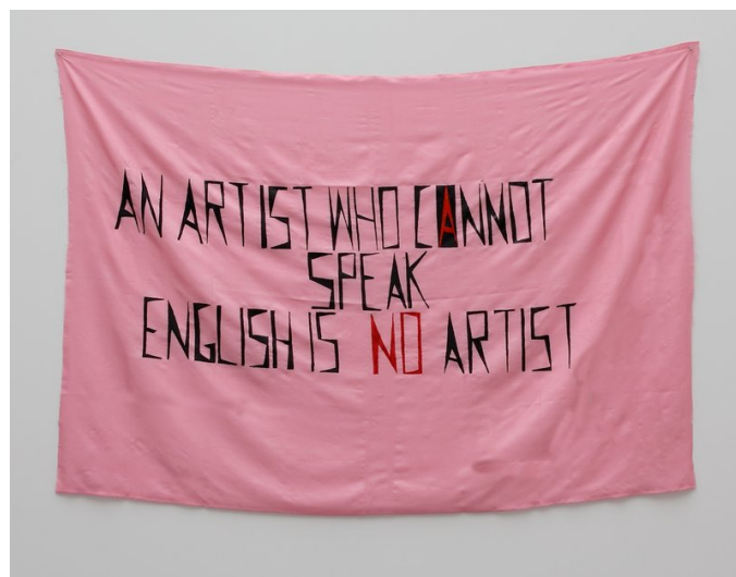
Foto 3: Mladen Stilinović – ‘An Artist Who Cannot Speak English Is No Artist’

Een voorbeeld van deze vorm van perspectiefwisseling is een kunstwerk dat midden in een zaal hangt en vrij letterlijk kritiek uit op West-Europese moderne en hedendaagse kunst door te stellen dat een kunstenaar die geen Engels spreekt, geen kunstenaar is (zie Foto 3 en 4).