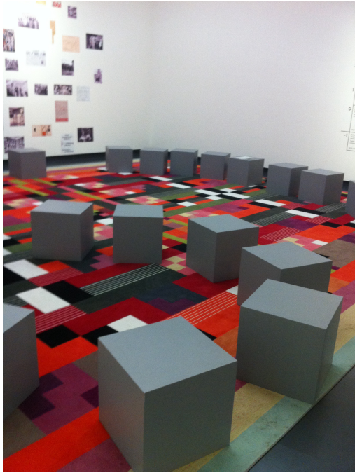
Foto 1: Krukjes in welkomstruimte Van Abbemuseum (Foto auteur, 2017).

Bij de tijdelijke tentoonstelling, 'Positions #3', bevonden zich in de entreehal twee schermen op ooghoogte. Hierop werden video's afgespeeld van de museumdirecteur en een curator die uitleg gaven over de tijdelijke tentoonstelling. Doordat enkel hun gezichten waren gefilmd en de schermen op ooghoogte stonden, leek het alsof je ze oog in oog kon aankijken en zo het gesprek met hen kon aangaan (zie Foto 2).