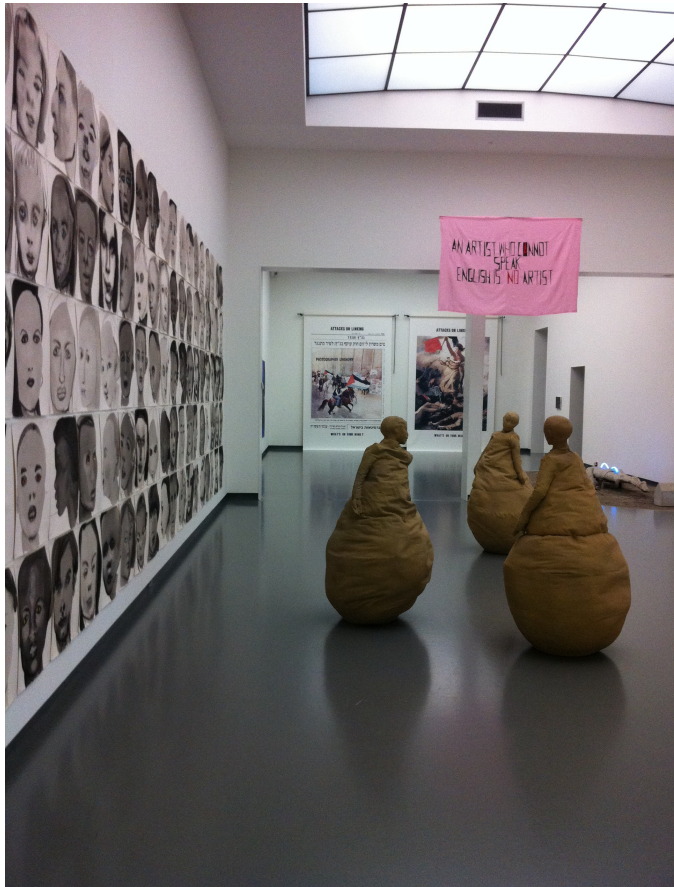
Foto 4: 'An Artist Who Cannot Speak English Is No Artist' zoals tentoongesteld in het Van Abbemuseum

Het veranderen van perspectief heeft ook te maken met het ingaan tegen de norm: "This idea of deviating from the norm, you know talking back to the mainstream" (M2). Een duidelijk voorbeeld van het ingaan tegen de norm zijn de genderneutrale toiletten van het Van Abbemuseum (zie Foto 5). Uit eigen ervaring bleek dat een mannelijke bezoeker die gebruik maakte van het urinoir, vreemd opkeek toen ik toen ik het wc-hokje naast hem uitkwam.