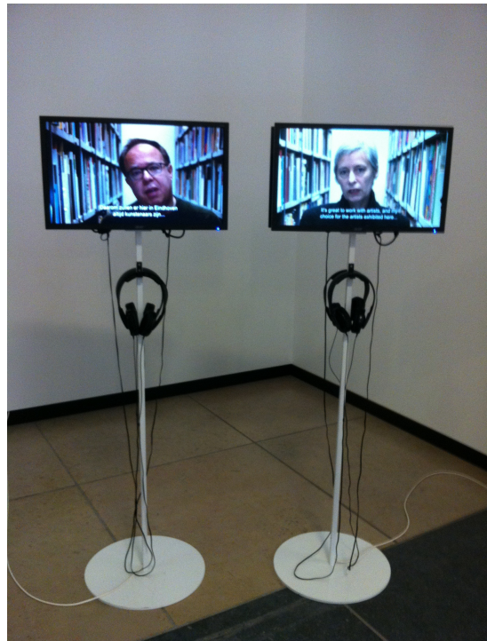
Foto 2: Schermen op ooghoogte bij tijdelijke tentoonstelling.

Bij de tijdelijke tentoonstelling, 'Positions #3', bevonden zich in de entreehal twee schermen op ooghoogte. Hierop werden video's afgespeeld van de museumdirecteur en een curator die uitleg gaven over de tijdelijke tentoonstelling. Doordat enkel hun gezichten waren gefilmd en de schermen op ooghoogte stonden, leek het alsof je ze oog in oog kon aankijken en zo het gesprek met hen kon aangaan (zie Foto 2).