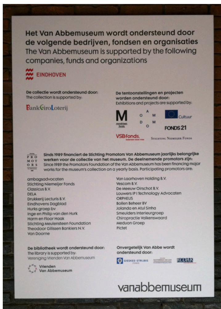
Foto 6: Bord met ondersteunende partners in entreehal.

Het Van Abbemuseum is een stedelijk museum en maakt deel uit van de gemeente Eindhoven. De gemeente wordt als belangrijke financier van het museum erkend (Beleidsplan, 2012, p. 7). Dit betekent dat waar een museum normaal een raad van toezicht heeft, dit bij het Van Abbemuseum de gemeenteraad is (M3). De gemeente geeft een aantal prestatie-indicatoren, maar bemoeit zich inhoudelijk niet met het museum, waardoor het museum autonoom blijft, volgens M3. In het museum merk je dan ook niet dat de gemeente een grote invloed heeft. Het enige dat direct opvalt bij binnenkomst van het museum is het bord waarop alle partners staan en de gemeente Eindhoven bovenaan staat (zie Foto 6).