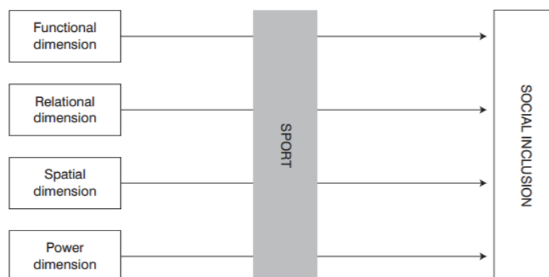
Figuur 1. Sociale inclusie door sport? (Bailey, 2008, p. 88)

Sport kan via vier dimensies sociale netwerken uitbreiden en op deze manier bijdragen aan sociale inclusie, zie figuur 1 (Bailey, 2008). Sociale netwerken kunnen opgebouwd worden door gezamenlijke activiteiten zoals gezamenlijk sporten (Bailey, 2008).