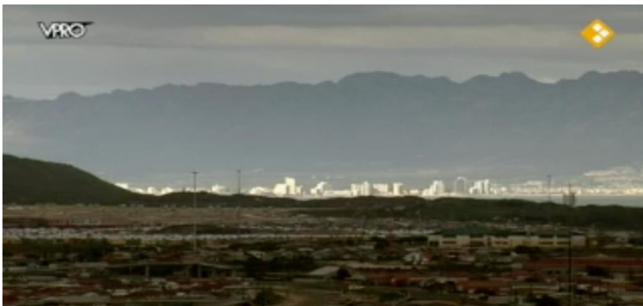
Afbeelding 7: De sloppenwijken in de schaduw van Kaapstad (segment 30)