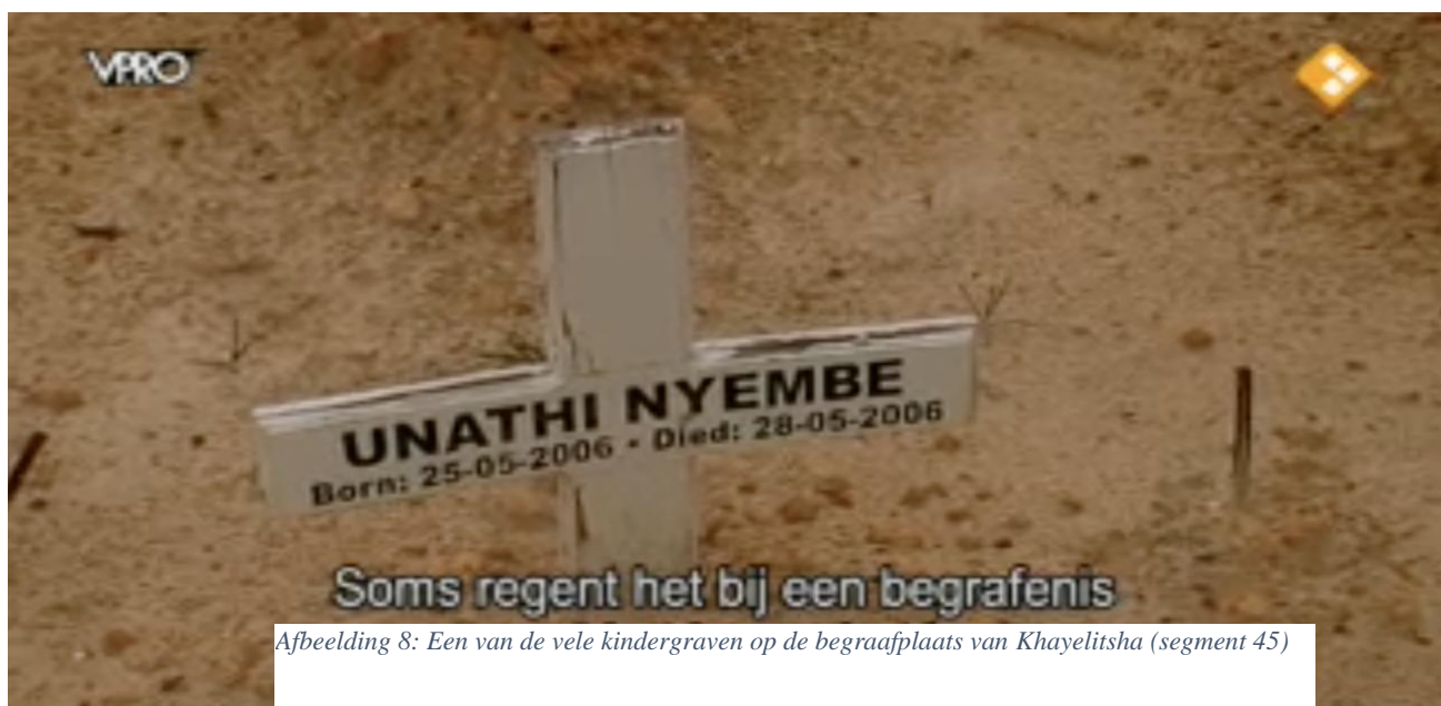
Afbeelding 8: Een van de vele kindergraven op de begraafplaats van Khayelitsha (segment 45)