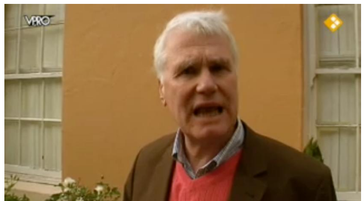
Afbeelding 6: Close-up emotie Adriaan van Dis (segment 37)