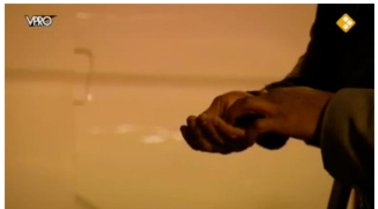
Afbeelding 4: Close-up lege hand bedelaar (segment 34)