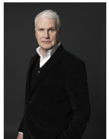
Afbeelding 2: Adriaan van Dis (Adriaanvandis.nl)

In de zevendelige documentaire-reeks ‘Van Dis in Afrika’ reist Adriaan van Dis twee maanden lang door Afrika. De serie is uitgezonden in 2008 en 2011 door de VPRO en bekroond met de Zilveren Nipkowschijf, voor de meesten de meest gezaghebbende onderscheiding op gebied van televisie (NPO, 2010). Sinds de jaren 70 van de 20 e eeuw is Adriaan van Dis regelmatig intensief betrokken bij Zuid-Afrika hij woonde en studeerde in het land. Daarnaast studeerde Van Dis af in de Nederlandse en Zuid-Afrikaanse Letterkunde. In 2011 ontving hij de Van Riebeeckpenning van de Nederlands-Zuid-Afrikaanse Vereniging voor zijn ‘langdurige bijdrage aan de culturele taalkundige betrekkingen tussen Nederland en Zuid-Afrika’ (Adriaanvandis.nl, 2017).