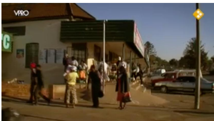
Afbeelding 5: Zuid-Afrikanen hangend op straat (segment 21)