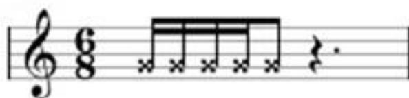
Afb. 4: Ritmefragment van Jake Holmes, “Dazed and Confused”.

Het tempo is \text{♩}=161 en de noten zijn in 12/8^{\circ} maat. De melodie wordt gespeeld in akkoorden met een open E-snaar als pedaalnoot en drone , doorklinkende toon. De melodie daalt chromatisch van G naar B met een sprong tussen E en D. Opvallend is de brugsectie waarbij het volgende ritme een aantal keer wordt herhaald en aangepast. Dit ritme wordt door verschillende instrumenten aangevuld en veranderd. Aan het einde van de brugsectie is dit duidelijk te horen en vloeit het over in het derde couplet. Dit ritme verschuift naar 6/8^{\text{ste}} .