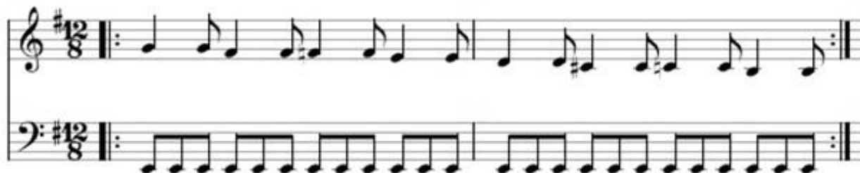
Afb. 3: Fragment van Jake Holmes, “Dazed and Confused”.

Hier heb ik de melodie versimpeld tot bastonen. Aangezien de rechter in praktijk niet kijkt naar harmonie, heb ik slechts de bastonen uitgeschreven. De pedaalnoot E heb ik op een andere staaf geplaatst zodat het makkelijker oogt.