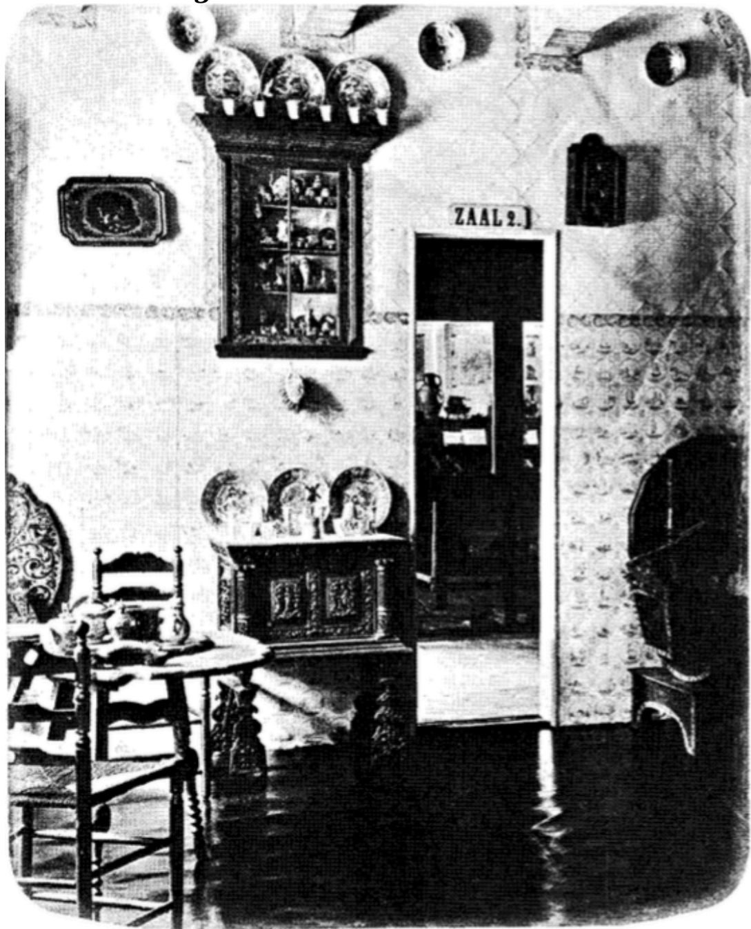
Doorkijk uit de Hindelooper Kamer in de zaal met oudheden.