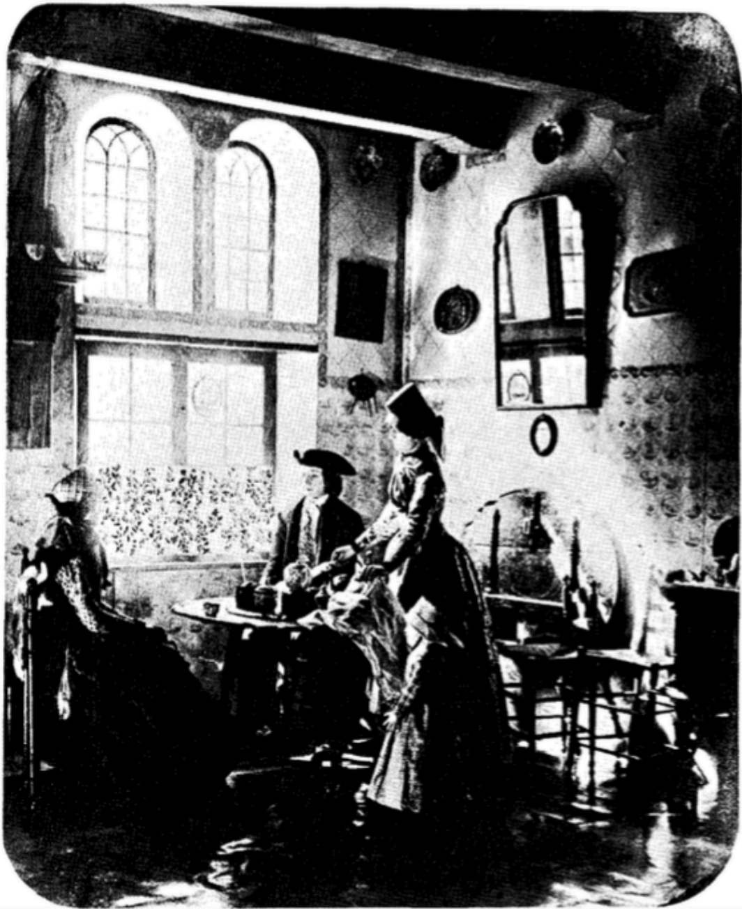
De Hindeloper Kamer.