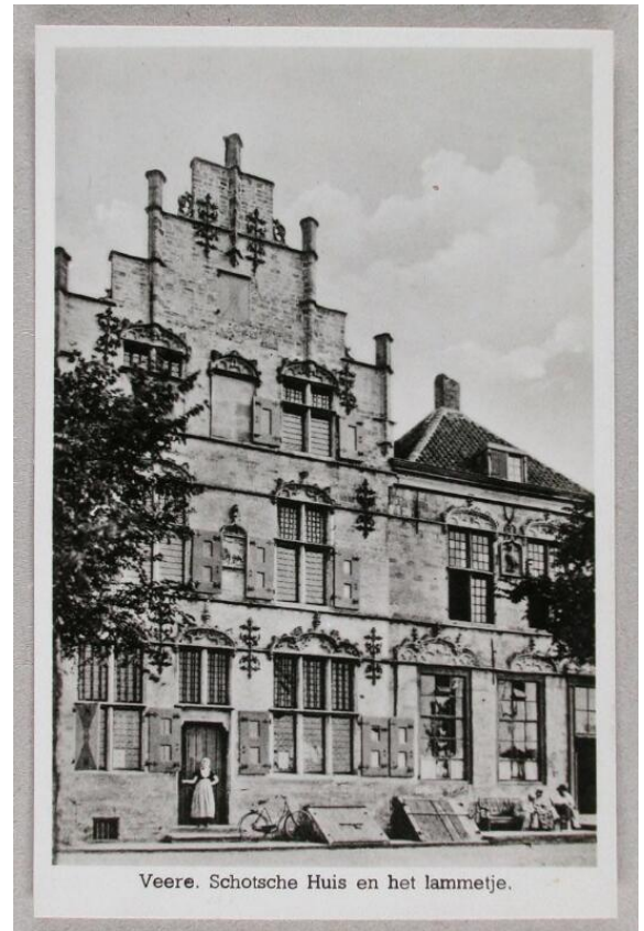
Afbeelding 1: Schotse Huizen. 78

hoofdpunten minder duidelijk terug te vinden zijn. Het eerste kenmerk van Grever is dat er vaak een verbinding werd gemaakt met plaatsen, waardoor de canon meer tastbaar werd. Dit kenmerk is duidelijk terug te vinden in de canon van Zeeland, zo zijn meer dan de helft van de vensters plaatsen zoals gebouwen of landschapselementen. Deze plaatsen staan symbool voor een breder onderwerp, een voorbeeld hiervan is venster 15: 'Schotse huizen in Veere', dat staat voor 'De Gouden Eeuw van Zeeland'. 76 Verder wordt het in de vensterteksten vaak vermeld wanneer hetzelfde verschijnsel op verschillende plaatsen in de provincie terug te vinden is, zo werd de regionale spreiding benadrukt. 77 Ook bevat elk venster in de boekuitgave tips om de plaatsen te bezoeken.