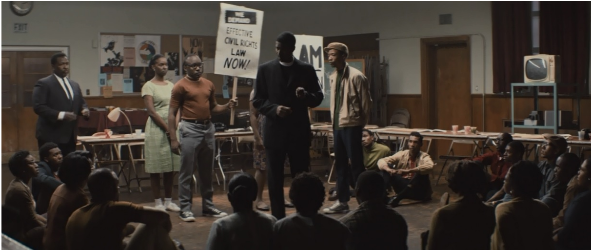
Afbeelding 7: De SCLC organisatoren leren de lokale bevolking hoe ze moeten omgaan met geweld en intimidatie ( Selma , 2014).

Er kan geconcludeerd worden dat Selma de Great Man traditie in burgerrechtenfilms grotendeels in stand houdt. Hoewel er veel aandacht is voor zijn adviseurs, SNCC en de kritiek op zijn leiderschap, blijft de film King afbeelden als de drijvende kracht achter het succes. De aanpak van SNCC wordt als een falende strategie weergegeven. Ook is er vrijwel geen aandacht voor het fundament dat lokale activisten hebben gelegd.