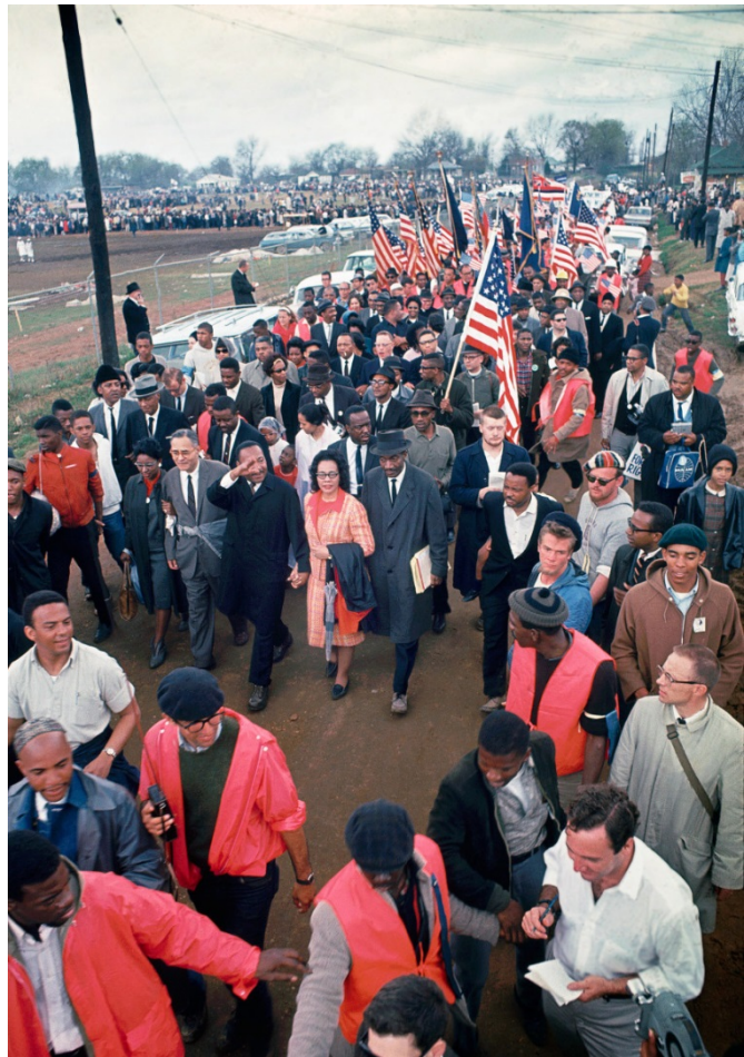
Afbeelding 1: Martin Luther King en andere burgerrechtenactivisten lopen Montgomery binnen tijdens de mars in 1965 (bron: New Yorker 2013).