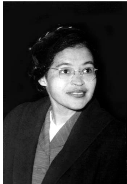
Afbeelding 3: Rosa Parks.

De manier waarop in dit perspectief wordt omgegaan met de rol van vrouwen wordt duidelijk aan de hand van Rosa Parks (afbeelding 3). Zij is een vooraanstaand figuur die in het Great Man perspectief regelmatig wordt aangehaald als moedige vrouw die zich verzette tegen segregatie. Maar in deze visie is geen aandacht voor haar organisatorische rol binnen de Montgomery Bus Boycot en de civil rights gemeenschap. Ze nam deel aan activistentrainingen van de prominente Highlander Folk School. Daarnaast was ze nauw betrokken bij de National Association for the Advancement of Colored People (NAACP). In plaats van dat te belichten wordt in dit perspectief de rol van vrouwen aangehaald als verbeelding van de grote Afro-Amerikaanse massa. In plaats