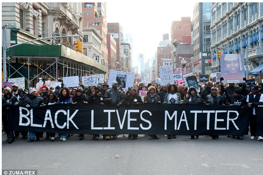
Afbeelding 2: Demonstranten lopen in 2014 de Millions March in New York als reactie op het politiegeweld tegen zwarte Amerikanen.

steeds alom vertegenwoordigd is. De activistengroep Black Lives Matter en de populaire bijbehorende hashtag tonen aan dat er nog steeds sprake is van een structureel gevoel van ongelijkheid vanuit de Afro-Amerikaanse gemeenschap (afbeelding 2). Het doel van de Black Lives Matter groep is 'to (re)build the Black liberation movement.' 12 De activisten beschouwen zich dus als een onderdeel van een historische beweging. Ongeacht of dit wetenschappelijk correct is of niet, laat dit zien dat de burgerrechtenbeweging uit de jaren vijftig en zestig nog steeds een integraal onderdeel is van de identiteit van veel Afro-Amerikanen. De doelstelling laat zien dat er sprake is van een gevoel van verwantschap met demonstranten van bijvoorbeeld SNCC, SCLC, de Black Panthers. 13 Precies daarom is het relevant om onderzoek te doen naar hoe films als Selma het beeld van deze bewegingen creëert en in hoeverre dit correspondeert met de algemene opinie in de academische wereld.