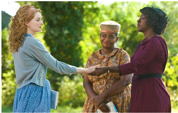
Afbeelding 4: The Help (2011) is een voorbeeld van een film die aan een aantal van Madisons criteria voldoet.

white-hero film gaat hierdoor voorbij aan de structurele, meer subtielere, institutionele vorm van racisme dat ook in het noorden van Amerika plaatsvond en nog steeds plaatsvindt. Ten tweede vindt dit type film de ervaring van witte personen belangrijker dan die van zwarte. De Afro-Amerikaanse personages, verbeeld als slachtoffers, zijn veel minder uitgediept dan de witte rollen. Dit leidt ertoe dat het publiek wel sympathie heeft voor de zwarten, maar enkel empathie heeft voor de witte. Ten derde is de relatie tussen de witte en de zwarte persoon vaak paternalistisch. Het witte personage is als een soort vader voor de passieve, afhankelijke, kinderlijke zwarte. 62 Er ontstaat een beeld van, zoals Mark Crispin Miller omschrijft, “the Black, an eternal victim who suffers beautifully.” 63 De anti-racist-white-hero filmtheorie blijft dus belangrijk om films op een diepere, subtielere white supremacist ideologie te analyseren (afbeelding 4).