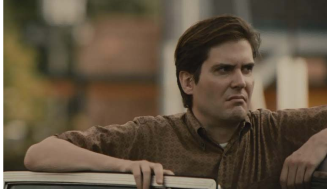
Afbeelding 9: Een witte man kijkt met afschuw naar de protesterende Afro-Amerikanen ( Selma , 2014).

De film toont zich wel traditioneel in de weergave van de strijd tussen Afro-Amerikanen en tegenstanders van raciale integratie. Door een duidelijke dichotomie kan de kijker eenvoudig de good guys van de bad guys onderscheiden. Voor witte kijkers is het een comfortabele film, aangezien de regisseur de kijker zich