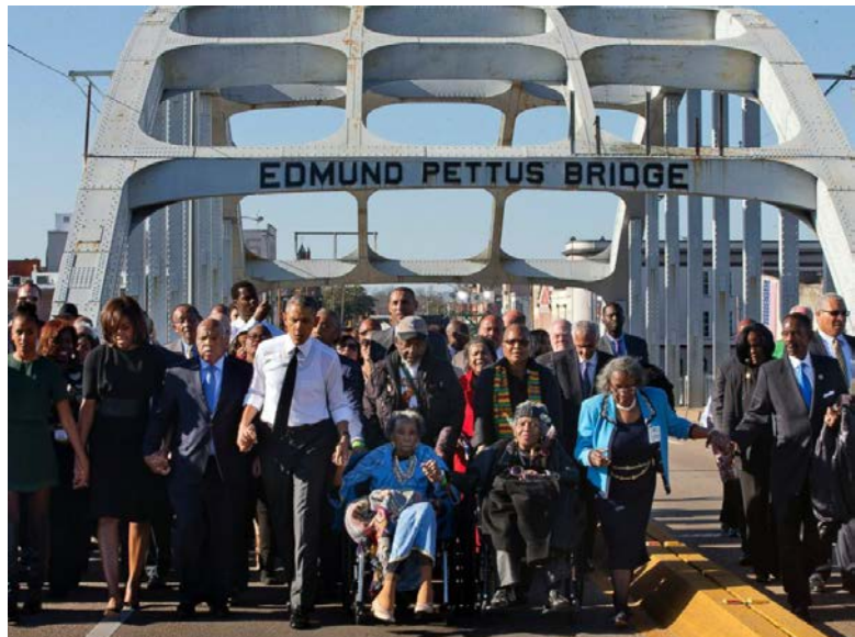
Afbeelding 10: President Obama herdenkt samen met John Lewis (links naast Obama) en Amelia Boynton (rechts van Obama) Bloody Sunday, toen vijftig jaar geleden.

De film Selma kwam vlak voor 2015 uit, een jaar waarin het Amerikaanse publieke debat rondom ras uitzonderlijk scherp was. 120 Er was dan ook veel kritiek op de Oscars toen bleek dat Ava DuVernay en David Oyelowo, die King vertolkte, niet waren genomineerd voor Beste Regisseur en Beste Acteur. 121 Afro-Amerikanen zouden alleen kans maken wanneer ze ondergeschikte rollen spelen, zoals butler of slaaf. Nog relevanter dan de machtsverhoudingen binnen de Oscars is het vraagstuk over wie bepaalt wat onderdeel is van de Amerikaanse geschiedenis en hoe er wordt herinnerd (afbeelding 10). Is dat de politiek? Is dat Hollywood? En waarom lukt het civil rights musea en films niet om aandacht te besteden aan racisme in de hedendaagse samenleving, waardoor racisme een taboe uit het verleden lijkt waar Afro-Amerikanen zich vandaag de dag niet meer op kunnen beroepen? 122 Hoe past dit binnen het sentiment dat er een samenleving zou zijn ontstaan die zo gericht is op diversiteit dat het nu sprake is van omgekeerd racisme, waarbij witte Amerikanen hun kansen om toegelaten te worden tot een universiteit zien verschrompelen door affirmative actions ? 123 De filmanalyse van Selma maakt onderdeel uit van dit overkoepelende machtsspel. Zoals de Tsjechische schrijver Milan Kundera schreef: “the struggle of man against power is the struggle of memory against forgetting.” 124