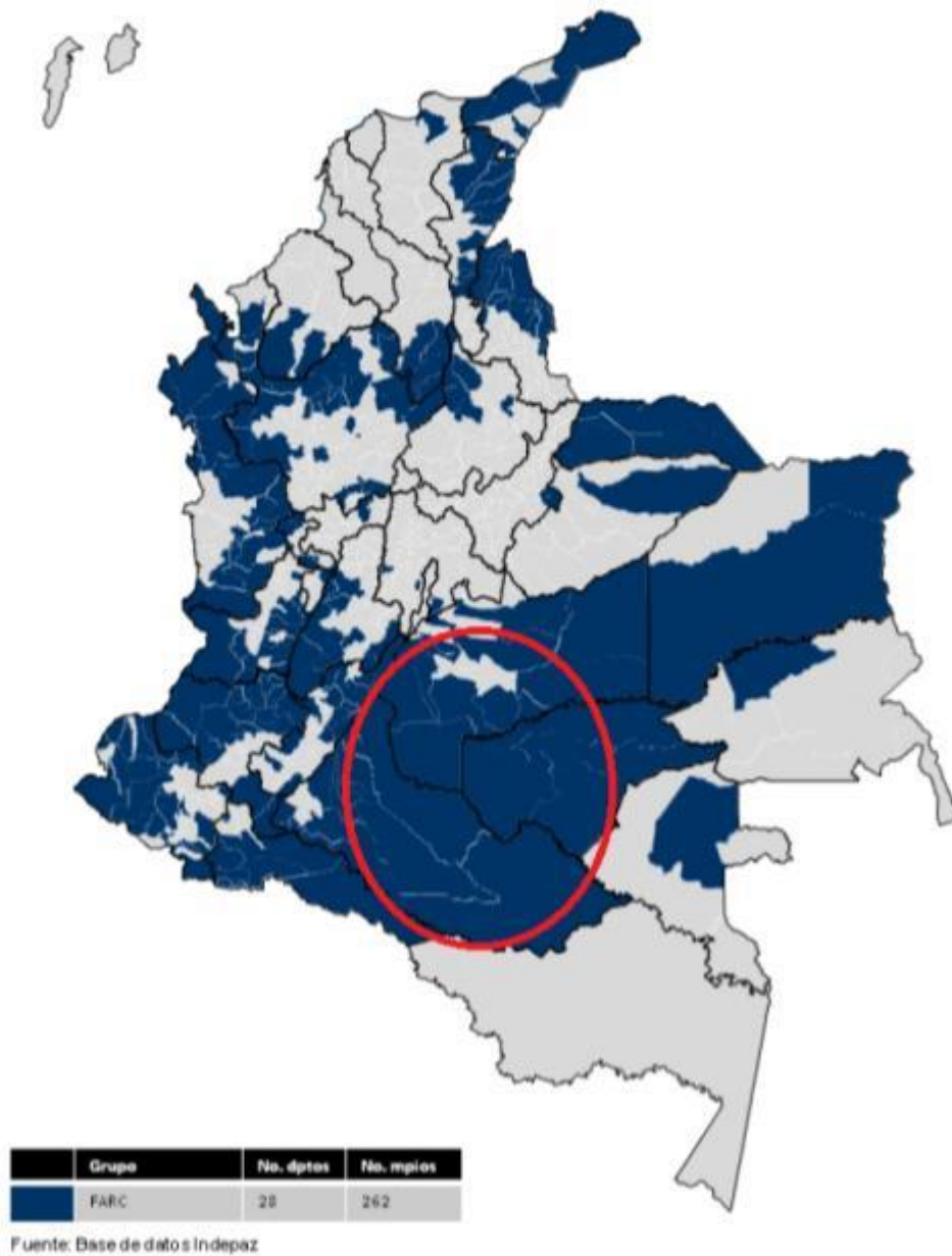
Figuur 1. De invloedssfeer van de FARC (Posso, 2012)