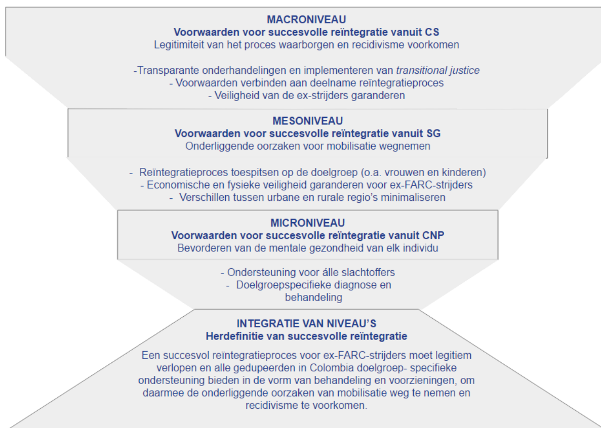
Figuur 3. Herdefinitie van ‘succesvolle reïntegratie’ door organisatie.

De organisatie van de disciplinaire voorwaarden voor ‘succesvolle reïntegratie’ heeft geleid tot de volgende herdefinitie: “Een succesvol reïntegratieproces voor ex-FARC-strijders moet legitiem verlopen en alle gedupeerden in Colombia doelgroepspecifieke ondersteuning bieden in de vorm van behandeling en voorzieningen, om daarmee de onderliggende oorzaken van mobilisatie weg te nemen en recidivisme te voorkomen”. Omdat deze herdefinitie voorwaarden behelst vanuit alle schaalniveaus, is deze meeromvattend dan elk van de disciplinaire definities van ‘succesvolle reïntegratie’.