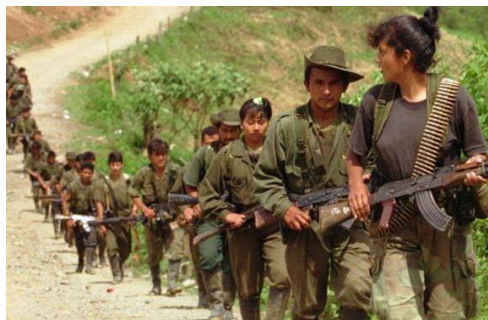
* AP, 2014