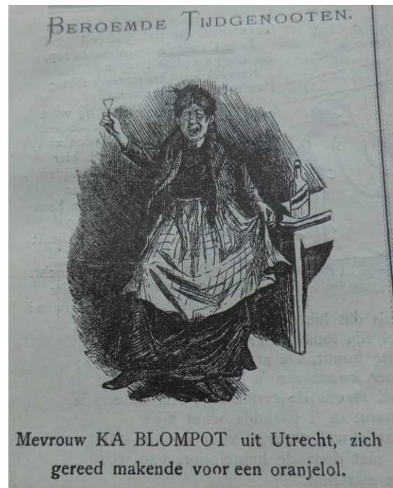
Afbeelding 2 ‘Beroemde Tijdgenooten’, De Roode Duivel , 6 maart 1893.

De belangrijkste elementen in de satire over Blommers zijn haar obsessie met het koningshuis, haar voorliefde voor jenever, haar seksuele behoeften, en haar platte taalgebruik. Daarnaast wordt haar identiteit grotendeels bepaald door weduwschap, en