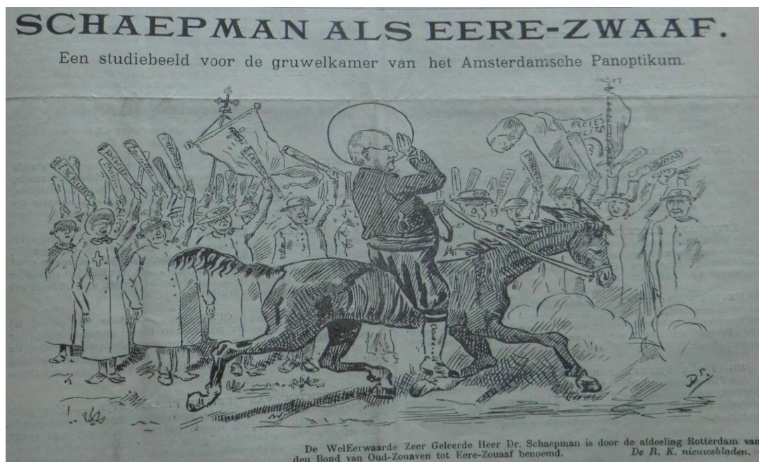
Afbeelding 4 'Schaepman als Eere-Zwaaf', Uilenspiegel , 12 februari 1894.

scheen er een illustratie van Drucker met de titel 'Mevrouw Drukte aan haar Toilet'. 89 Het gaat hierbij om een niet al te flatterende afbeelding waarop Drucker zichzelf opmaakt met een verfkwas en wordt er gesuggereerd dat Drucker een pruik draagt. Niet alleen vrouwen werden echter bekritiseerd op hun uiterlijk, ook mannen ontkwamen hier niet aan. Voor illustraties werden fysieke kenmerken uitvergroot, hiermee bleef de persoon die bekritiseerd werd herkenbaar en tegelijkertijd lachwekkend gemaakt. Een voorbeeld hiervan is de onderstaande afbeelding van de heer Schaepman. 90 Mannen werden buiten illustraties echter vrijwel nooit