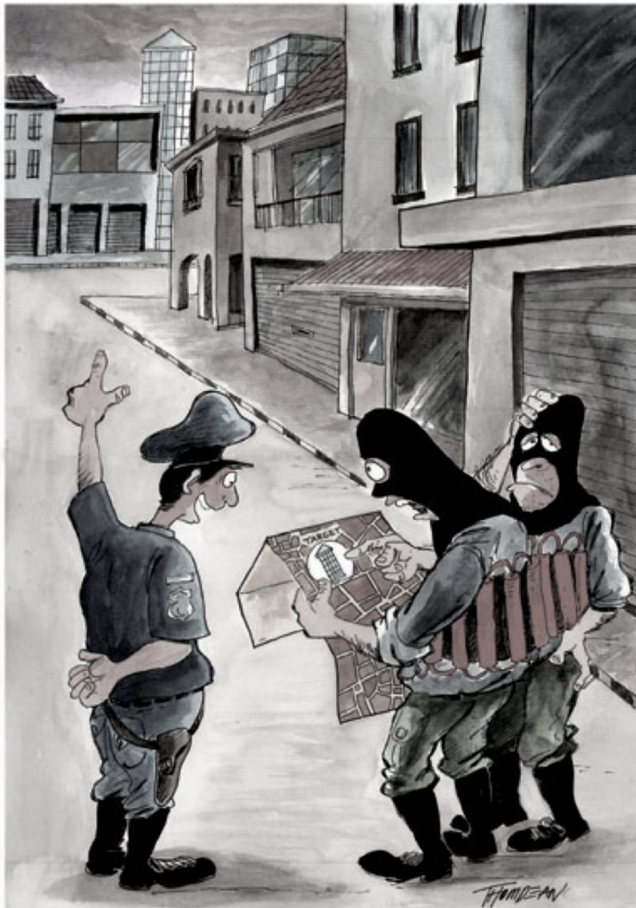
Figuur 1 – Tommy Tomdean, 'Anti Terrorism Cartoon: Indonesia' http://www.irancartoon.ir/gallery/album/489/Tommy_Thomdean_Indonesia (eigen bewerking op 26 september 2015)