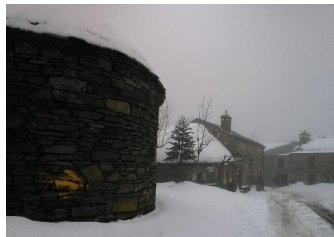
Afbeelding 11: O Cebreiro

Volgens James et al. (2012) betekent aanwezigheid op dezelfde plek niet dat zich per definitie één gemeenschap vormt. Uit observaties kan opgemaakt worden dat dit ook geldt bij deze pelgrimstocht, wanneer de gehele route als één plek wordt beschouwd. Binnen de pelgrimsgemeenschap van de tocht naar Santiago de Compostella lijken er twee soorten grote sub-gemeenschappen te ontstaan. De eerste met deelnemers die starten vóór O Cebreiro en de tweede met deelnemers die vanaf dat punt of erna beginnen. O Cebreiro is een populair startpunt op de Camino, omdat het gezien wordt als de toegangspoort tot Galicië (zie