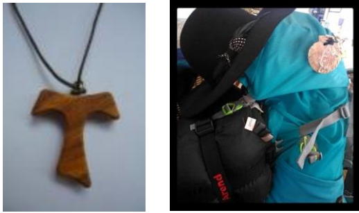
Afbeelding 9: Een Tau-kruis aan een ketting en een schelp aan een rugzak.

schelp, net als de gele pijl, een aanwijzing op de route is als wegwijzer, komt ze veel terug als decoratie in het interieur van restaurants en straatarchitectuur.