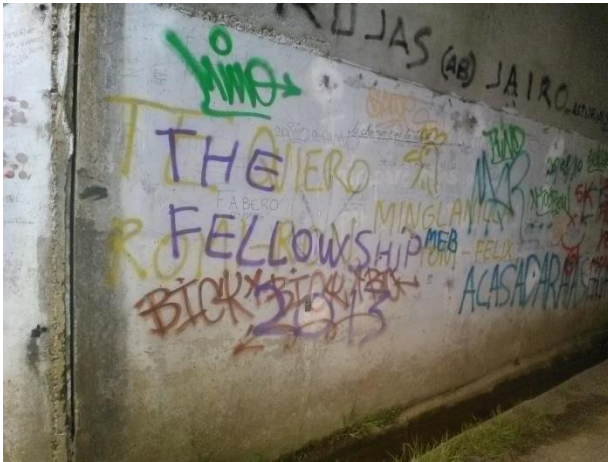
Afbeelding 4: graffiti en geschriften op een muur langs de route

pelgrimstochten gezien kunnen worden als lege ruimten waarin verschillende discoursen met elkaar kunnen concurreren. Een strijd tussen verschillende visies hebben we alleen geobserveerd over het eten van vlees en de definitie van pelgrim zijn. Over andere visies lijkt niet gedebatteerd te worden. Graffiti van groepsnamen lijkt daarentegen juist te duiden op gecreëerde collectiviteit, of volgens Turner (1974)