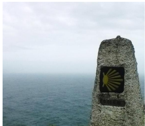
Afbeelding 1: 0.0km paaltje op de klif van Finisterre

Inmiddels komen pelgrims vanuit verschillende plaatsen naar Santiago de Compostella en behoort het tot een van de bekendste pelgrimsbestemmingen wereldwijd (Cazaux 2011: 356). De term ‘Camino de Santiago’ verwijst naar alle routes die worden afgelegd vanuit Europa sinds 1100 om de Spaanse stad te bereiken. Vaak doelt men met de term ‘Camino de Santiago’ echter op de Camino Francés , de populairste route naar Santiago de