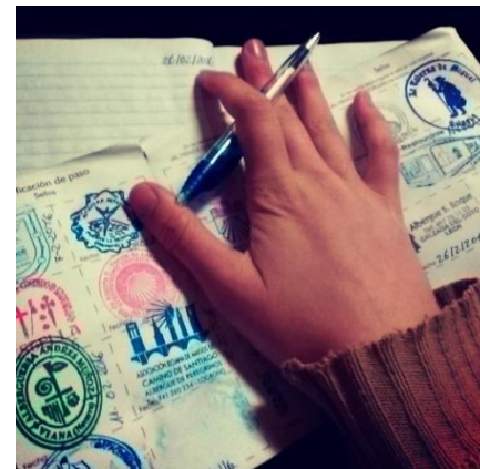
Afbeelding 10: Pelgrimspaspoort

Naast symbolen wordt de grens van de pelgrimsgemeenschap gemarkeerd door het toekennen van specifieke privilégés voor deelnemers ten opzichte van andere mensen. Het bezit van een pelgrimspaspoort (zie afbeelding 10), waarin geacht wordt stempels te verzamelen, geeft deelnemers toegang tot pelgrimsherbergen. Naast speciale pelgrimsaccommodatie zijn er ook pelgrimstaxi’s, rugzakkenservice, QR-codes met gratis pelgrimsinformatie, en pelgrimsinformatiepunten in plaatsen. Ook zijn er applicaties die deelnemers op hun telefoon kunnen downloaden met informatie over de Camino, zoals de route en telefoonnummers van herbergen.