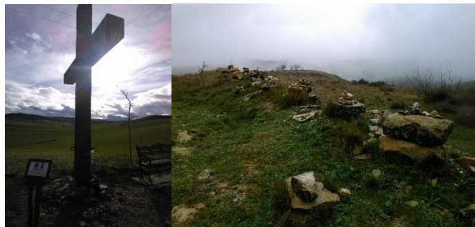
Afbeelding 3: Kruis en stapels stenen langs de route

Tijdens het afleggen van de tocht komt men ook vele symbolen tegen zoals kruizen en stapels stenen (zie afbeelding 3). Deze stenen staan symbool voor de achtergelaten lasten van deelnemers. Op muren, tafels en borden langs de route en in plaatsjes, staan vele geschriften en graffiti (zie afbeelding 4), die naast het vastleggen van aanwezigheid van een bepaalde deelnemer of deelnemers, kreten uiten over anarchisme, boeddhisme, veganisme en de definitie van een pelgrim. Op deze manier lijkt het gebied van de pelgrimstocht inderdaad een plek waar verschillende visies zich kunnen uiten en waar deelnemers non-verbaal interactief met elkaar kunnen zijn. Volgens Eade en Sallnow (2000) komt dit doordat