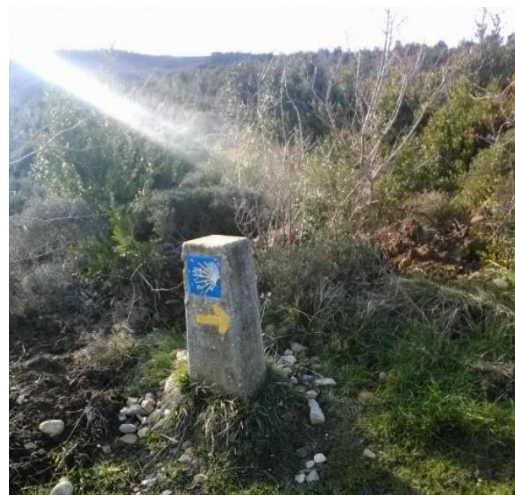
Afbeelding 6: gele pijl

De deelnemers aan de tocht volgen allemaal dezelfde gele pijlen op de weg (zie afbeelding 6). Hierdoor leggen ze allemaal dezelfde route af. De meeste deelnemers hebben het doel om Santiago de Compostella te bereiken, of dit nu in één keer is of