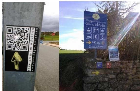
Afbeelding 5: sticker met QR-code en promotiebord voor herberg

Naast graffiti en geschriften zijn overal stickers en flyers met informatie geplakt met taxitelefoonnummers, busvertrektijden, te passeren accommodaties en restaurants, en zijn stickers geplakt met QR-codes met meer informatie voor pelgrims (zie afbeelding 5). Verschillende deelnemers zien door onder andere deze faciliteiten de Camino de Santiago