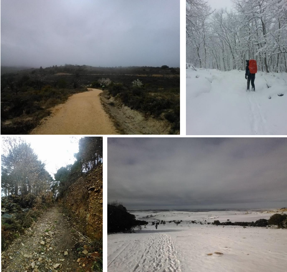
Afbeelding 2: diversiteit aan landschappen

Tijdens het afleggen van de tocht komt men ook vele symbolen tegen zoals kruizen en stapels stenen (zie afbeelding 3). Deze stenen staan symbool voor de achtergelaten lasten van deelnemers. Op muren, tafels en borden langs de route en in plaatsjes, staan vele geschriften en graffiti (zie afbeelding 4), die naast het vastleggen van aanwezigheid van een bepaalde deelnemer of deelnemers, kreten uiten over anarchisme, boeddhisme, veganisme en de definitie van een pelgrim. Op deze manier lijkt het gebied van de pelgrimstocht inderdaad een plek waar verschillende visies zich kunnen uiten en waar deelnemers non-verbaal interactief met elkaar kunnen zijn. Volgens Eade en Sallnow (2000) komt dit doordat