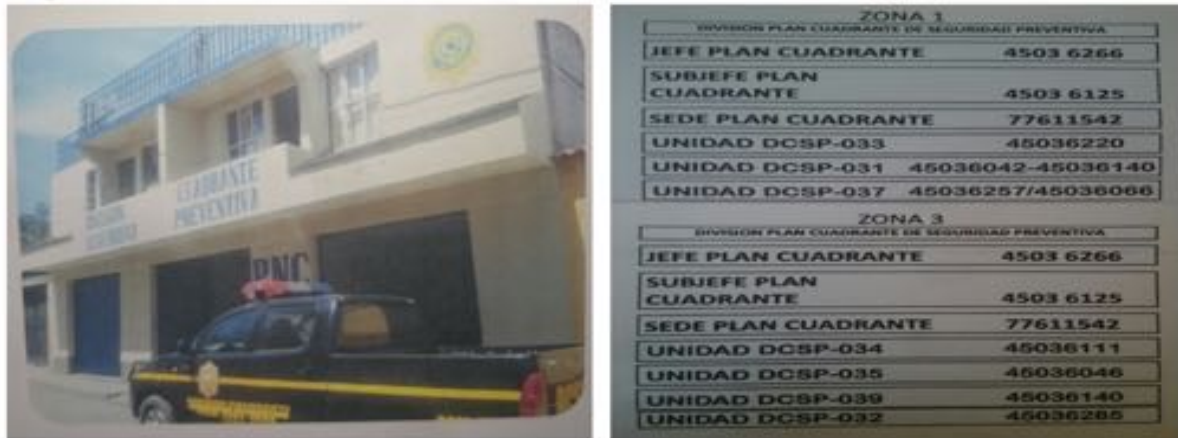
Figuur 2. Telefoonnummers Plan Cuadrante