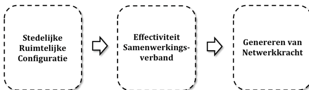
Figuur 2.1: theoretisch invloeden bij het genereren van netwerkkracht (herhaald)

Dit onderzoek stelt dat netwerkkracht in middelgrote steden kan worden gegeneerd door effectief samen te werken op regionale niveau. Deze paragraaf operationaliseert het begrip effectiviteit van samenwerking. Dit wordt gedaan aan de hand van drie invoerfactoren en drie uitvoerfactoren. Effectiviteit heeft betrekking op de mate waarin de uitvoer wordt veroorzaakt door de aanwending van de invoer.