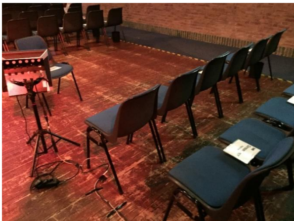
18. Het deel dat gereserveerd is voor dove gemeenteleden. 'Gereserveerd voor Doven' staat vermeld.

Aan de andere kant van de stellages staan rijen met stoelen. De stoelen zijn opgedeeld in drie blokken. Achter het rechterblok is een stoel met de zitting de andere kant op geplaatst. Bij deze stoel