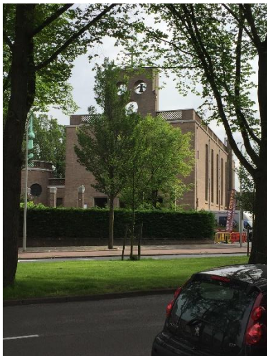
13. Het gebouw van City Life Church Den Haag.