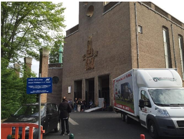
15. De toegang tot het gebouw en het plein voor het gebouw.

Buiten het kerkgebouw hangen vlaggen en banners waarmee de kerk City Life Church wordt aangeduid. Door middel van deze aanduidingen wil de kerk laten zien dat zij hier