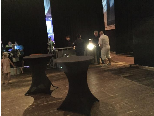
16. De doeken, de balie en de statafels.

In het hoge gedeelte van de ruimte zijn twee grote en hoge rechthoekige stellages