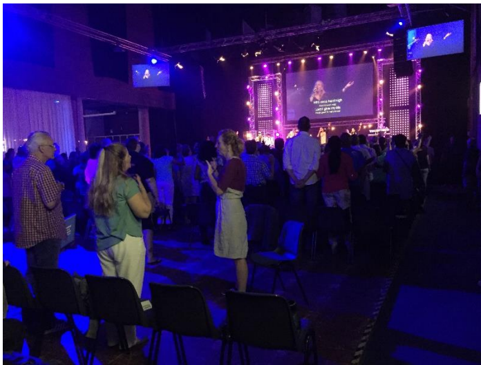
23. De tolk en enkele doven, achter in de zaal, met zicht op het podium.

leidt, is er iemand die preekt en soms zijn er tussendoor nog mensen die iets willen vertellen of willen meedelen. Daarnaast is er een band met wisselende leden. De band bestaat standaard uit een aantal wisselende zangers, gitaristen, een drummer en een keyboardspeler die samen de liederen ten gehore brengen. Tijdens het eerste nummer dat wordt ingezet gaan alle gemeenteleden staan en zij zingen of gebaren de tekst van de muziek mee. De tekst van de muziek wordt geprojecteerd op het scherm achter de band en op het scherm dat bij de doventolk staat. Op het scherm achter de band worden ook livebeelden en filmpjes getoond, zodat de zangers, de band en de sprekers ook goed te zien zijn voor mensen die verder van het podium af zitten.