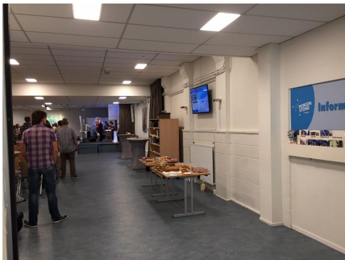
6. Vanuit achteraan in de zaal, op weg naar het podium.

luit: “Zou voor de Here iets te wonderlijk zijn? Gen.18:14”. Deze tekst verwijst naar een tekst uit Genesis 18 vers 14. Bij binnenkomst in de zaal is deze tekst het eerste wat een bezoeker of gemeentelid ziet. Deze tekst is een duidelijke aanwijzing dat de ruimte een religieuze ruimte is. Het is een ruimte waar men waarde hecht aan deze tekst. De tekst is immers niet toevallig op de muur geplaatst. De plaatsing van deze Bijbelse tekst bij de entree van de zaal is een bewuste keuze van de gemeente geweest. De tekst valt op doordat de muren en de vloer met neutrale kleuren zijn vormgegeven. Naast de tekst hangt een bord waar mensen folders met informatie over Morgenstond kunnen vinden. Ook dit bord valt op door zijn heldere blauwe kleur ten opzichte van de lichte muren. De vloer van het gehele pand is bedekt met grijsblauw zeil, de muur heeft een lichtbeige kleur. Het plafond bestaat uit een ijzeren raster met witte platen, waar tl-verlichting aan hangt. Aan de wand hangen schilderijen met verwijzingen naar het christelijk geloof, zoals een kruisvorm of een Bijbeltekst. Aan de rechterkant van de zaal is een zithoek met stoffen banken en tafels van metaal en ijzer. Aan de zijkant hangt een gordijn om de zithoek af te schermen. Vanuit de zithoek is er zicht op de straat en de gracht.