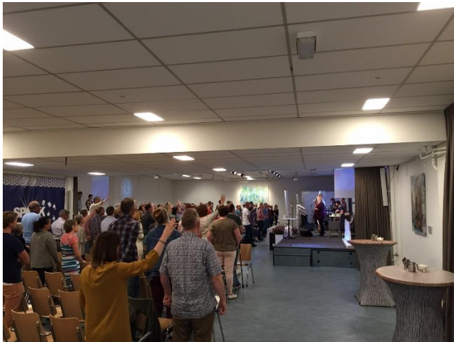
11. Tijdens een aanbiddingslied.

Er is bepaald gedrag dat voor iedereen binnen de gemeente bekend is en waarvan ze weten hoe en wanneer dit wordt gebruikt. De stoelen die voor de dove mensen en hun tolk zijn gereserveerd worden vrij gelaten. Tijdens bepaalde liederen klapt men, tijdens andere liederen