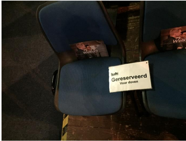
19. De stoelen met folders en het A4 met opschrift: Gereserveerd voor doven.