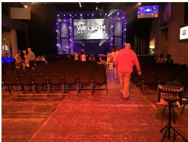
17. Een overzicht van de zaal.

geplaatst, waardoor de ruimte wordt opgedeeld. De stellages zijn bekleed met zwarte doeken en ze staan los van de muren waardoor er omheen gelopen kan worden. Tegen de linkerstellage staat een balie waar mensen informatie kunnen krijgen. Voor deze balie staan statafels die bekleed zijn met zwarte doeken. Aan de andere kant is een regietafel geplaatst met beeld- en geluidsapparatuur. Ook hangt er een lange stalen buis met een camera aan, zodat de dienst opgenomen kan worden. Achter de rechterstellage staat een aantal rijen met garderoberekken.