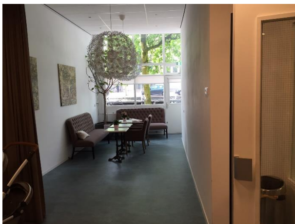
5. De zithoek. Voor deze dienst zijn een aantal tafels en banken weggehaald voor op het podium. Normaliter staan er drie banken en vier tot vijf stoelen.