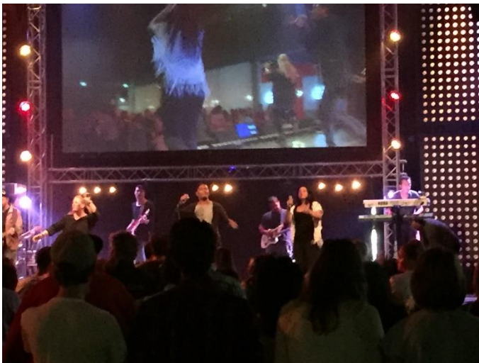
22. De band en de zangers tijdens het openingslied.

De gemeente kent een grote diversiteit aan leden. De meeste kerkbezoekers van CLC