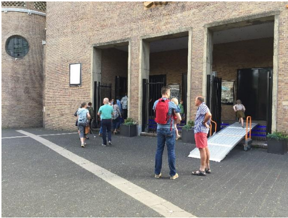
21. De gemeenteleden lopen de kerk binnen, nadat de poorten zijn geopend.

De aanvang van de eerste zondagsdienst is om kwart voor tien in de ochtend. Iedereen