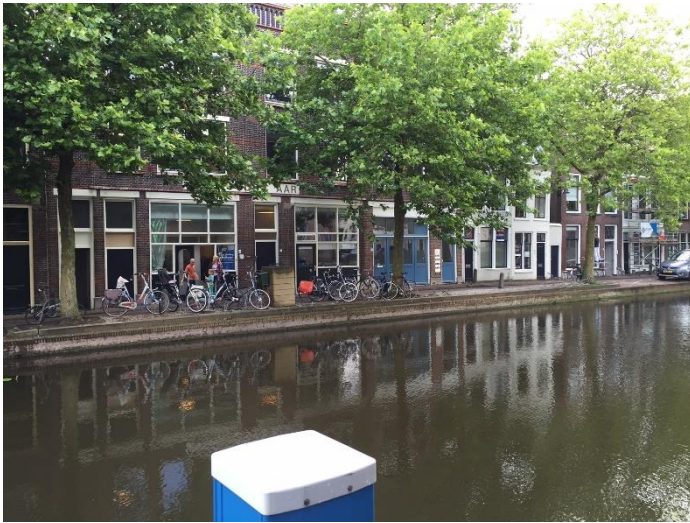
1. Het pand van Pinkstergemeente Morgenstond Gouda op afstand.

Pinkstergemeente Morgenstond heeft in 1988 een pand aan de Lage Gouwe in Gouda betrokken. Het pand ligt in het centrum van Gouda, aan het water, in een rustig gedeelte van de stad, omgeven door woonhuizen. Tot op de dag van vandaag gebruikt de gemeente dit pand voor kerkelijke bijeenkomsten zoals de wekelijkse zondagsdienst. 105 Dit pand is onderdeel van een stadsdeel