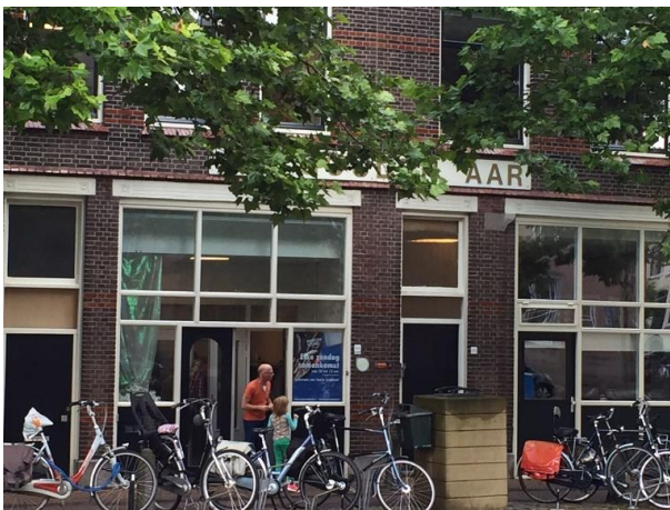
2. Entree van Pinkstergemeente Morgenstond Gouda.

Hoewel het pand van oorsprong als woonhuis bedoeld lijkt te zijn, is de uiteindelijke