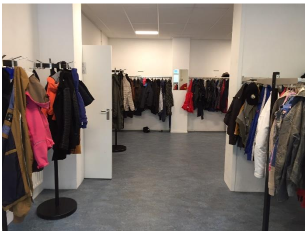
3. Garderobruimte met toegang tot toiletten en de hoofdzaal.

De gemeente heeft allereerst een poster voor het rechterraam van de voorgevel geplaatst.