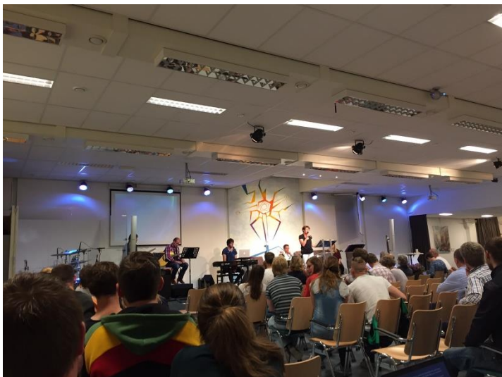
8. De inrichting van het podium.

getoond. Onder dit beeldscherm is een tafel geplaatst. Op deze tafel wordt soms etenswaar verkocht voor een goed doel, maar er wordt ook weleens zoetigheid aangeboden voor na de dienst. Zowel voor het podium als aan de zijkant van het podium staan houten stoelen met een metalen frame. De stoelen zijn met de zitrichting naar het podium geplaatst. Een van de stoelen, rechts vooraan bij het podium, staat omgedraaid. Bij deze stoel staat een staande grijze rechthoekige lamp, die over de zitplaats is gebogen. Links van het podium achter in de zaal staat een zwarte stoel waarop staat: “gereserveerd”. Deze stoel staat naar het podium gericht. Deze stoelen zijn speciaal gereserveerd voor de aanwezige doven en hun tolk, zodat de doven de dienst ook kunnen volgen.