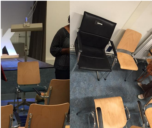
7. Deze stoelen zijn gereserveerd voor doven en hun tolken.

Dicht bij de entree is een keukenruimte met een rolluik dat de bar afschermt. Bij deze bar zijn ook verschillende statafels geplaatst. Aan de linkerkant van de ruimte staat een houten boekenkast met christelijke boeken. Deze boekenkast staat op weg naar het podium. Wanneer mensen naar het podium willen lopen komen zij dus langs deze boekenkast vol christelijke lectuur. Ook hangt er een beeldscherm, waarop informatie voor en over de gemeente wordt