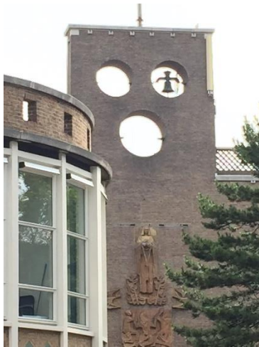
14. De bovenkant van het gebouw.

Aan het gebouw is duidelijk te zien dat het een kerk is. Het gebouw heeft een grote rechthoekige basis, waarop boven de ingang een vierkante muur is gebouwd. Aan de zijkant is