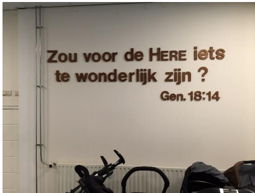
4. De tekst op de muur bij de entree van de zaal.