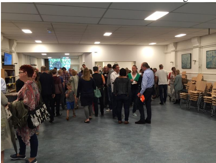
12. Samenkomst na de dienst. Deze keer werd er extra ruimte gemaakt door stoelen op te stapelen.

Na de dienst wordt er door veel leden gezamenlijk koffie of thee gedronken. Dit vindt