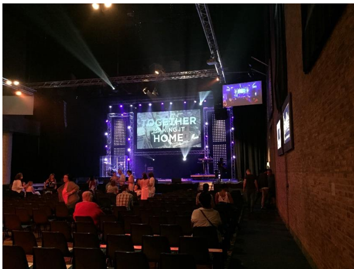
20. Het podium met de projectieschermen, de verlichting, het drumstel en keyboard.

Alle stoelen – op die van de tolk na – staan met de zitrichting naar het podium. Het is dus de bedoeling dat de kerkbezoekers hun aandacht tijdens de dienst op het podium richten.