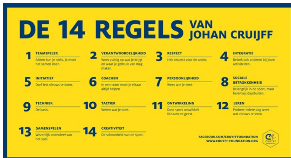
Afbeelding 2. De veertien regels van Johan Cruyff gelden als leidraad voor een Cruyff Foundation Coach. Het zijn regels die hij/zij naar eigen inzicht mag toepassen.