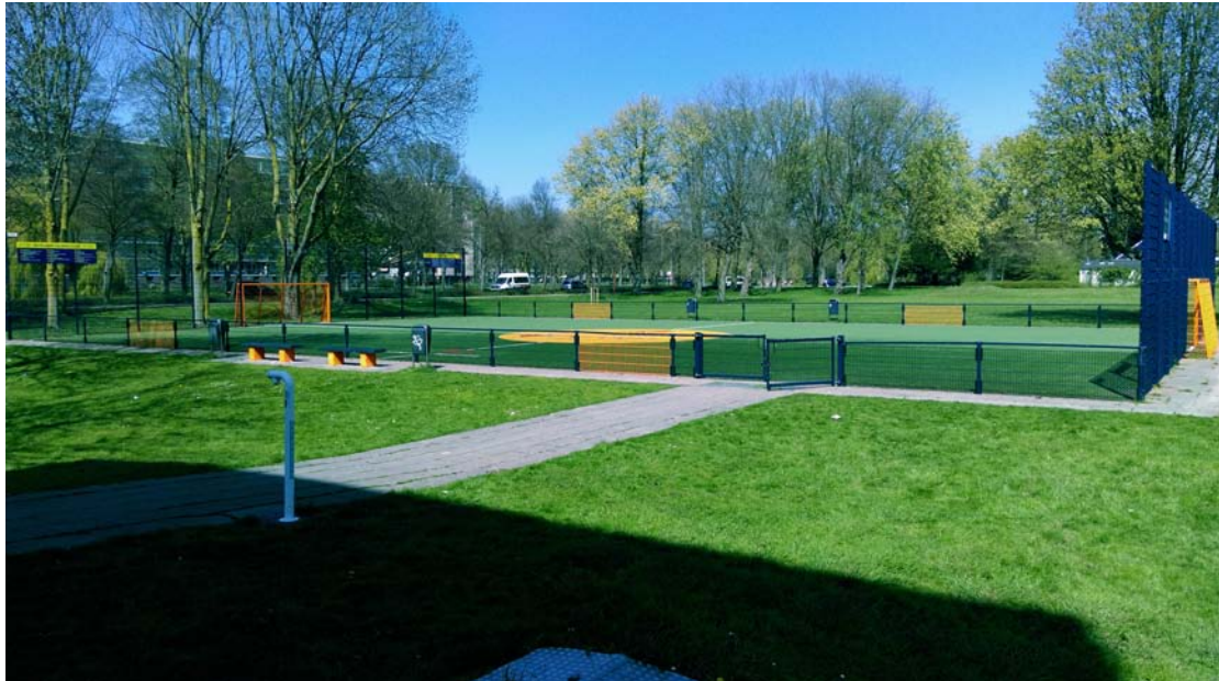
Foto 1: Het Cruyff Court in Utrecht Overvecht. Welke vormen van interetnisch contact vinden er plaats en waaraan is dat toe te schrijven?

Het Cruyff Court aan de Marnedreef is onderdeel van een multifunctioneel sport- en spelterrein. Het court is aan de zuidzijde begrensd door een Krajicek Playground dat is ingericht als basketbalveld, met aan beide uiteinden van de lange zijde twee korven. Aan de zuidzijde van de Krajicek Playground bevinden zich ook enkele speeltoestellen.