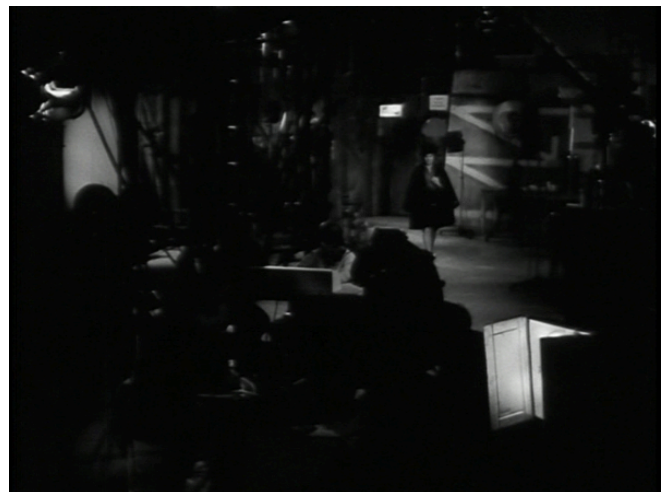
Afbeelding 20 Rietje komt de studio binnengelopen.