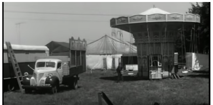
Afbeelding 9 En weer terug naar de zondagse rust