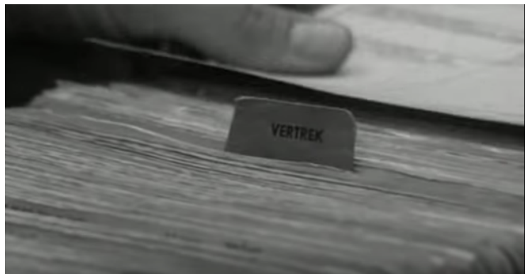
Afbeelding 1 "Vertrek", aangegeven bij het bevolkingsregister