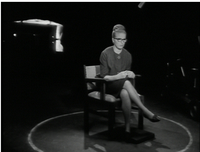
Afbeelding 19 Een harde zoemer klinkt en het meisje die aan het woord is, wordt onderbroken.