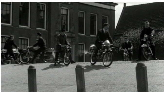
Afbeelding 8 De rust wordt verstoord door jongens op brommers