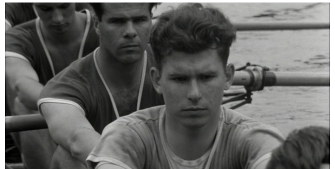
Afbeelding 11 Roeiende jongeren