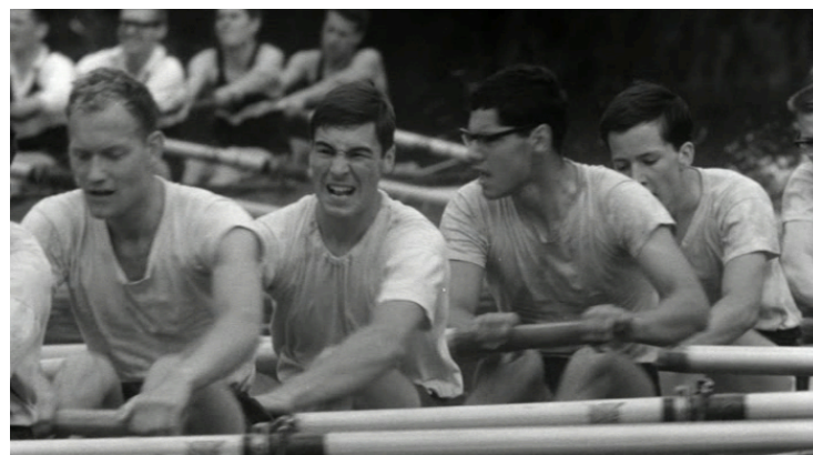
Afbeelding 12 Roeiende jongeren