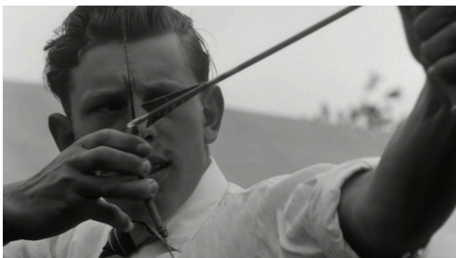
Afbeelding 13 Gemengde leeftijden bij boogschieten