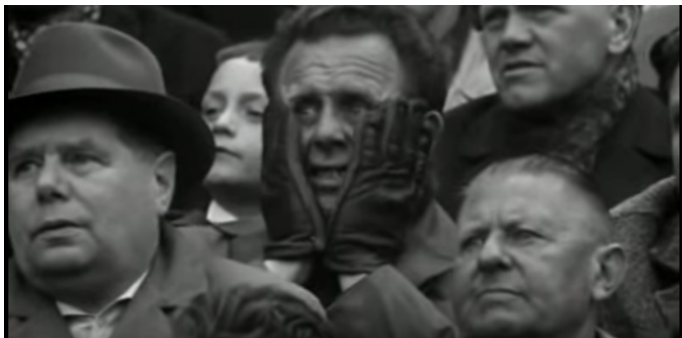
Afbeelding 10 Ouderen op de tribune bij een sportwedstrijd