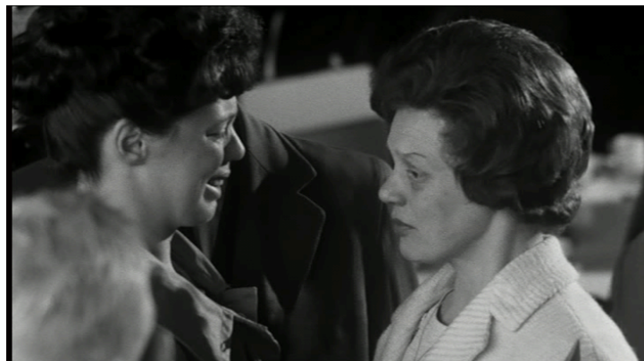
Afbeelding 2 Afscheid nemen van familie en vrienden