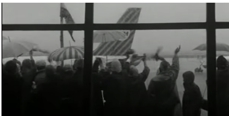
Afbeelding 5 Het vliegtuig vertrekt