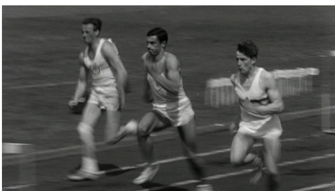
Afbeelding 15 Jongeren bij atletiek