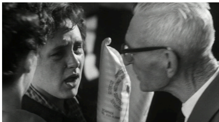
Afbeelding 4 Afscheid nemen