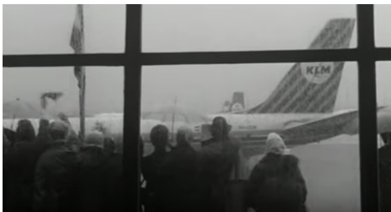
Afbeelding 3 Zwaaiende mensen bij een vliegtuig