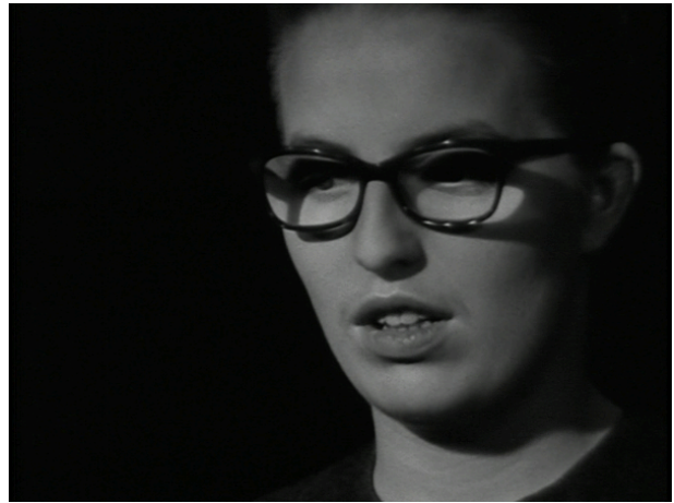
Afbeelding 24 Het meisje dat aan het woord was, gaat verder met haar verhaal.