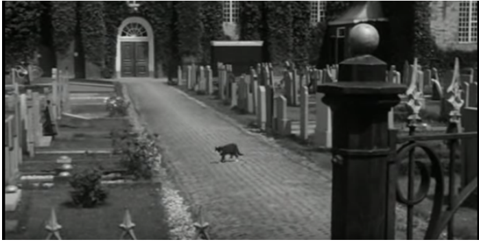
Afbeelding 6 Zondagse rust