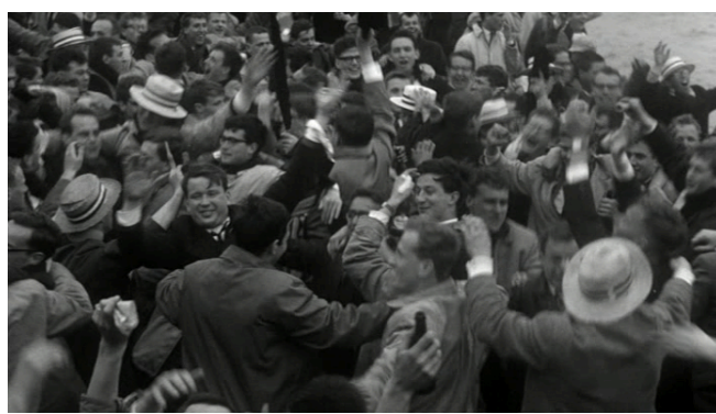
Afbeelding 16 Feestende jongeren na afloop van de wedstrijd