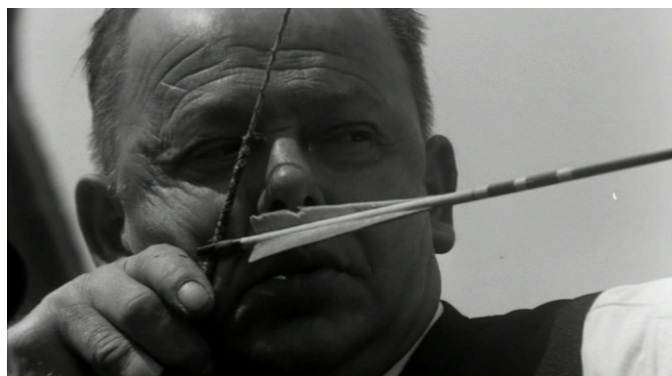
Afbeelding 14 Gemengde leeftijden bij boogschieten