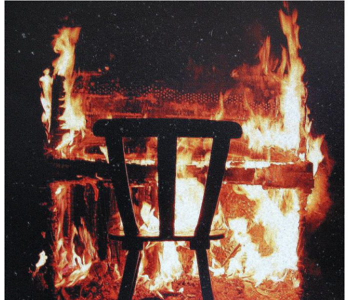
AFBEELDING 3: DE 'BURNING PIANO' EEN AUDIOVISUEEL ABSURDISTISCH KUNSTWERK, 1985.

Het gebruik van geestverruimende middelen is niet ongevoel binnen de vliegerclub. 76 Hieruit spreekt een houding van openheid in de breedste zin van het woord: niet alleen naar andere mensen en culturen, maar ook naar andere realiteiten. De verruiming van de alledaagse werkelijkheid wordt doorgevoerd in de kunstzinnige en culturele uitingen van de vliegerclub. De vliegeraars zijn, zoals in het komende hoofdstuk zal blijken, actief op zoek naar het nieuwe en het onbekende. De ene keer gebeurt dat door te reizen, de andere keer door absurdistische kunst te maken.