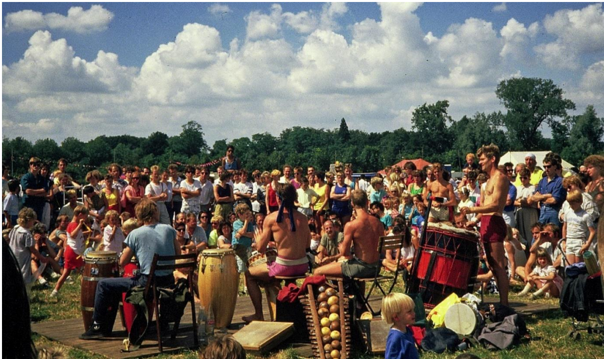
AFBEELDING 4: WERELDMUZIEK OP HET VLEIGERFEEST CA. 1983-'85.

De vliegerclub heeft daarmee een houding van openheid naar anderen, en vraagt deze houding ook van haar leden en bezoekers. Zij worden geacht om op de vliegerclub of -feesten langere tijd contact te onderhouden met mensen waar ze normaal gesproken minder snel contact mee zouden hebben. Hierdoor zorgt de vliegerclub voor een lokale community op basis van gedeelde waarden en gedeelde passie. De gedeelde waarden zijn dat ieder mens in het algemeen – en zeker op het vliegerveld – gelijk is; vrij moet zijn om zichzelf te uiten; en in vreedzaamheid moet kunnen genieten. Daarmee is er een vorm van escapisme op de vliegerclub te herkennen: de dagelijkse maatschappelijke rollen en patronen gelden er niet. Wel worden de ervaringen en waarden van de vliegerclub mee terug genomen in de maatschappij door haar leden en bezoekers. Zodoende is de vliegerclub een lokale stimulator voor kosmopolitisch gedrag: de club brengt de bezoeker in aanraking met de Ander en met kosmopolitische waarden zoals een houding van openheid, vrijheid, vreedzaamheid en gelijkwaardigheid.