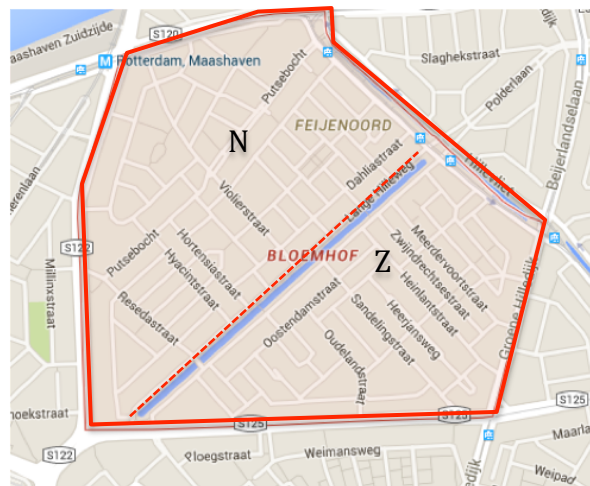
Figuur 1.1 Kaart Bloemhof

Het noordelijk deel van Bloemhof wordt gekenmerkt door een hogere mate van residentiële mobiliteit (Wijkprofiel, 2016). Residentiële mobiliteit hangt samen met de aanwezigheid van criminaliteit; een hogere mate van residentiële mobiliteit leidt tot minder duurzame sociale relaties en daardoor tot minder sociale controle, met als gevolg een hogere mate van criminaliteit (Wittebrood, 2000). Dit zou impliceren dat bewoners in het zuidelijk deel meer mogelijkheden hebben om duurzame sociale relaties aan te gaan en de sociale controle in dat deel van Bloemhof daardoor hoger is.