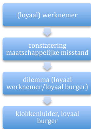
Figuur 1. Van loyaal werknemer tot loyaal burger.

Van loyaal werknemer tot klokkenluider, loyaal burger: