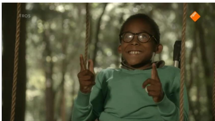
Screenshot 3 (Aflevering 8, 09:35)