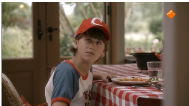
Screenshot 2 (Aflevering 2, 18:25)