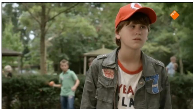
Screenshot 9 (Aflevering 1, 17:21)