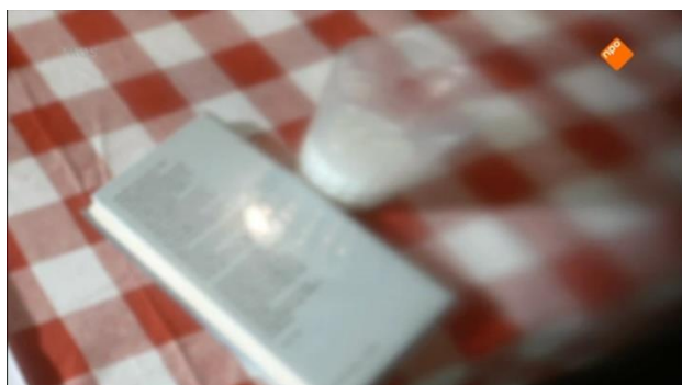
Screenshot 5 (Aflevering 1, 00:10)