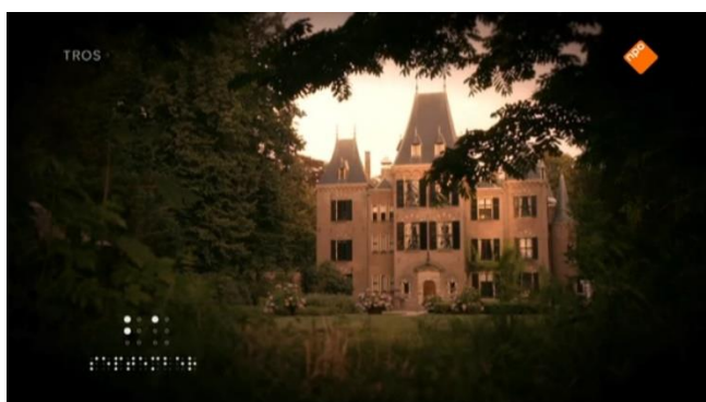
Screenshot 7 (Aflevering 1, 02:49)