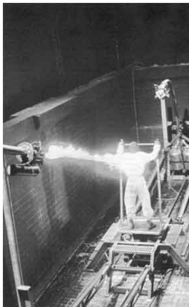
Afbeelding 4. Erik Hobijn, Delusion , brandstof, vlammenwerper en metaal, afmetingen onbekend.