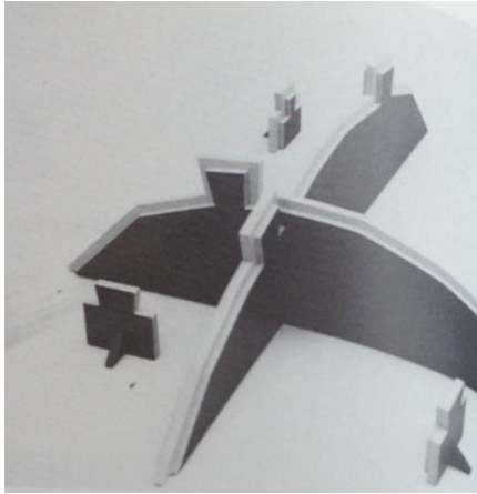
Afbeelding 1. Peter Klashorst, MS II, 1985, Formaat onbekend, verblijfplaats onbekend.