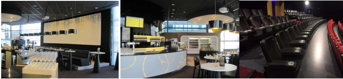
Afbeelding: Het gerealiseerde Pathé VIP-concept zoals te vinden in Eindhoven.

de zaal zelf mag je achterin plaatsnemen in luxueuze VIP seats; lederen stoelen met extra beenruimte. 61