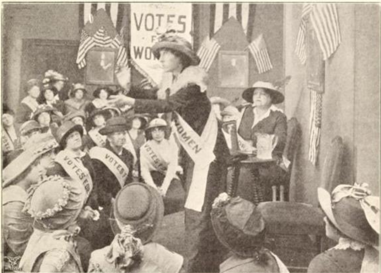
Beeld uit de film The Pickpocket (1913)

Een onderzoek naar de discussies over het vrouwenkiesrecht in Amerikaanse filmfantijdschriften