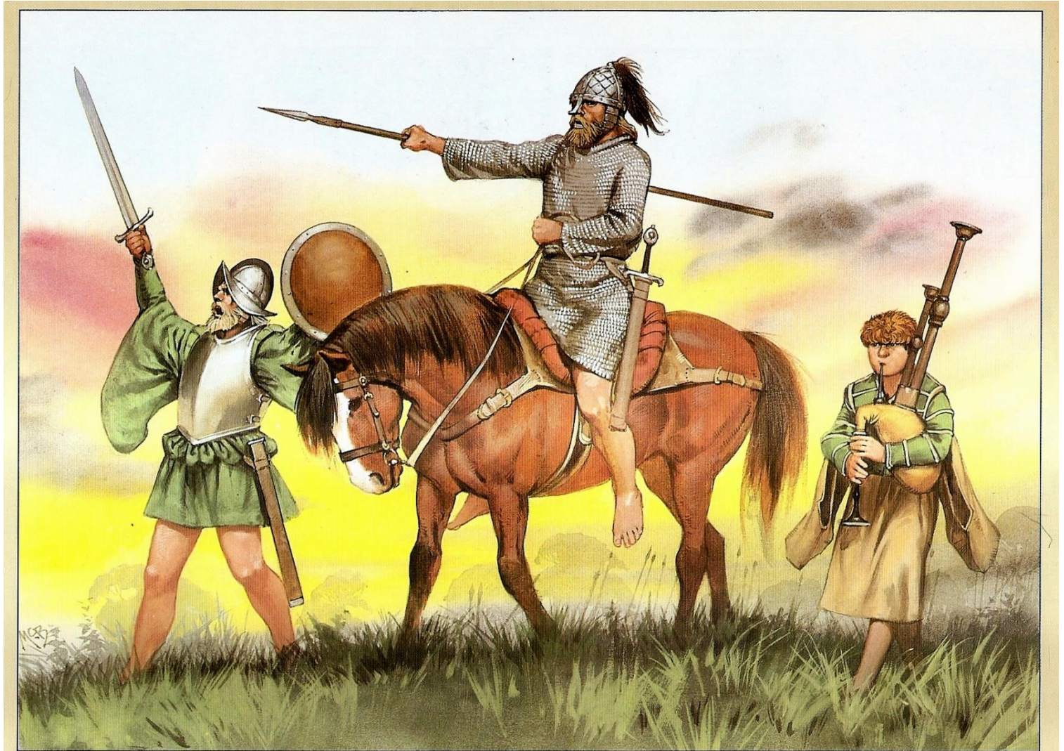
Irish warriors of the army of Hugh O'Neill charge upon the English at the battle of the Yellow Ford, Ulster, 1598.

Engelse legers veel gebruikt werden. Edward I erkende ook de waarde van Ierse hobelars bij zijn campagnes in Schotland. Hij ondernam stappen om manschappen in de Engelse shires uit te rusten als hobelars . Deze troepen speelden een belangrijke rol in Engelse campagnes tot zij grotendeels werden vervangen door bereden boogschutters tijdens de Honderdjarige Oorlog. 31