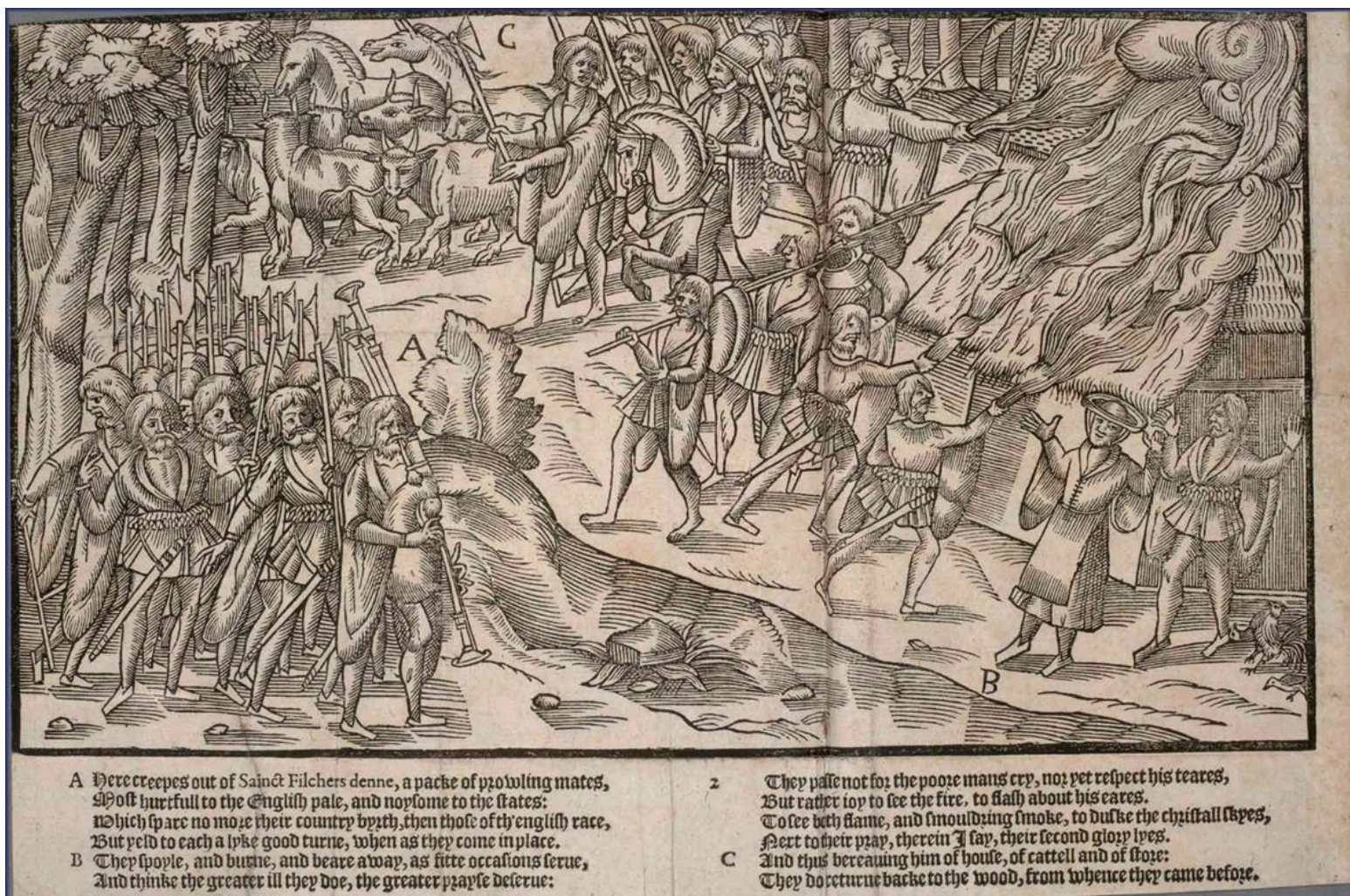
Afbeelding 3.1 Houtsnede uit 1581 door John Derrick. Een compagnie kerne steekt een boerderij in brand en gaat ervandoor met het vee. 53

Grote veldslagen en belegeringen zijn misschien wel het spannendste aspect van middeleeuwse oorlogvoering. Toch vormde de kleinschalige oorlogvoering van hinderlagen, plunderen en brandstichten het merendeel van de oorlogvoering. 52 Ierland verschilt in dit aspect niet van de andere landen in middeleeuws Europa. Desondanks kende de Ierse oorlogvoering een aantal bijzondere aspecten die ik hoop hier te verduidelijken. Ik zal in dit hoofdstuk eerst een analyse geven van de verschillende vormen van kleinschalige oorlogsvoering die door de Engelse regering in Ierland werden toegepast, om aan te tonen dat de Engelse strategie weinig verschilde van de Ierse. Vervolgens zal ik aan de hand van Katharine Simms' artikel 'Warfare in the Medieval Gaelic Lordships' dieper in gaan op de cattleraid als een van de belangrijkste vormen van Ierse oorlogvoering.