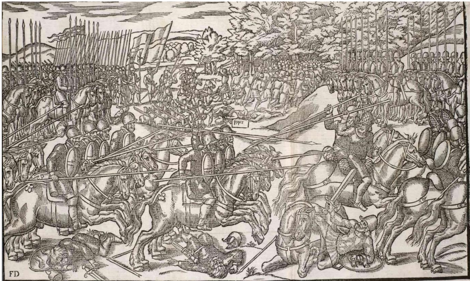
Afbeelding 2.4 Houtsnede uit 1581 door John Derrick. De Engelsen onder Henry Sidney verslaan en verdrijven de Ieren onder Turlough Luineach Ó'Neill in 1578. 37

van een pelgrimage, de Ierse heer Niall Óg O'Neill bezocht. In zijn beschrijving van de cavalerie van Niall beweert hij dat zij geen broek of sandalen droegen en de sporen om hun blote voeten bonden. Ook gebruiken zij geen zadels, maar reden op een simpel kussen. 35 Deze lichte cavalerie was dan ook niet bedoeld om (zoals de Engelse ridder gewend was) een charge uit te voeren op open terrein, met een zware lans onder de arm. Hiervoor waren stijgbeugels en een zadel nodig die de hobelars niet gebruikten. Daarom vochten zij zoals de Normandische cavalerie op het Bayeux tapestry met lange, dunne speren waarmee zij vanaf de schouder naar beneden staken (zie rechts op afb 2.4). 36