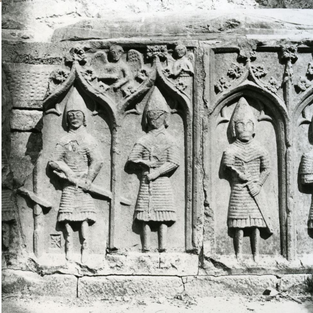
Afbeelding 2.5 en 2.6 Reliëfs zoals dit voorbeeld van Felim O'Connor's tombe tonen de bewapening van de galloglass 48