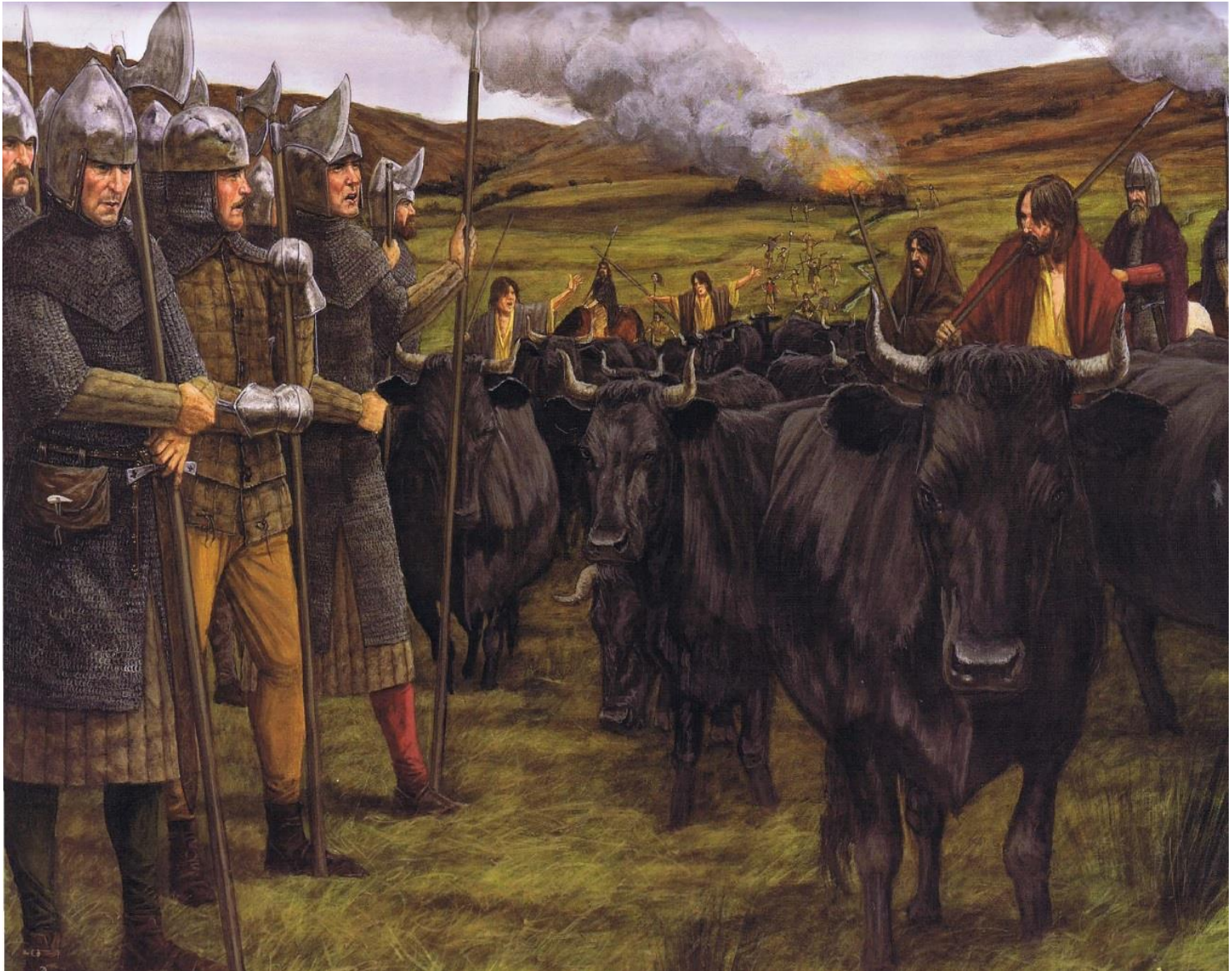
Afbeelding 3.2 Moderne illustratie van een cattleraid. Een groep galloglass overziet hoe de kerne het vee voortdrijven. 81

buit die een cattleraid direct opleverde. 79 Desondanks waren er ook veel armere en zwakkere heren die voor hun inkomen grotendeels afhankelijk waren van plunderen. 80