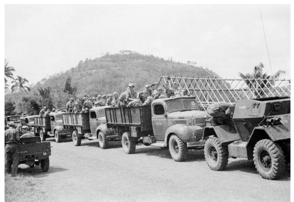
Militaire kolonne tijdens de eerste politieele actie