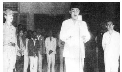
Soekarno en Hatta, 17 augustus 1945.

De Indonesische nationalistenv hadden echter hele andere plannen met Nederlands-Indië. Op 15 augustus 1945 capituleerde Japan in Azië en twee dagen later riepen de Indonesische nationalistenv onder leiding van Soekarno en Mohammed Hatta de onafhankelijkheid uit. Het duurde bijna een maand voordat het nieuwe Nederland bereikte. Toen Nederland eenmaal op de hoogte was, reageerde het verbijsterd. Dit had Den Haag niet zien aankomen. Hoewel de regering eerder aangaf dat het tijd was voor vernieuwing, was deze onafhankelijkheidsverklaring toch wel een stap te ver. Dat had niet zozeer alleen te maken met de koloniale ambities die Nederland nog koesterde,