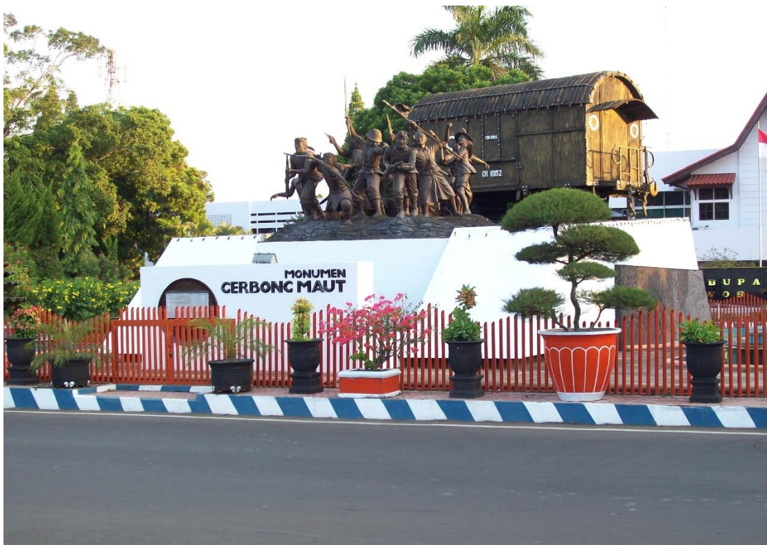
Bondowoso monument 'Gerbong Maut'