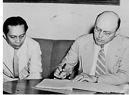
Sjahrir en Schermerhorn: ondertekening van akkoord van Linggadjati

Op 11 en 12 november in datzelfde jaar kwamen de Nederlandse en Republikeinse delegatie bijeen in het bergdorpje Linggadjati, nabij Cheribon op Java. Na vijf moeizame dagen ondertekenden beiden partijen het ontwerpakkoord. Nederland zou de Republiek Indonesië erkennen, dat gezag voert over Java, Madoera en Sumatra. De gebieden die Nederland of de geallieerde troepen op deze eilanden hadden bezet,