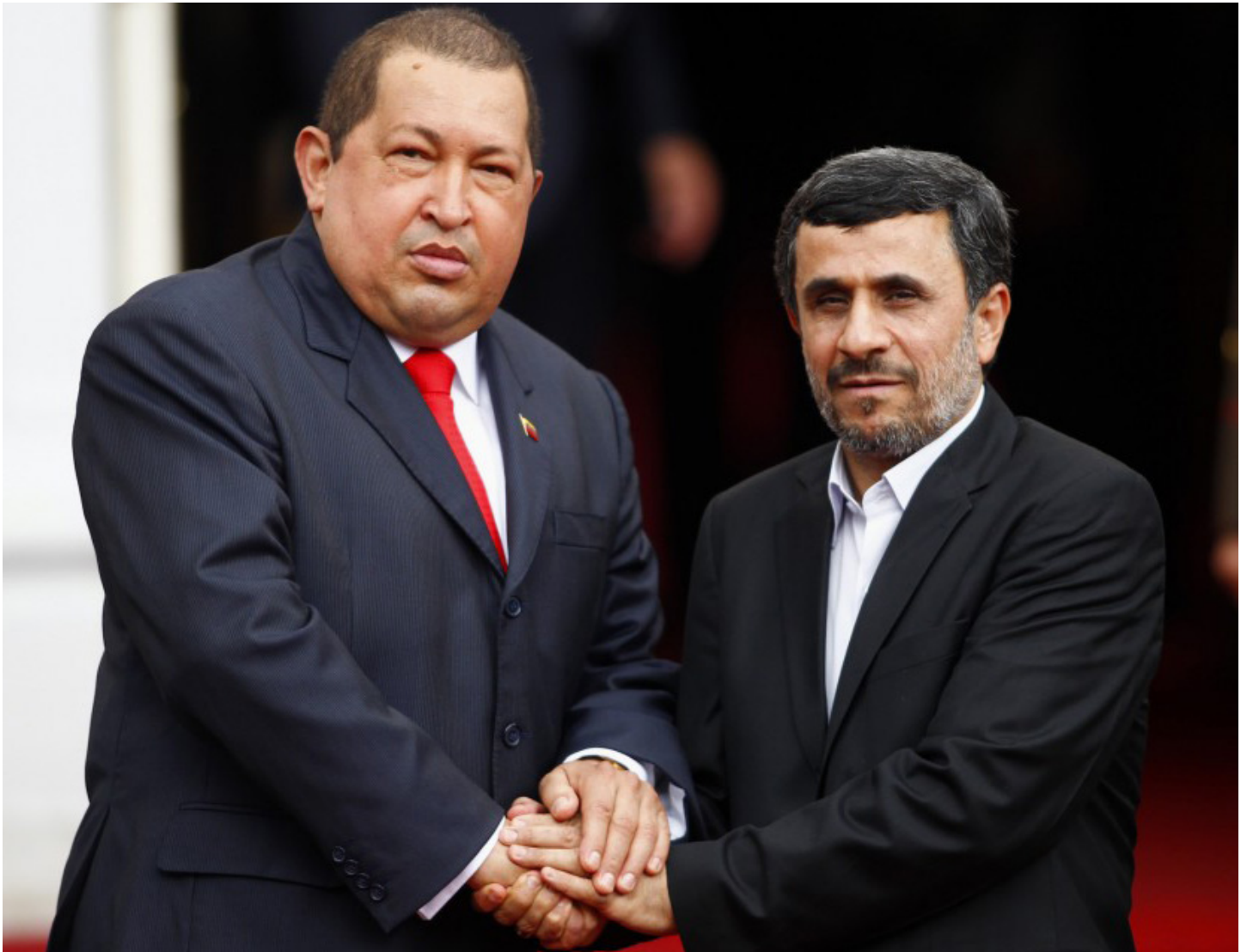
Hartelijk ontvangst in Caracas tussen president Hugo Chávez van Venezuela en president Mahmoud Ahmadinejad van Iran.

De diplomatieke betrekkingen tussen Iran en Venezuela