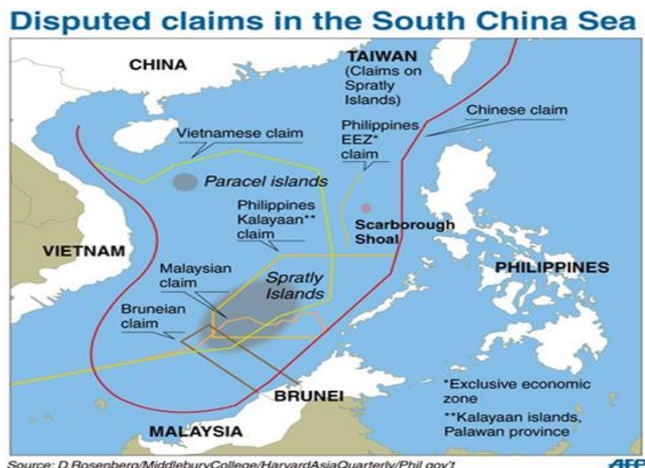
Figuur 1: Betwiste eilanden in de Zuid-Chinese Zee. 7

Het conflict werd in januari 2005 op de spits gedreven. De Chinese maritieme politie doodde negen Vietnamese vissers in de betwiste wateren bij de golf van Tonkin. 8 Het incident bracht in Vietnam een menigte op de been die demonstreerde tegen het Chinese geweld. De Vietnamese regering verbood deze betogingen en liet weten dat de goede banden met China niet op het spel stonden. Vervolgens deed in 2011 een vergelijkbaar incident zich voor waarbij een Chinees schip de kabels doorsneed van een Vietnamees schip. In Hanoi kwam het wederom tot protesten tegen China, die ditmaal oogluikend werden toegestaan door de VCP. Na een paar weken van aanhoudende demonstraties werden deze echter toch verboden. 9 Beide landen stelden publiek dat ze gezamenlijk de directe communicatie gingen verbeteren om tot een vreedzame oplossing te komen.