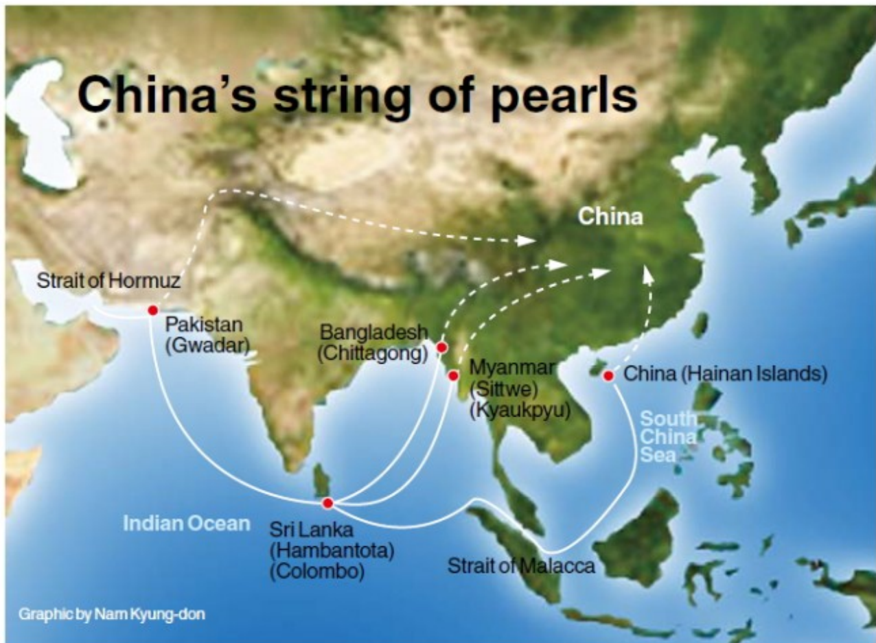
Afbeelding 2: De String of Pearls

In feite heeft India een groot voordeel. Veel landen in Azië vrezen een te machtig China en zijn maar al te bereid om haar macht in te dammen. India heeft goede relaties met Zuid-Korea, Japan, Taiwan Vietnam en Thailand. 41 Regionale samenwerkingsverbanden, met name de Association of South Asean Countries en de South Asian Association for Regional Cooperation , heeft naast haar van origine economische motieven een steeds hechtere samenwerking op het gebied van veiligheid. Hoewel India geen lidstaat is van de ASEAN groep, heeft ze bij verscheidene lidstaten een groot (zo niet het volledige) aandeel in de wapenleveranties. 42 De toenemende prominentie van China op economisch en geopolitiek gebied is ook de Verenigde Staten niet ontgaan. De banden met Pakistan zijn gedaald in belang ten gunste van de Amerikaans-Indische betrekkingen. 43 De Verenigde Staten worden vooral als economische partner en wapenleverancier