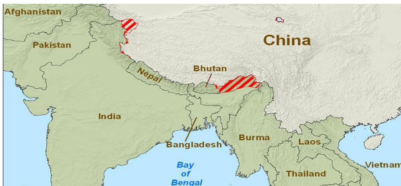
Afbeelding 1: De omstreden oostelijke en westelijke sectoren.

De tweede (oostelijke) grensaanduiding, de grens tussen India en Tibet, werd door Peking afgedaan als illegale kolonialistische praktijken. Volgens de Chinezen hadden de Britten hun macht misbruikt om een bufferzone te maken van Tibet door verdragen af te dwingen. De Britten zouden zelf niet eens geloofd hebben in de legitimiteit van de afspraken. Daarnaast waren de Tibetanen het al niet eens met hun Sino-Tibetaanse en Indisch-Tibetaanse grenzen. 14 Aan het eerste dispuut besteedden de Chinezen uiteraard geen aandacht, maar het tweede grens dispuut kwam ze goed uit. De Chinese regering had hier in feite een sterke onderhandelingspositie, want India had de regio in 1950 veroverd op Tibet tijdens de Chinese inval. Aangezien China heel Tibet claimde, eiste Peking ook de Tawang regio op. India wilde hier maar op één manier op reageren: de Chinese bezetting van Tibet als illegaal bestempelen. India ging in feite nog verder door de Dalai Lama een overheid in ballingschap op te laten richten in India. India wees verzoeken om de Dalai Lama uit te leveren (of in ieder geval het land uit te zetten) en de Chinezen als rechtmatige machtshebbers in Tibet te erkennen af.