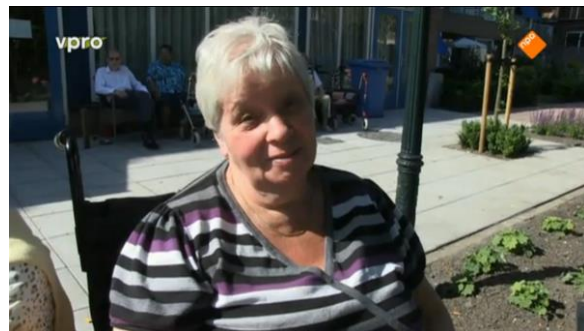
Afbeelding 75: Aflevering 3 (26.52)/s63 – Mevrouw kijkt in de camera