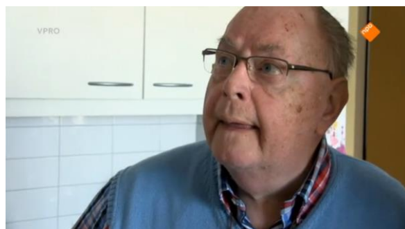
Afbeelding 77: Aflevering 1 (14.44)/s18 – Close-up Turk die vertelt over zijn overleden vrouw terwijl hij bij een foto van haar staat