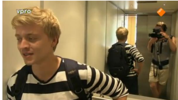
Afbeelding 4: Aflevering 2 (08.07)/s36 – Camera in spiegel lift