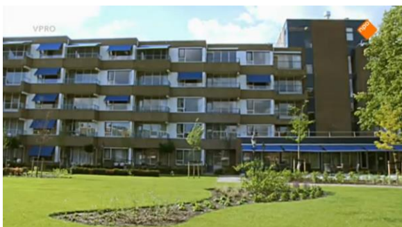
Afbeelding 56: Aflevering 1 (09.00)/s15 – Bejaardentehuis

In deze paragraaf zal gefocust worden op de cinematografie en editing. Binnen de cinematografie is de compositie en afstand van het beeld erg belangrijk. Uit de analyse van de structuur bleek al dat het lijkt of Tim en Nicolaas op weg zijn naar een afgesloten plek. Dit wordt gedurende de documentaire eveneens in beeld gebracht door diverse overzichtshots van de buitenkant van het gebouw. Het voelt als een beklemmend en afgesloten geheel. Je krijgt hierdoor de indruk dat de bejaarden in dat gebouw geïsoleerd van de samenleving zitten. Ouderen worden zo weggezet als een afgesloten gemeenschap. De individuele contrasten zoals bij de personages zijn hier niet te bekennen. Tegelijkertijd wordt hier een vorm van otherness gecreëerd. De kijker, vertegenwoordigd door Tim en Nicolaas, kijkt van buiten af naar het afgesloten geheel en maakt er geen deel van uit. Het is alsof het niet toegankelijk is voor buitenstaanders (afbeelding 56-59). Er zijn ook beelden van het gebouw die opvallend de nadruk leggen op het onderscheid tussen oud en jong (afbeelding 60-61). Deze compositie toont op de voorgrond een speeltuin met spelende kinderen en daarachter het bejaardentehuis. Het benadrukt dat ouderen een gemeenschap zijn die tegengesteld is aan jongeren. Dit beklemtonen ook andere composities in OUDTOPIA. Zo is er een shot waar Tim voor een