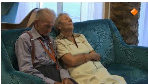
Afbeelding 36: Aflevering 1 (03.01)/s8 – Slapende ouderen

toebedeeld. Daar komt bij dat de ouderen meerdere keren slapend in beeld worden gebracht (afbeelding 36-39). De ouderen krijgen toegewezen dat ze allemaal veel slapen en weinig actief zijn. Een ander aspect dat qua lichaamstaal in beeld wordt gebracht is de onhandigheid van ouderen, dat weer aansluit bij het idee dat ze zichzelf niet meer goed kunnen redden. Nicolaas is met meneer Van de Veer mee en het lukt Van de Veer niet een bepaalde handeling uit te voeren. Hij blijft maar schreeuwen tegen een telefoon terwijl deze nog overgaat (afbeelding 40). Maar na deze scène komen er allemaal shots van andere bejaarden die aan het stuntelen zijn (afbeelding 41-43). Een ogenschijnlijk individueel geval wordt hiermee doorgetrokken op ‘alle’ bejaarden. Naast het tonen van de fysieke zwakheid zorgen de stuntelige en slapende ouderen voor een triest beeld. Hierdoor