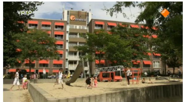
Afbeelding 61: Aflevering 3 (02.52)/s54 – Speeltuin en het bejaardentehuis op de achtergrond

groep ouderen zit (afbeelding 62). Hij is op de voorgrond waardoor de ouderen op de achtergrond verdwijnen en er een scheiding tussen hen ontstaat. Dit is ook het geval in de scène waarin Tim en Nicolaas hun housewarming voorbereiden (afbeelding 63). Zij zitten hier op de voorgrond en de ouderen op de achtergrond. Het onderscheid tussen oud en jong wordt eveneens verbeeld door Nicolaas die voor het bejaardentehuis zit. Hij zit alleen op het grasveld met daarachter het gebouw (afbeelding 64). Het gebouw vertegenwoordigt de bejaarden, waar hij door deze compositie niet bij