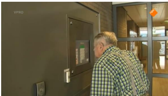
Afbeelding 40: Aflevering 1 (23.26)/s24 – Stuntelende man met deurbel