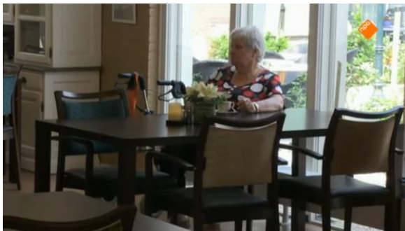
Afbeelding 70: Aflevering 1 (06.25)/s12 – Vrouw zit alleen in de kantine

natuurlijke manier naast elkaar en hun afstand tot de camera is even groot. Hierdoor wordt er geen scheidslijn afgebeeld. Dit is ook het geval als Tim bij Van de Veer aan tafel zit (afbeelding 67). Er valt vaker te zien dat tijdens het eten Tim en Nicolaas bij de oudere aanschuiven waardoor er een natuurlijke compositie tussen de ouderen en jongeren ontstaat waarin geen scheidslijn te herkennen is (afbeelding 68-69). De culturele identiteit van ouderen wordt hier dus niet verbeeld aan de hand van verschillen. Een andere terugkerende compositie is een shot waarin een ouder persoon alleen in een lege ruimte wordt afgebeeld (afbeelding 70-73). Er lijkt niemand te zijn die zich om hen bekommert, en vooral de lege stoelen die zichtbaar in de shots zijn benadrukken de afwezigheid van andere mensen. Er wordt zo de indruk gewekt dat alle ouderen eenzaam zijn. Tim en Nicolaas spreken dit ook vaak uit en er wordt veel met de ouderen over gesproken. Daar komt bij dat er in de