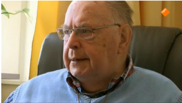
Afbeelding 78: Aflevering 1 (15.42)/s18 – Close-up Turk die vertelt over het gemis van zijn vrouw