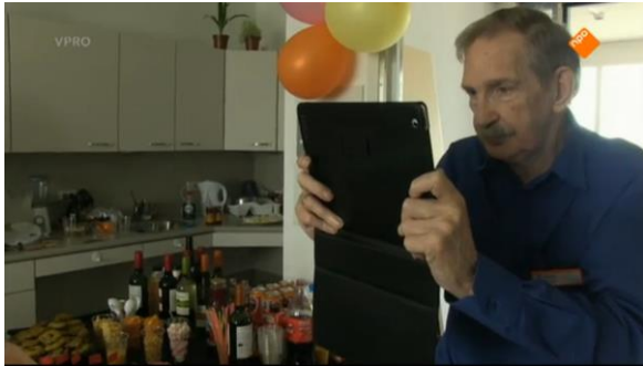
Afbeelding 48: Aflevering 1 (18.03)/s20 – Bejaarde man met iPad.