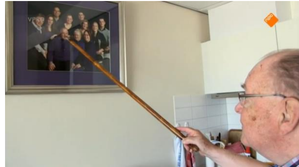
Afbeelding 55: Aflevering 1 (14.21)/s18 – Foto familie