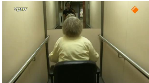
Afbeelding 29: Aflevering 2 (21.47)/s44 – Lift

ouderen moeten de lift nemen aangezien zij geen trap meer kunnen lopen. De beelden leggen de nadruk op de fysieke zwakheid van de ouderen. Er wordt hier een eigenschap op alle ouderen geplakt die lang niet voor alle ouderen hoeft te gelden.