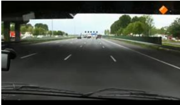
Afbeelding 11: Aflevering 1 (01.49)/s6 – Onderweg

aan de titel van het televisieprogramma UTOPIA. In dat programma verblijven mensen ook op een afgesloten plek die verwijderd en afwijkend is van de normale samenleving.