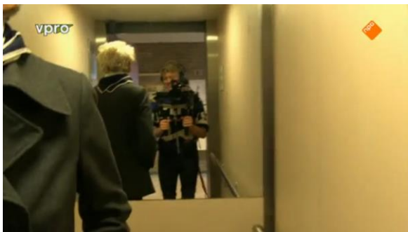
Afbeelding 5: Aflevering 3 (15.15)/s56 – Camera in spiegel lift