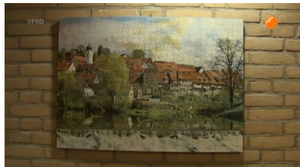
Afbeelding 51: Aflevering 1 (21.75)/s23 – Puzzel aan de muur