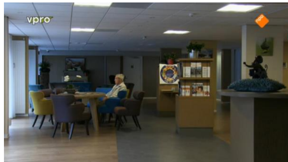
Afbeelding 71: Aflevering 2 (28.49)/s46 – Man zit alleen