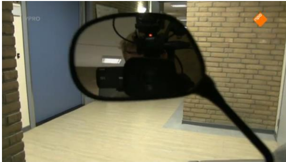
Afbeelding 3: Aflevering 1 (32.05)/s27 – Camera in spiegel scootmobiel