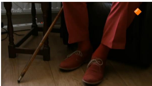
Afbeelding 22: Aflevering 1 (16.20)/s18 – Vloekende kleding meneer Turk