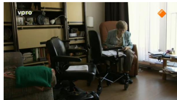
Afbeelding 73: Aflevering 3 (17.52)/s57 – Vrouw zit alleen

hele documentaire maar één keer bezoek bij een bejaarden te zien is. De ouderen hebben wel wat steun aan elkaar, maar 'de buitenwereld' kijkt niet naar ze om. Dit toont dat ouderen gestereotypeerd worden als eenzaam en dat ze van de buitenwereld zijn afgesloten.