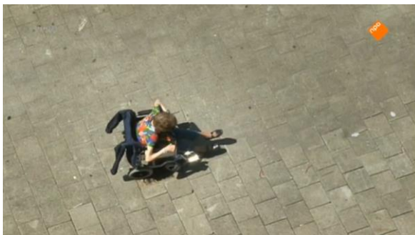
Afbeelding 42: Aflevering 1 (23.44)/s25 – Vrouw zit vast met rolstoel