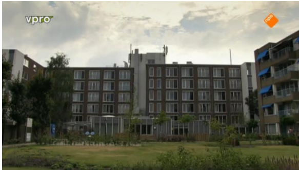
Afbeelding 58: Aflevering 2 (19.14)/s42 – Bejaardentehuis