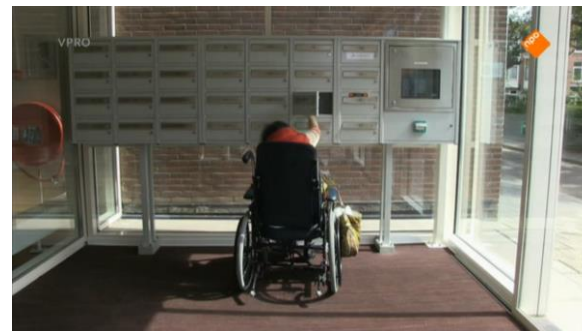
Afbeelding 41: Aflevering 1 (23.44)/s25 – Stuntelende vrouw met postvakje