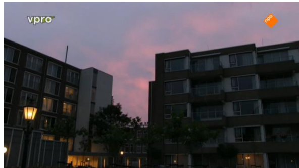
Afbeelding 59: Aflevering 3 (25.57)/s62 – Bejaardentehuis