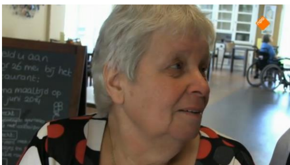
Afbeelding 76: Aflevering 1 (06.53)/s13 – Close-up terwijl een mevrouw vertelt dat het van haar niet meer hoeft

op Tim en Nicolaas als documentairemakers. Het beklemtoont dat Tim en Nicolaas achter de camera staan, wat het weer echt een project van twee jongeren maakt. De verschillen die zij met de ouderen hebben kunnen zo getoond worden en de culturele identiteit van ouderen construeren. Daarnaast valt qua afstanden op dat er gedurende de documentaire een paar sprekende close-ups van de gezichten van ouderen waarneembaar zijn (afbeelding 76-79). Het is opvallend dat dit momenten zijn waarop het gesprek over een triest deel van het leven van de ouderen gaat. Zo wordt er een close-up gebruikt bij twee vrouwen die niet langer meer willen leven. Doordat het beeld close