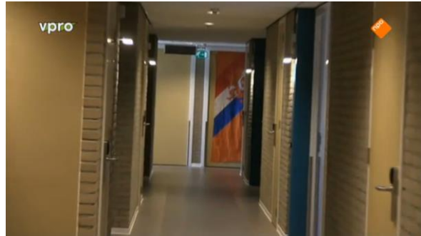
Afbeelding 49: Aflevering 2 (08.16)/s36 – Voetbalvlag op de deur van meneer Turk

hierdoor indirect op de tegenstellingen tussen oud en jong te liggen, wat de culturele identiteit van ouderen vormt. Er zijn ook voorwerpen waarneembaar, die juist een beeld van ouderen bevestigen die je op voorhand verwacht. Zoals de kleding die zij dragen, die afwijkt van de kleding van Tim en Nicolaas (afbeelding 50). Maar ook shots van puzzels aan de muur en de gedateerde inrichting van de kamers, inclusief foto's van de kleinkinderen, werken mee aan een met name ouderwets beeld van ouderen (afbeelding 51-55).