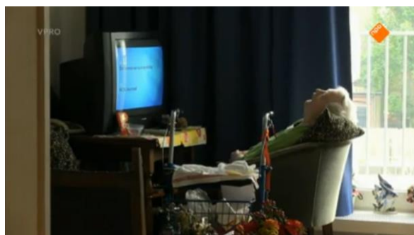
Afbeelding 37: Aflevering 1 (12.03)/s17 – Slapende vrouw