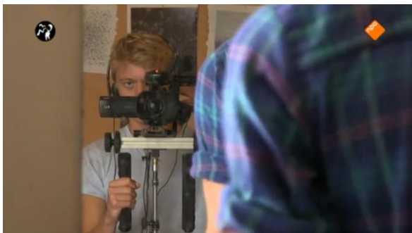
Afbeelding 1: Aflevering 1 (00.10)/s1 – Camera in beeld tijdens inpakken

Na deze samenvatting is het belangrijk te bespreken welke modi in de documentaire te herkennen zijn, om zo een nog vollediger beeld van de documentaire te krijgen. In deze documentaire vallen drie modi te ontdekken, namelijk de reflexive , performative en participatory mode . OUDTOPIA is pas tien seconde bezig wanneer de camera in beeld verschijnt (afbeelding 1). Dit wijst op de reflexive mode . Het proces van het maken van de documentaire wordt meteen getoond. Ook als Tim en Nicolaas onderweg zijn is de camera zichtbaar (afbeelding 2). Eerst is de camera in beeld doordat de dashcam deze filmt, waarna direct een shot volgt met wat de camera op dat moment opneemt. Er wordt hiermee een kijkje gegeven in de constructie van de documentaire. De