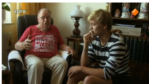
Afbeelding 53: Aflevering 2 (12.15)/s36 – Ouderwetse lamp, spullen in de kast en stoel