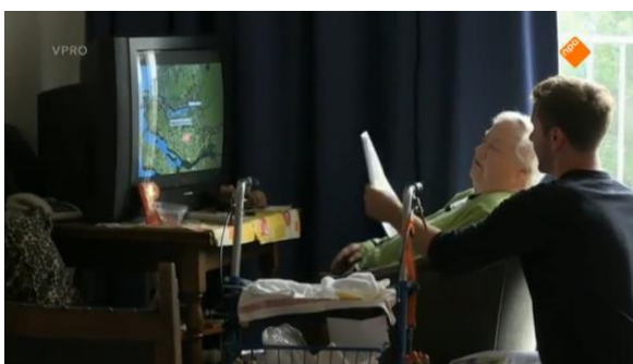
Afbeelding 52: Aflevering 2 (11.43)/s36 – Ouderwetse televisie