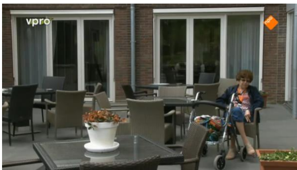
Afbeelding 72: Aflevering 3 (17.52)/s57 – Vrouw zit alleen op het terras