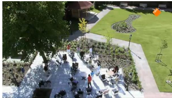
Afbeelding 10: Aflevering 1 (08.38)/s15 – De volgende ochtend, 'dag 3' verschijnt in beeld

documentaire begint met veel vragen, daarna voeren ze het 'onderzoek' uit en zowel tussentijds als aan het einde vinden er veel evaluaties plaats. Deze structuur wordt ook benadrukt doordat zowel de heen- als terugreis in beeld wordt gebracht. De heenreis duidt op het starten van het experiment terwijl de terugreis deze afsluit. Met het starten en afsluiten van het experiment wordt de documentaire ook gestart en beëindigd (afbeelding 11-14). Doordat OUDTOPIA deze structuur aanhoudt wordt de nadruk gelegd op het feit dat het leven in een bejaardentehuis voor deze jongens ongewoon en tijdelijk is. Dit verschilt van de ouderen voor wie het leven in een verzorgingstehuis de dagelijkse realiteit is. De structuur lijkt de tegenstellingen tussen oud en jong te benadrukken en zorgt er zo voor dat ouderen een eenheid vormen. Eveneens zorgt deze structuur ervoor dat het lijkt of Tim en Nicolaas vanuit de 'bewoonde wereld' vertrekken naar een afgesloten instituut. Dit zorgt ervoor dat de ouderen buiten de samenleving lijken te staan. Hierdoor worden de ouderen weergegeven als mensen die afgezonderd en afwijkend zijn van andere inwoners van de maatschappij. Deze observatie verklaart de titel van de documentaire. OUDTOPIA doet sterk denken