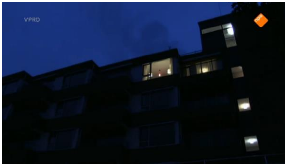
Afbeelding 9: Aflevering 1 (08.11)/s14 – Wordt getoond dat er een dag voorbij is, de nacht valt

De volgende stap is kijken naar de structuur die OUDTOPIA handhaaft. De documentaire is qua opbouw duidelijk vormgegeven als een experiment. Een belangrijk element van een experiment is de chronologie. Je wordt als kijker meegenomen in de tijd die verstrekt ofwel de periode die Tim en Nicolaas in het bejaardentehuis zitten (afbeelding 9-10). De structuur wordt ondersteund doordat de