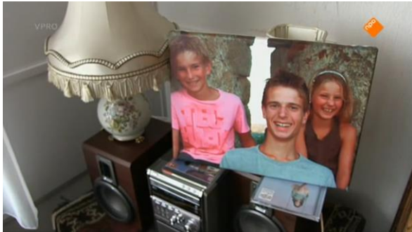
Afbeelding 54: Aflevering 1 (26.50)/s26 – Ouderwetse inrichting en foto kleinkinderen