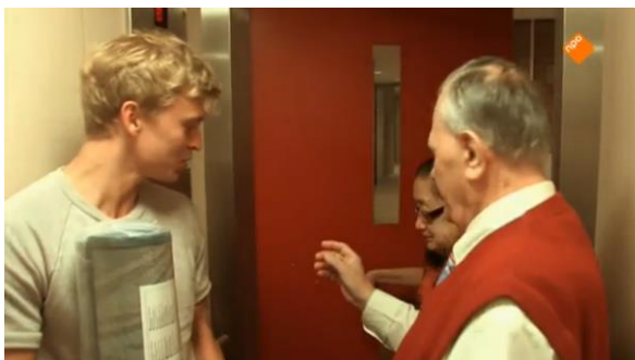
Afbeelding 26: Aflevering 1 (04.33)/s10 – Lift

duis weinig afwisseling in de setting. Het wordt snel duidelijk dat alles zich op loopafstand van elkaar bevindt. Het laat zien dat de ouderen de deur bijna niet uitkomen, en als dat wel het geval is ze nog in de tuin van het bejaardentehuis blijven. Dit toont aan dat hun leefwereld beperkt is, en dat ze afgesloten zijn van de samenleving. Je ziet de ouderen gedurende de documentaire bijna niet 'de echte wereld' betreden en zich onder andere mensen bevinden dan de mensen uit het verzorgingstehuis. Ouderen worden zo sterk gekoppeld aan het leven in een bejaardentehuis, terwijl er genoeg ouderen zelfstandig wonen. Ouderen worden hierdoor versimpeld weergegeven en daarnaast als een soort besloten gemeenschap. In de serie is de lift verder een setting die opvallend vaak terugkomt (afbeelding 26-29). Dit onderstreept de vergankelijkheid van de ouderen. De