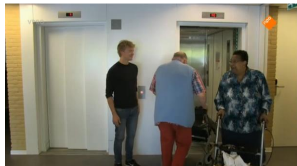
Afbeelding 27: Aflevering 1 (13.03)/s18 – Lift