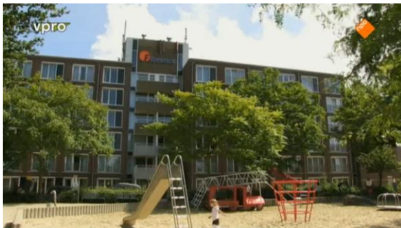
Afbeelding 60: Aflevering 2 (34.00)/s50 – Speeltuin en het bejaardentehuis op de achtergrond