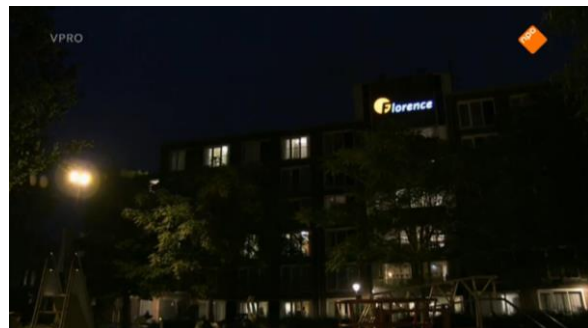
Afbeelding 57: Aflevering 1 (32.11)/s27 – Bejaardentehuis