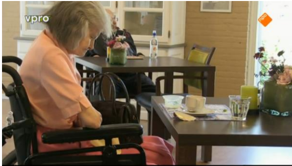
Afbeelding 38: Aflevering 2 (16.38)/s39 – Slapende vrouw