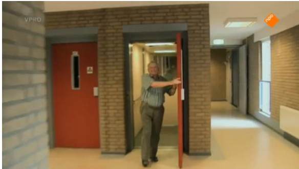
Afbeelding 28: Aflevering 1 (22.03)/s24 – Lift