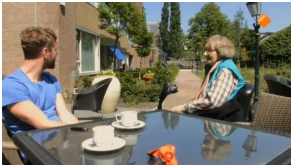
Afbeelding 24: Aflevering 1 (09.21)/s16 – Tuin

Bijna alle gesprekken en gemaakte opnames vinden plaats in en om het bejaardentehuis. Vooral de kamers van de ouderen, de kantine en de tuin keren als locatie vaak terug (afbeelding 24-25). Er is