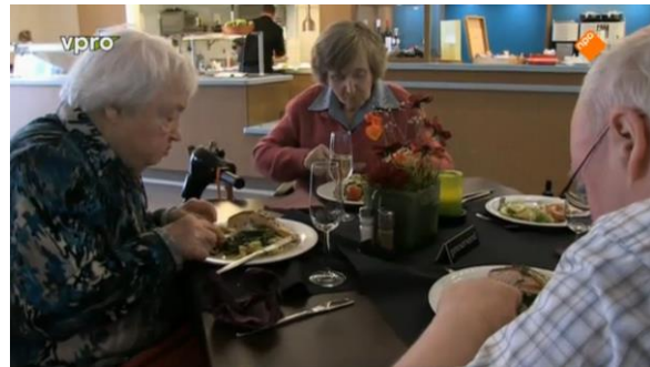
Afbeelding 25: Aflevering 1 (25.44)/s26 – Kantine

duis weinig afwisseling in de setting. Het wordt snel duidelijk dat alles zich op loopafstand van elkaar bevindt. Het laat zien dat de ouderen de deur bijna niet uitkomen, en als dat wel het geval is ze nog in de tuin van het bejaardentehuis blijven. Dit toont aan dat hun leefwereld beperkt is, en dat ze afgesloten zijn van de samenleving. Je ziet de ouderen gedurende de documentaire bijna niet 'de echte wereld' betreden en zich onder andere mensen bevinden dan de mensen uit het verzorgingstehuis. Ouderen worden zo sterk gekoppeld aan het leven in een bejaardentehuis, terwijl er genoeg ouderen zelfstandig wonen. Ouderen worden hierdoor versimpeld weergegeven en daarnaast als een soort besloten gemeenschap. In de serie is de lift verder een setting die opvallend vaak terugkomt (afbeelding 26-29). Dit onderstreept de vergankelijkheid van de ouderen. De