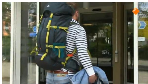
Afbeelding 12: Aflevering 1 (02.32)/s7 – Stappen het bejaardentehuis binnen