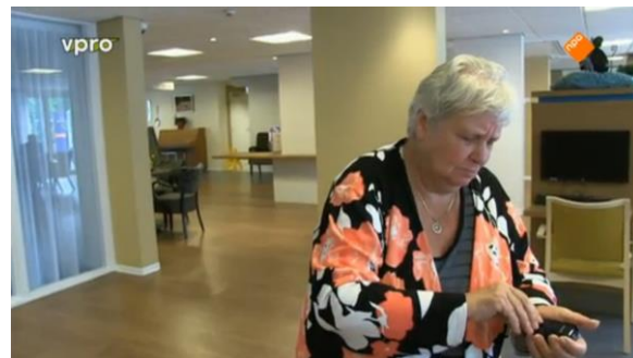
Afbeelding 43: Aflevering 2 (31.46)/s49 – Vrouw stuntelt met mobiel

lijkt het of alle ouderen ongelukkig zijn. Natuurlijk zijn er ook momenten waarop de ouderen lachen of vrolijk kijken, maar dit voert niet de boventoon in de documentaire. Dit is ook terug te zien bij de expressies van Tim en Nicolaas (afbeelding 44-45). Zij worden geconfronteerd met de moeilijke dingen uit het leven van de ouderen. Deels verkleint dit de tegenstelling tussen oud en jong. Tim en Nicolaas leven zich in in de ouderen en kunnen met ze mee voelen. Maar deels vergroot dit ook het contrast. Tim en Nicolaas worden door de ouderen geconfronteerd met hun angsten voor het ouder worden en de eenzaamheid en saaiheid van hun leven. Maar in tegenstelling tot de ouderen geldt dit nog niet voor hen. Ze worden er enkel mee geconfronteerd. De expressies kunnen het trieste