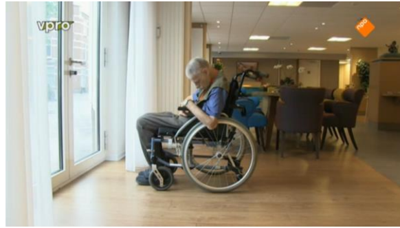
Afbeelding 39: Aflevering 2 (16.43)/s39 – Slapende man