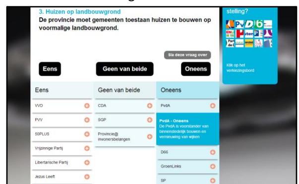
Afbeelding 4. Schermweergave partijstandpunten

Wanneer de gebruikers wel op het verkiezingsbord drukken, krijgen ze het standpunt van de partijen per antwoordoptie te zien, zie afbeelding 4. Wanneer de gebruikers op het kruisje drukken, krijgen ze extra toelichting bij het standpunt van de