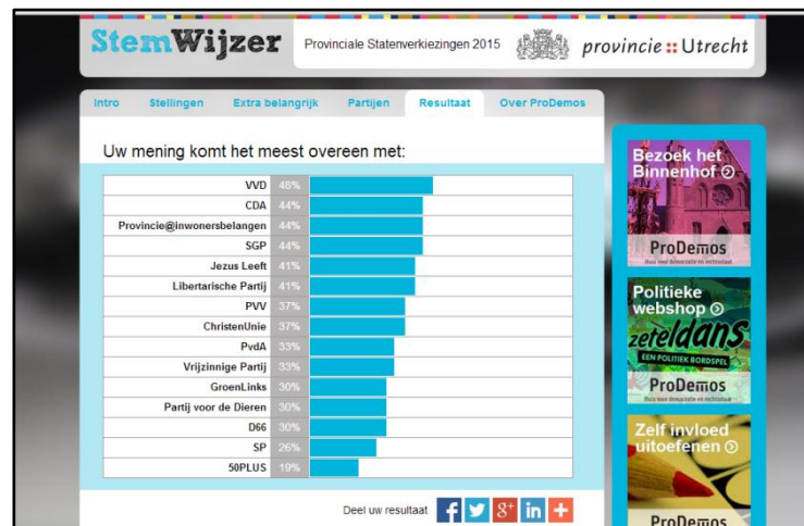
Afbeelding 5. Schermweergave ‘Resultaten’

Onder de grafiek staat ‘deel uw resultaat’ met daarachter buttons van sociale media zoals Facebook en Twitter. Niet alle gebruikers zullen naar verwachting door hebben dat ze nog naar beneden kunnen scrollen, aangezien het niet duidelijk te zien is dat er nog iets onder de grafiek staat.