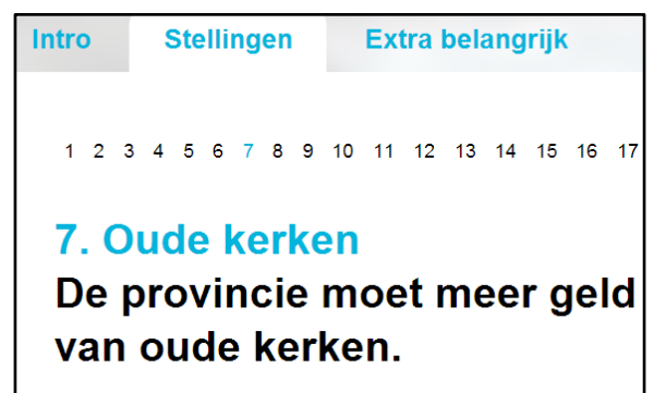
Afbeelding 3. Schermweergave 'Stellingen' overzicht

Om de stellingen goed te kunnen beantwoorden, moet de gebruiker zowel het semantische als het pragmatische aspect van het scherm begrijpen. Onder het semantische aspect