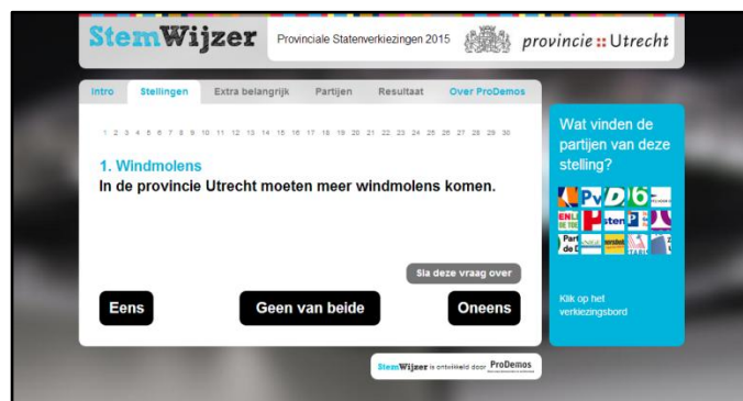
Afbeelding 2. Schermweergave 'Stellingen'

In dit scherm wordt echter wel de eerste mogelijkheid geboden tot aanvullende informatie over de partijstandpunten en politieke thema's. De gebruiker kan namelijk via de partijlogo's naar de websites van politieke partijen gaan. Deze sites bieden informatie over de partijprogramma's die ondersteunend kan zijn bij het begrip van de stellingen. De logo's van alle partijen die meedoen aan de Provinciale Statenverkiezingen staan rechts in het scherm, zie afbeelding 1. Daarboven staat een middelgroot kopje met in blauwe letters geschreven: 'Deze partijen doen mee'. De verwachting is dat de gebruikers de logo's van de partijen zullen opmerken. Onder de logo's staat in zeer kleine zwarte letters: 'Klik op een logo om naar de website van deze partij te gaan'. Het merendeel van de gebruikers zal dit waarschijnlijk niet lezen, omdat het lettertype heel klein is en de tekst helemaal onderaan in beeld staat. De meeste gebruikers zullen de logo's wel zien maar niet weten dat ze erop kunnen klikken, omdat ze de onderste tekst niet zullen lezen.