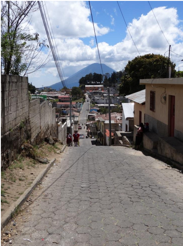
Figuur 3: De wijk San Antonio, Sololá