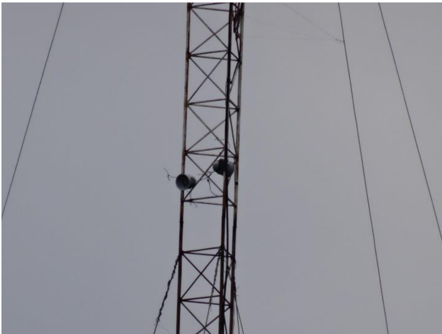
Figuur: Het buurtalarm van San Antonio, ingezoomd