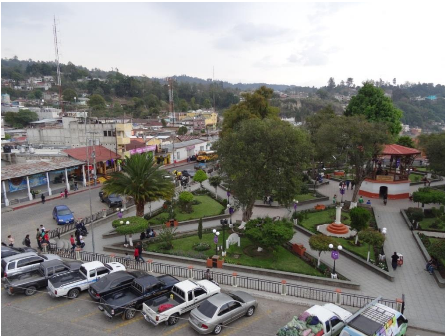
Figuur 4: Het centrale park van Sololá