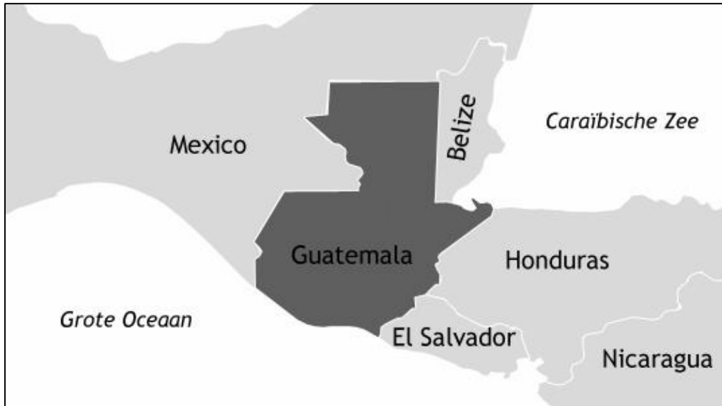
Kaart 1 : Centraal-Amerika 1 .