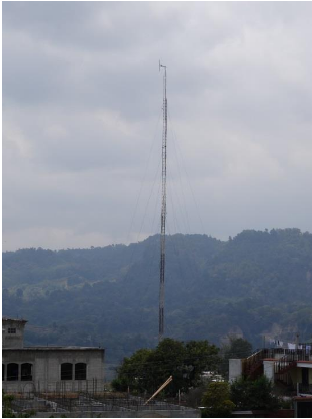
Figuur 1: Het buurtalarm van San Antonio