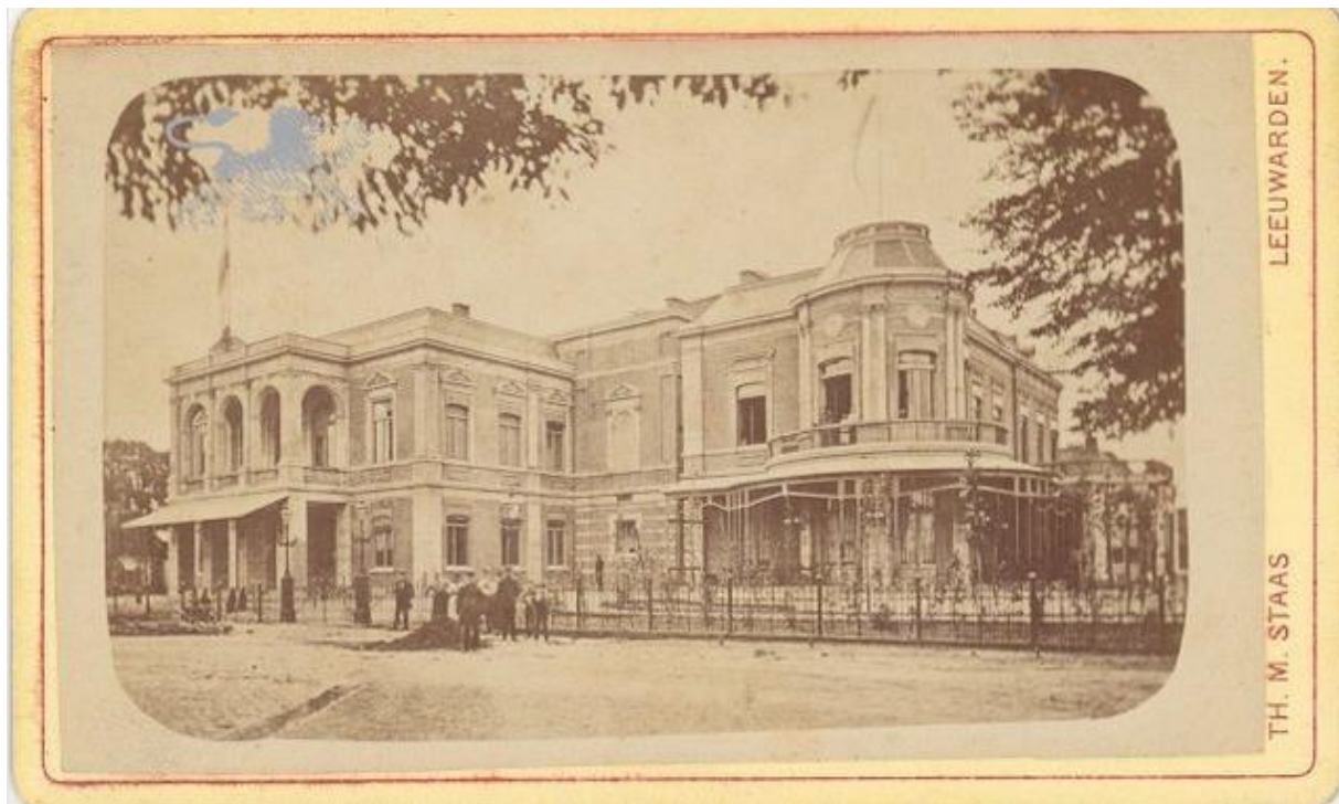
De Harmonie, 1881 – 1895 88

In 1900 waren zowel trends van de voorgaande periode als twee opvolgende periodes waarneembaar. Allereerst kwam er een nieuw fenomeen in de berichtgeving over film op, dat in de periode 1901 t/m 1906 gangbaar bleef: de recensie. Van 11 t/m 25 februari 1900 was er een reeks filmvertoningen in De Harmonie, georganiseerd door Hermann Fey. 85 Over deze gebeurtenis verscheen op 12 februari een formulematig artikel. 86 Op 14 februari 1900 verscheen er de eerste recensie van de LC over een filmvertoning. 87