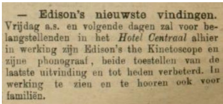
Aankondiging voor de eerste kintoscopevertoning 48

In 1896, het eerste jaar dat er filmvertoningen plaatsvonden in Leeuwarden, schreef de LC vooral over film als een nieuwe uitvinding, in een wetenschappelijke context. De eerste filmvertoning vond plaats op 13 maart 1896, toen er in Hotel Centraal een kintoscope opgesteld stond. Op de voorpagina van de LC van 11 maart 1896 stond een korte aankondiging.