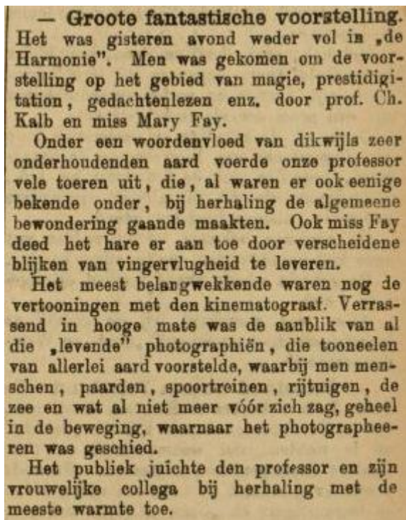
Film als onderdeel van een goochelshow 67

illusionist, stelde de journalist dat “de vertooningen met den kinematograaf” “het meest belangwekkend waren”. 66