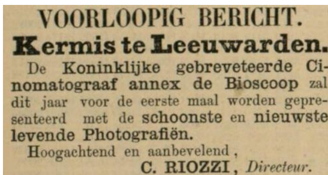
Riozzi's advertentie 72

Later dat jaar besteedde de LC wel aandacht aan vertoningen met de bioscoop. Op 10 november werd er in de LC aangekondigd dat er een bioscoop opgesteld stond in Hotel Centraal. Het artikel stelde: "Voor hen, die de inhuldigingsfeesten te Amsterdam niet konden bijwonen en die daarom zich moesten te vreden stellen met het lezen van de beschrijvingen daarvan in de dagbladen, is thans de gelegenheid geopend om zich eenigzins schadeloos te stellen." Dit is een interessant, omdat de LC hiermee aangaf dat bioscoopvertoningen dichterbij de echte ervaring kwamen dan de krant. Op het