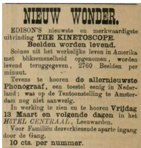
Advertentie voor de eerste kintoscope vertoning 51

Het artikeltje leek vooral uit wetenschappelijke belangstelling geplaatst. De kintoscope werd aangeprezen als “Edison’s nieuwste vinding”, samen met de phonograaf. De werking van de kintoscope en phonograaf werd niet uitgelegd en de toon van het stuk was objectief. 49 Dit staat in schril contrast met de advertentie die verderop was geplaatst, waarin de kintoscope in lyrische bewoordingen werd aangeprezen. 50