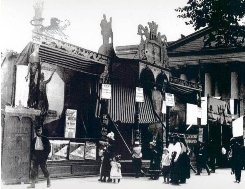
Riozzi's kermistent op de julkermis in Leeuwarden 71