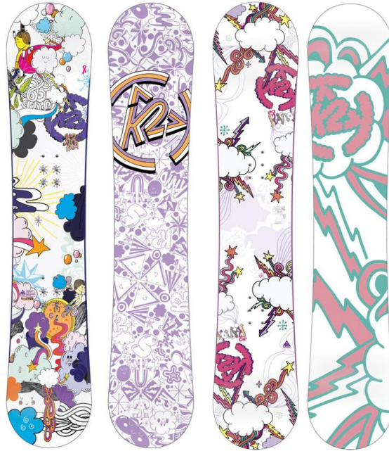
Ontwerp voor K2 Snowboarding door Merijn Hos (Bfree)