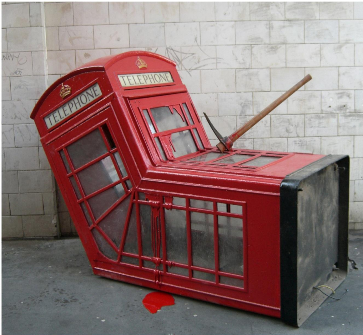
Banksy - Murdered Phone Booth 2006

art kunstenaar blijven noemen, zolang hij of zij nog actief op straat is, of dat lange tijd is geweest. De tijd moet nog bewijzen welke plek street art uiteindelijk in gaat nemen binnen de kunstgeschiedenis. Wel is duidelijk dat er een groeiende interesse voor de kunstvorm is binnen de maatschappij en de gevestigde kunstwereld. De galeries hebben het al gedeeltelijk omarmd en de musea lijken langzaam te volgen. Street art is niet langer een kunstvorm die onbegrepen en algemeen afgekeurd is, maar een jonge, populaire en krachtige manier van kunst maken die explosief gegroeid is binnen korte tijd en voorlopig nog niet aan groei lijkt af te nemen.