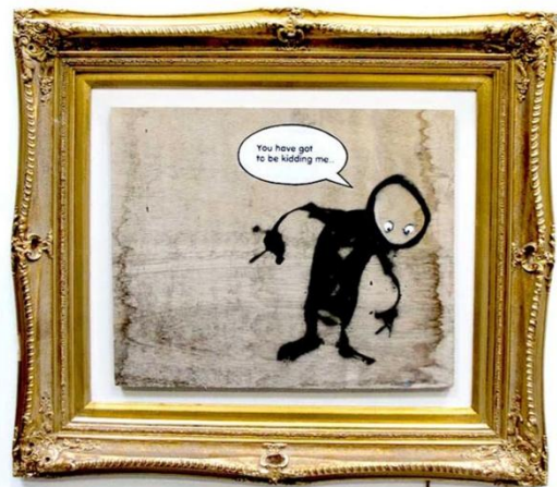
You have got to be kidding me