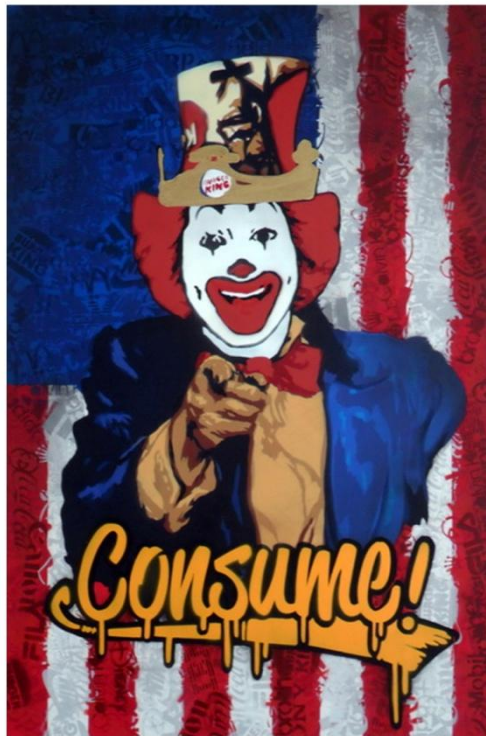
Bustart, Consume!, 70x100cm 28

Ook Bustart kan zich in de mening van Van der Voorn vinden en zegt dat er altijd een boodschap in zijn werk zit. Zaïra bevestigt dit ook over haar eigen werk, maar zegt wel: “I also think it is nice that people can make their own story of a work. People might see something completely different than I intended in a work, which is just as good.” Hiermee plaatst ze zichzelf in de postmodernistische opvatting van Roland Barthes’ dood van de auteur 27 . Ook IVES neigt hiernaar: “In mijn werk zit altijd een boodschap; het vertelt altijd een verhaal, maar dat verhaal hoeft niet altijd duidelijk te zijn. Er zit altijd iets in, ik verzin dingen altijd met een reden.” Volgens de geïnterviewden is het grootste deel van hun werk dus geëngageerd, maar de mening of het verhaal dat zij in hun werk stoppen hoeft niet altijd door de toeschouwer op een vaste wijze gezien te worden.