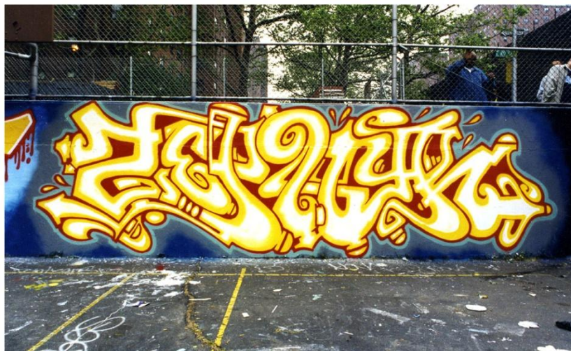
Voorbeeld van graffiti