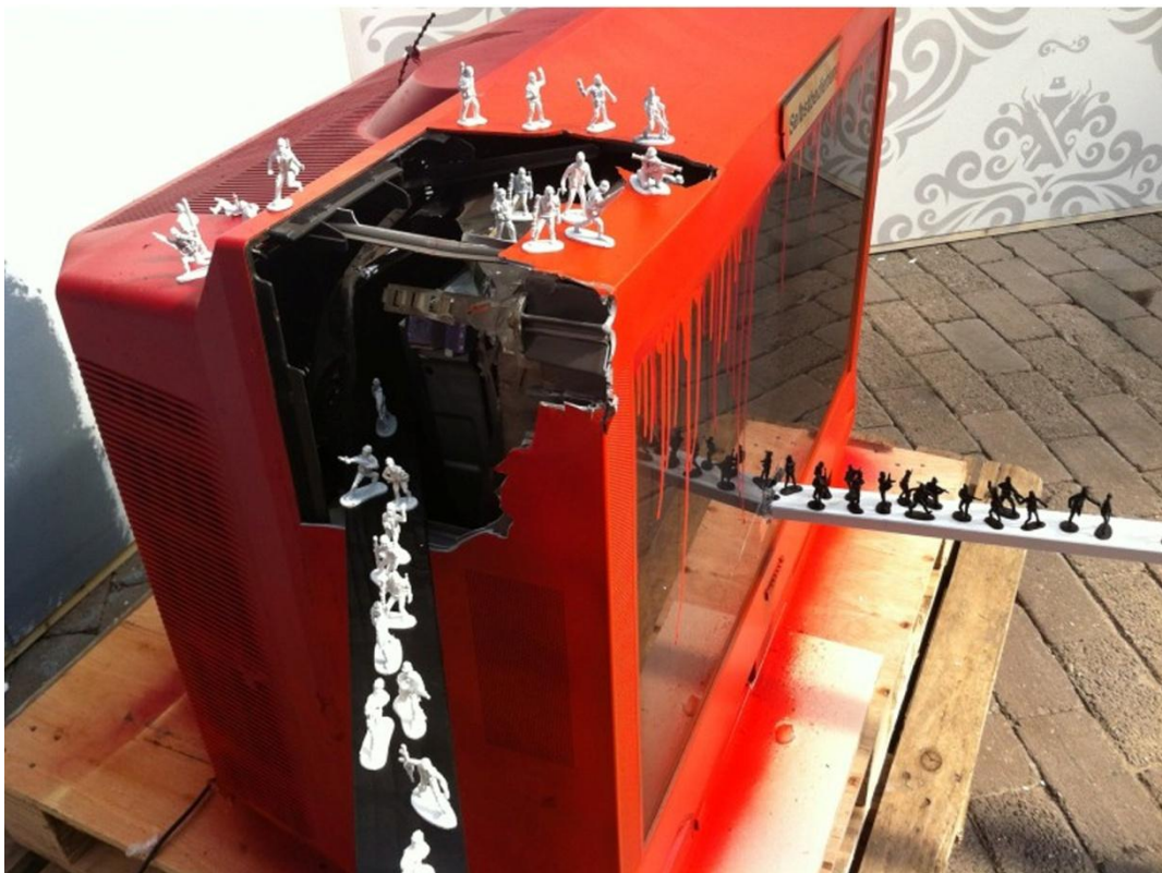
IVES.One - "COMMERCIAL SOLDIERS DESTROY YOUR SOUL" voor expositie URBAN ART HOUSE in Amsterdam

Ik kom nu voor het eerst in een periode waarin ik zowel financieel als geestelijk zo onafhankelijk ben dat ik met mijn eigen geld shit kan experimenteren. Ik kan voor het eerst van mijn leven naar een kunstwinkel gaan en vragen gaan stellen en dan ook meteen die shit kopen. Vroeger wist ik bijvoorbeeld wel dat er houtskool was, maar kocht ik met de paar tientjes die ik had liever een canvas om een mooi stencil te maken. Maar nu kan ik besluiten om epoxyhars en olieverf te kopen en dat doe ik dan ook.