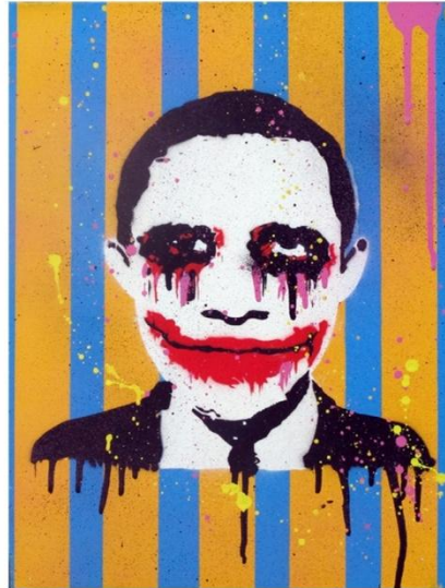
IVES.One - Jokerbama, A4 10

breder publiek te introduceren. 9 Hierdoor komt hij ook in contact met GO Gallery, met een lange en vruchtbare relatie tot gevolg. Naast zijn werk als autonome kunstenaar werkt IVES ook als Urban Art / Guerilla Marketing consultant voor bedrijven en overheden en heeft hij verschillende reclameopdrachten gedaan voor een aantal Nederlandse bedrijven. IVES.One is één van de weinig Nederlandse street art kunstenaars die rond kan komen van zijn kunstenaarschap alleen.