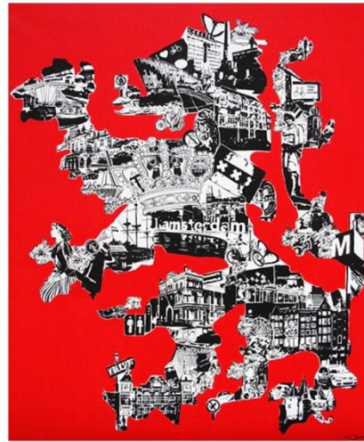
Zaïra - Lion of Amsterdam, 105x130cm, 2012