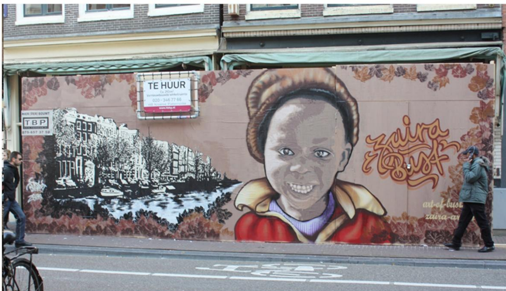
Samenwerking Bustart & Zaira in Amsterdam

Van der Voorn vindt echter dat het ook een kwestie van stijl is. Ook iemand die niet actief is op straat kan immers kunst maken die direct herkenbaar is als street art. "Dat is een afleiding van street art. Dan is het meer urban art. Het blijven vage labels."