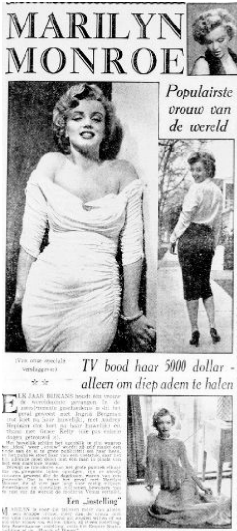
Afbeelding 5: De verschillende kanten van Monroe in foto's. De Telegraaf, 21 april 1956, 9.

In deze krant werd dieper op Monroe's acteerprestaties en persoonlijkheid ingegaan, waardoor een gelaagd beeld van haar als mens ontstond. In het artikel "Marilyn" werd geconcludeerd dat Monroe meer kon dan het spelen van domme blondjes. Het idee ontstond dat Monroe wel degelijk kon acteren wanneer zij daar de gelegenheid toe zou krijgen en geen domme vrouw was. Daarentegen werd ze ook