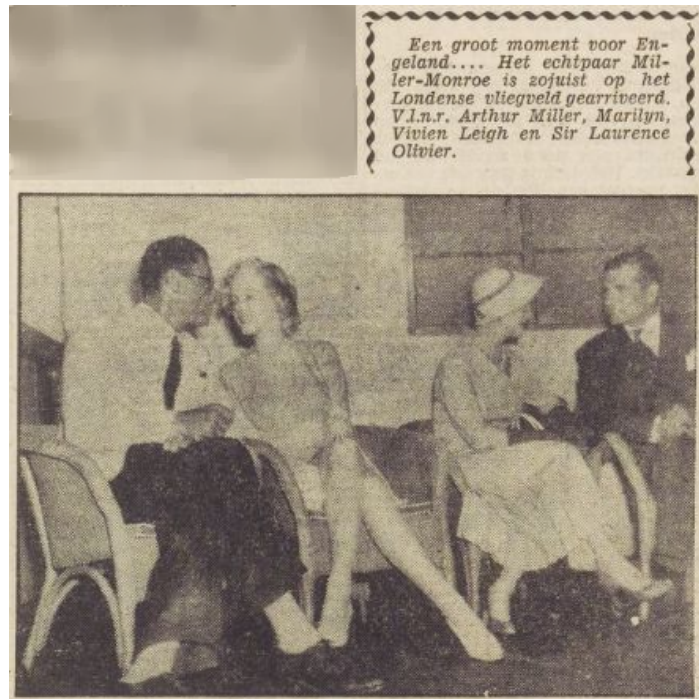
Afbeelding 6: Monroe's charisma afgebeeld als naïeve kwetsbare uitstraling. Het Vrije Volk , 17 juli 1956, 1.

tegenover de journalisten. Haar kwetsbare houding is goed terug te zien in de foto bij het artikel. Door haar schuine houding, hangend naar Arthur toe, zocht ze bescherming voor alle media-aandacht. Ook haar uitdrukking, een glimlach en een lieve blik richting Arthur konden worden gezien als een naïeve kwetsbare houding (afbeelding 6). Ondanks de vaak gemaakte koppeling naar seksualiteit, liet Monroe hier een kwetsbare uitstraling zien, waardoor ze geliefd was bij het publiek.