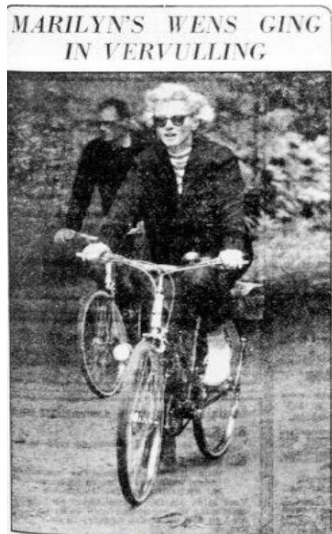
Afbeelding 8: Marilyn op de fiets door het Engelse landschap. Monroe is ook gelukkig met de kleine dingen in het leven. De Telegraaf , 16 augustus 1956, 7.

Aan de andere kant bleek Monroe ook heel gewoon te zijn. In Het Vrije Volk van woensdag 5 september werd gespeculeerd dat Monroe moeder zou worden, omdat ze een aantal dagen afwezig was tijdens het filmen. 58 Mensen konden zich identificeren met de wens van een vrouw om een gezin te stichten en hoe ze moest omgaan met de aspecten van het leven, zoals trouwen, ziekte en liefde. In de column "Van overal" werd goed duidelijk gemaakt dat Monroe net als iedereen was. Ze kreeg van de rechter een berisping, omdat ze te laat een boete kwam betalen. Daarbij liet de rechter weten dat de wetten voor iedereen waren. 59 Hieruit bleek dat de krant Monroe ondanks haar status van filmster representeerde als een vrouw die net als iedereen dezelfde behandeling zou krijgen, waardoor mensen zich met haar konden identificeren. Ook in De Telegraaf werd Monroe gerepresenteerd als een vrouw die net als ieder ander was. In de krant van 16 augustus werd gesproken over een wens die voor Monroe in vervulling ging, namelijk een fietstocht langs de rustige Engelse landweggetjes (afbeelding 8). 60 Fietsen kon gezien worden als iets alledaags wat iedereen kon doen en wat dus als gewoon