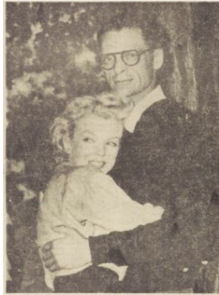
Afbeelding 3: Marilyn gelukkig in de armen van haar man Arthur. Het Vrije Volk , 3 juli 1956, 1.

De artikelen over haar privéleven bevatten onderwerpen, zoals Monroe en haar relatie met Arthur Miller (beroemde Amerikaanse toneelschrijver) en aspecten uit het leven, zoals ziekte, moederschap en geloof. 36 Veelal korte artikelen die ingingen op de verschillende aspecten uit het leven van Monroe, zodat de lezers een beeld kregen van Monroe's leven. Dit is terug te zien in een foto gepubliceerd na het huwelijk tussen Monroe en Miller op 29 juni. Monroe werd hierin beschreven als filmster en Hollywoods pin-up girl nummer 1, maar de foto liet ook een gelukkige vrouw zien die bescherming zocht bij haar man. 37 Die bescherming was te zien in de houding van Monroe, waarbij ze zich vastklampte aan Arthur en haar hoofd tegen zijn borst duwde (afbeelding 3). Monroe werd neergezet als een Amerikaanse filmster met een mooi lichaam waar ze gebruik van maakte tijdens haar werk. Dit blijkt uit de manier waarop over Monroe's carrière werd geschreven en hoe ze de media wist te bespelen. De krant representeerde Monroe ook als mens achter de actrice, waarbij ze streefde naar geluk en liefde en moest omgaan met de aspecten uit het leven. Dit was op te maken uit de wensen van Monroe om een gezin te stichten en gelukkig te zijn, maar ook uit de berichten over haar ziekte en mogelijke zwangerschap.