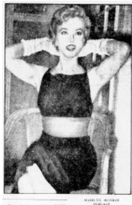
Afbeelding 4: Marilyn poseert gewaagd in een sexy jurk op een persconferentie. De Telegraaf , 17 juli 1956, 5.

De Telegraaf sinds 1893 een nationale krant, behoorde tot de neutrale zuil. Het was een krant met een groot bereik, omdat de krant niet vastzat aan bepaalde ideologische en religieuze waarden en normen. Na onderzoek is gebleken dat naast nieuws uit binnen- en buitenland over de economie, politiek en maatschappij, ook veel aandacht was voor entertainment en cultuur, waaronder sport, toneel, nieuws en advertenties rondom films en filmsterren en dagelijkse radio en televisie bulletins. 43 In 1956 werd veel over Monroe geschreven, waarbij artikelen veelal ondersteund werden door foto's (bijlage 3). Over het algemeen foto's met de beroemde poses van Monroe (hoofd iets naar achteren, mond half open en verleidelijke ogen). De representatie van Monroe werd door zowel tekst als beeld gevormd. In de artikelen werd directer over bepaalde onderwerpen rondom Monroe gesproken en was het taalgebruik gewaagder. Binnen het nieuws over Monroe's filmcarrière waren dezelfde onderwerpen terug te vinden als in Het Vrije Volk , zoals Monroe en Sir Laurence, Monroe als actrice en de omgang met de pers. Daarnaast was er ook aandacht voor haar privéleven, zoals haar huwelijk met Arthur Miller, haar zwangerschap en ziekte. 44