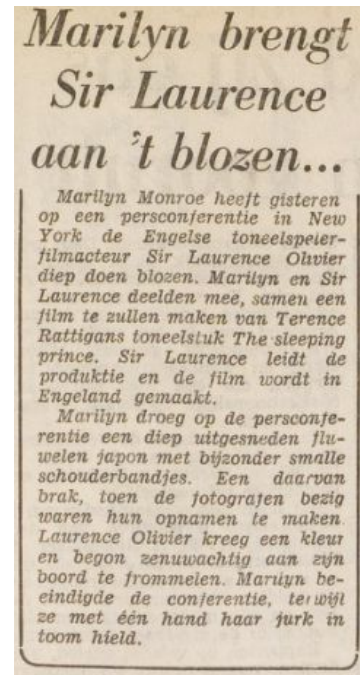
Afbeelding 1: Artikel over de diep uitgesneden jurk van Monroe. Het Vrije Volk , 10 februari 1956, 5.

Binnen de artikelen over haar filmcarrière waren onderwerpen als het samenwerkingsverband met Sir Laurence Olivier voor de film THE SLEEPING PRINCE en de omgang van Monroe met publiek en pers terug te vinden. 33 De artikelen over haar filmcarrière gingen niet over haar acteerprestaties, maar over hoe ze zich kleepte en gedroeg tijdens publieke optredens en hoe ze omging met de pers. Daarin werd vooral ingegaan op de strakke jurken die ze droeg en de seksuele poses (hoofd iets naar achteren, mond half open en verleidelijke oogopslag) voor de camera. Er werd daarbij niet expliciet gesproken over de seksualiteit die Monroe uitstraalde, maar werd er omheen geschreven door te schrijven over de gewaagde kledingkeuzes en poses. Dit is goed te zien in het artikel “Marilyn brengt Sir Laurence aan het blozen...” Het artikel ging niet zozeer over de