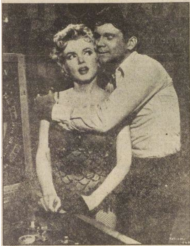
Afbeelding 9: Marilyn als Cherie in de film BUS STOP, het verleidelijke, domme blondje. Het Vrije Volk , 31 augustus 1956 1.