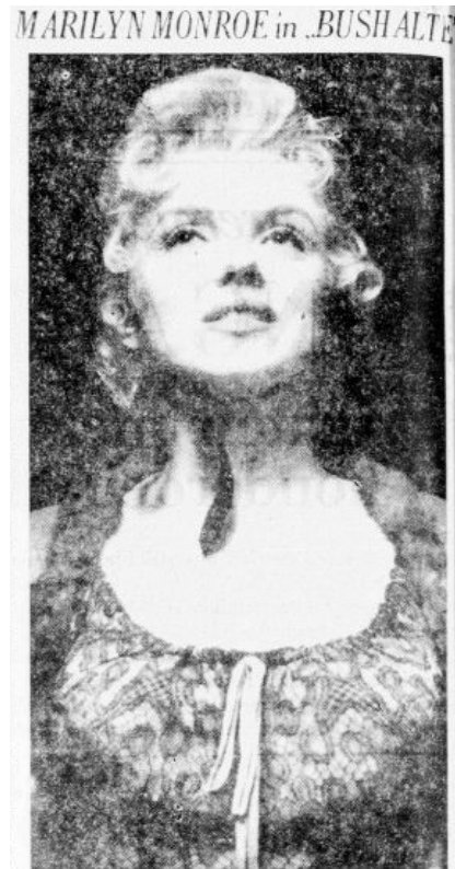
Afbeelding 10: Velen zien Marilyn in het echt ook als haar personages in de films, terwijl ze veel meer kan. De Telegraaf , 25 oktober 1956, 2.

In Het Vrije Volk van 31 augustus werd een artikel gepubliceerd over de nieuwste film van Monroe BUS STOP. 65 Hierin werd vooral gekeken naar haar manier van bewegen, wat ook in Monroe's andere personages terugkeerde. Het werd beschreven als een tikje vulgair, maar ook verleidelijk en voor een bepaald soort mannen levensgevaarlijk (afbeelding 9). 66 Ook in andere artikelen kwam het personage en de performances van 'dom blondje' naar voren, ook al ging het niet in alle gevallen om het personage maar om Monroe zelf. De krant representeerde Monroe als de personages die ze speelden, waarbij foto's werden toegevoegd waaruit niet altijd kon worden opgemaakt of Monroe als personage of als zichzelf op de foto stond. In Limburgsch Dagblad werd Monroe in het artikel alleen gerepresenteerd als het personage wat ze altijd speelde. Uit het artikel werd duidelijk dat de krant haar ook in het echte leven zag als dom blondje die niet de goede levensstijl had voor katholieken. 67 De krant richtte zich voornamelijk op haar personage en performances en niet op Monroe als mens.