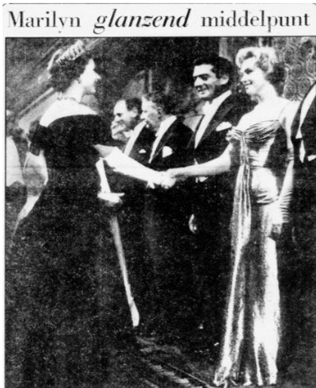
Afbeelding 7: Marilyn ontmoet koningin Elizabeth. Een ontmoeting die maar weinig mensen mogen meemaken. De Telegraaf , 31 oktober 1956, 7.