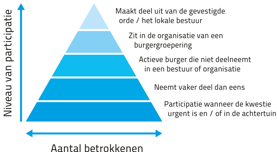
(Figuur 2.2, May, 2006)

In tegenstelling tot de indeling van Arnstein en Edelenbos & Monnikhof stelt May in de “triangle of engagement” de burger centraal (fig. 2.2).