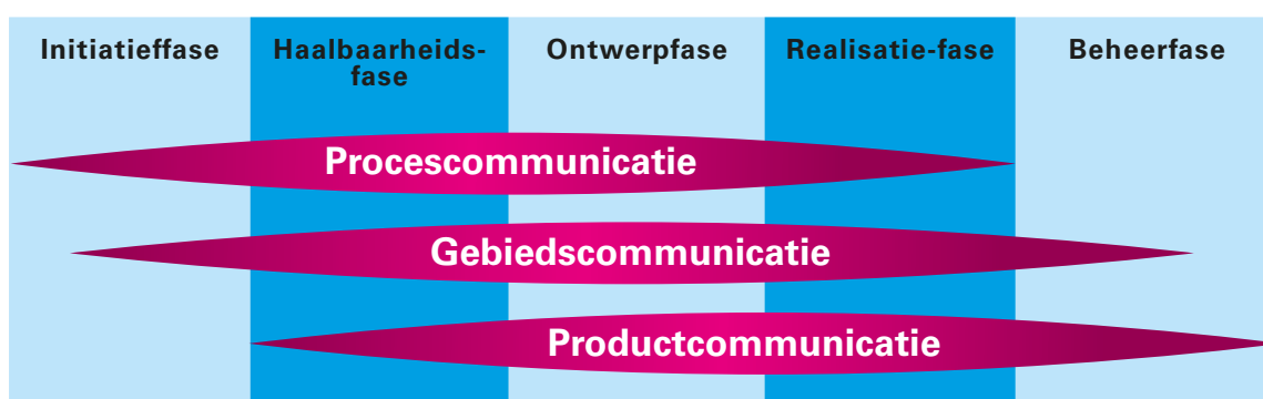
Fasering communicatie KVL-terrein Oisterwijk

Niet elk communicatiemiddel wordt gelijktijdig ingezet. Het communicatieproces verloopt volgens de fasen afgebeeld in de tabel hieronder (zie Fig. 5.2) Tijdens de initiatiefase ligt de nadruk op de procescommunicatie. In de haalbaarheidsfase en de ontwerpfase wordt deze aandacht voor de procescommunicatie vergroot. Vervolgens wordt er gestart met de gebiedscommunicatie als een boodschap ontwikkeld is. Na de ontwerpfase start de productcommunicatie, wanneer de plannen concreter zijn uitgewerkt (Provincie Noord-Brabant, 2012, p. 15-17).