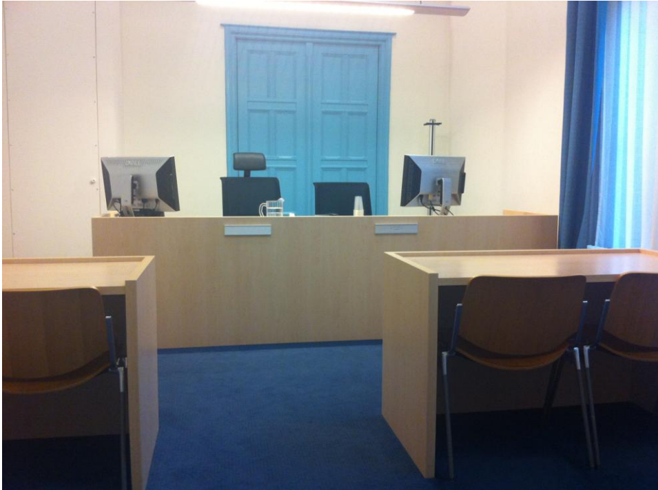
Figuur 1. Het bureau waaraan de parketsecretaris links zit en de griffier rechts. Jeugdige verdachte en ouders zitten meestal aan de rechter tafel.