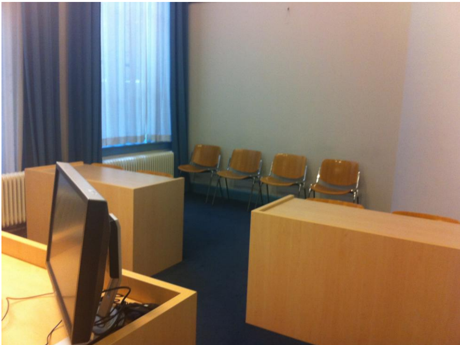
Figuur 2. Vooraanzicht kamer. Observatoren zitten op de twee meest rechtse stoelen.