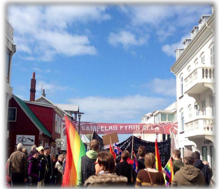
Figuur 2: Solidariteitsmars op 1 mei 2014

Een nieuwe trend die momenteel zichtbaar is binnen de IJslandse samenleving zijn individuele initiatieven als het inzamelen van handtekeningen voor petities waarin vraag is naar bijvoorbeeld een nationaal referendum. Solidariteit speelt een grote rol bij betrokken burgerschap, protesten worden dan ook solidaritetsvergaderingen genoemd door betrokken burgers. Tijdens een solidariteitsmars, zoals afgebeeld op figuur 2 18 , wordt bijvoorbeeld ook een spandoek gedragen met de tekst: één gemeenschap voor allen. Het delen van ervaringen en persoonlijk leed is een vorm van betrokken burgerschap wat evengoed een proces van bewustwording in gang zet. Zo geeft Gummi 19 aan dat hij in zijn vrije tijd optredens verzorgt. In zijn one man theatre fungeert hij als een spiegel voor anderen, als confrontatie met 'de werkelijkheid'.