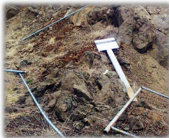
Figuur 7 en 8: bordjes die op de grond liggen met de indeling van de geplande woonwijk.