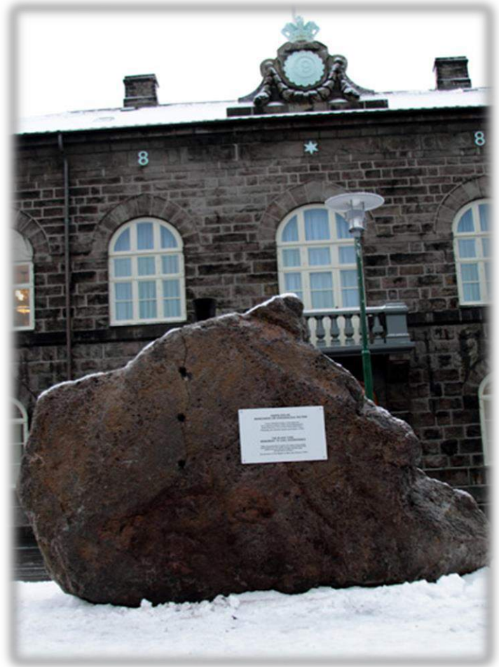
Figuur 3: 'The Black Cone, Monument to Civil Disobedience'

De tekst is als volgt: "When the government violates the rights of the people, insurrection is for the people and for each portion of the people the most sacred of rights and the most indispensable of duties."