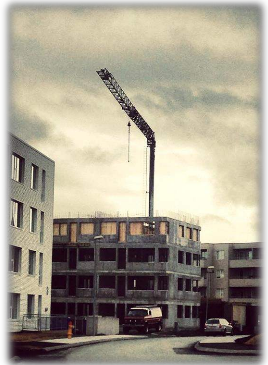
Figuur 9: funderingen van bouwprojecten

We rijden een stukje verder, we gaan de hoek om en komen in een nieuwe wijk. Deze wijk is echter zo mogelijk nog triester. Het uitzicht van de huizen die wél af zijn is enkel een spookwijk, zie figuur 9 54 . Funderingen van huizen waar momenteel geen leven mogelijk is. De mensen hier hoeven enkel uit hun raam te kijken om zich te herinneren welke desastreuze gevolgen de crisis in IJsland had.