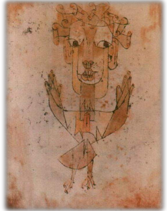
Figuur 1: Angelus Novus, een aquarel naar Paul Klee

Om de huidige situatie in IJsland te beschrijven gebruik ik de metafoor van Angelus Novus 4 omdat het symbool kan staan voor het transformatieproces waarin IJsland zich bevindt. Het toont een engel die op het punt staat zich te verwijderen van iets waar zijn blik strak op gericht is. Zijn ogen en zijn mond opengesperd en zijn vleugels gespreid. Zijn gelaat is naar het verleden gewend. Waar men een reeks gebeurtenissen ziet, ziet hij enkel één catastrofe die zich opstapelt en keer op keer voor zijn voeten wordt geworpen. Het liefst zou hij blijven en de brokstukken tot een geheel maken, maar zijn vleugels vangen wind. Wind die uit het paradijs waait, zo hard dat hij het niet kan weerstaan. De storm stuwt het voort, de toekomst in, die hij de rug heeft toegekeerd. De toekomst als onvoorspelbare donkere vlek. Deze storm is wat wij vooruitgang noemen.