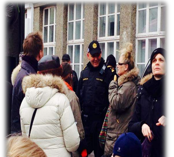
Figuur 5: wijze van belediging