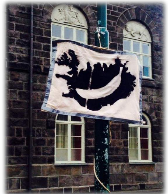
Figuur 4: banana republic vlag tijdens solidariteitsvergaderingen

Ik sta in de regen met mijn capuchon op, mijn sjaal strak om mijn nek terwijl de ijskoude wind in mijn gezicht snijdt. Het is koud voor IJslandse begrippen, maar dat weerhoudt de IJslanders niet die hier op het plein zijn samengekomen. Ik ben omringd door honderden mensen. Allen luisterend naar de boodschap die door de boxen weergalmt en afkomstig is uit een busje wat voor op het plein gestationeerd is. Overal waar ik kijk zie ik bananen. Mensen zwaaien met bananen. Mensen gooien met bananen.