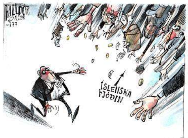
Figuur 10: spotprent uit Morgunbladid: 25-10-2008

Binnen deze groep, maar ook binnen de gehele samenleving, heerst een sterke mate van sarcasme en humor als coping strategie. Zij maken grappen over de gebeurtenissen wat deel uitmaakt van het helingsproces. De televisie en kranten staan boordevol met spotprenten en sketches over invloedrijke mensen die betrokken zijn geweest bij de crisis. Op figuur 10 71 is de IJslandse natie op zijn kop weergegeven wat het beeld oplevert van geld dat uit de portemonnees van burgers valt.