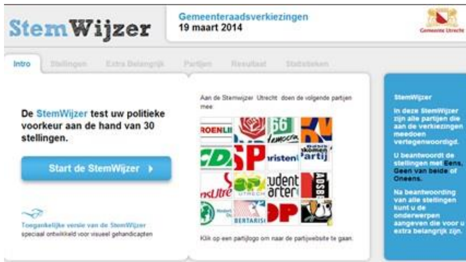
Afbeelding 2. Introductiescherm

Bij het openen van de website www.stemwijzer.nl komt de gebruiker op de hoofdpagina terecht. In het blauwe blok selecteert de gebruiker de gemeente waarin hij woont. In dit geval de gemeente Utrecht. Als de gebruiker daarop klikt, komt hij in het introductiescherm van de StemWijzer van de gemeente Utrecht (afbeelding 2). Hier heeft de bezoeker de keuze om meteen door te gaan naar de stellingen, maar hij kan er ook voor kiezen om direct naar een website van een politieke partij te gaan. StemWijzer houdt de rechterkolom aan voor toelichtingen. Rechts van het midden staat namelijk een vak met de logo's van alle partijen die meedoen aan de gemeenteraadsverkiezingen. In de horizontale balk is te zien dat dit de introductie is. De andere onderdelen van de website zijn grijs, maar de bezoeker ziet zo uit welke onderdelen de VAA bestaat.