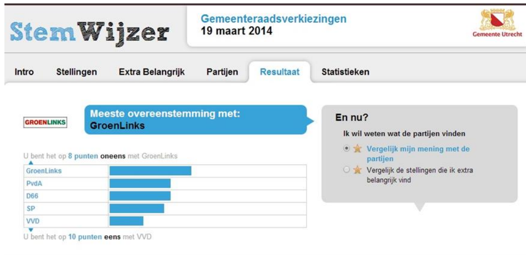
Afbeelding 5. Eerste deel resultatenschermb

StemWijzer zegt dat de gebruiker het op een aantal punten oneens is met de partij die het beste bij hem past. Bovenaan de grafiek staat: 'U bent het op X aantal punten oneens met partij Y'. Onderaan de grafiek staat: 'U bent het op X aantal punten eens met partij Y'. Deze negatieve bewoording kan invloed hebben op het begrip van de resultatengrafiek. Het is mogelijk dat de gebruiker moeite heeft om dit te begrijpen.