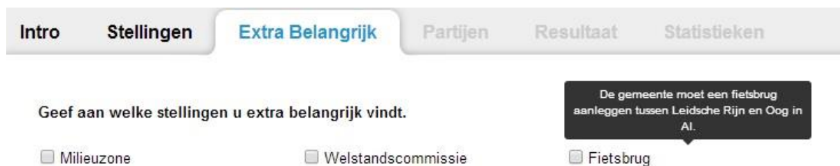
Afbeelding 4. Stelling staat boven het kernwoord

Na het beantwoorden van de stellingen, kan de participant aangeven welke thema's belangrijk zijn. De antwoorden op deze vragen, tellen zwaarder mee in de resultaatberekening. Maar de gebruiker is niet verplicht om onderwerpen aan te klikken. Net als in het soort lint bij de stellingen, komt de stelling nu ook weer in een apart blokje te staan als de gebruiker met zijn muis over de begrippen gaat (zie afbeelding 4).