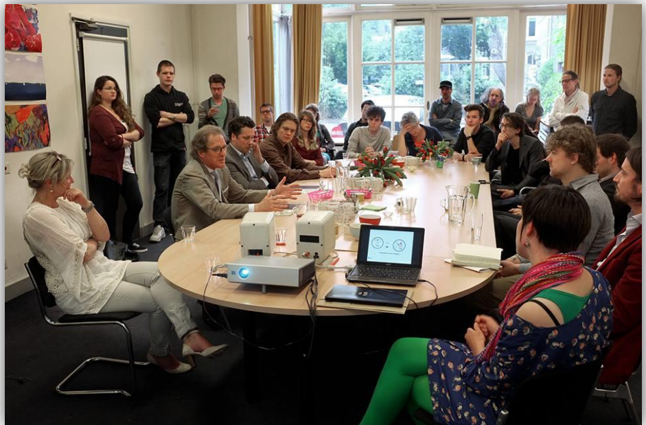
Figuur 1, Aanbieden jongeren manifest 27 juni 2013.

Dit is de situatie zoals hij op dit moment, najaar 2013, is. Op dit punt haak ik in met mijn onderzoek. In het beschreven verhaal zijn twee hoofdlijnen te ontdekken, namelijk enerzijds de vorming van een nieuw beleid en nieuwe visie op cultuur en anderzijds de vraag hoe de gemeente jongeren hierin kan betrekken. De vraag die hieruit voortkomt is: op welke wijze kan de gemeente Den Bosch jongeren betrekken bij het vormen van een nieuwe visie op cultuur?