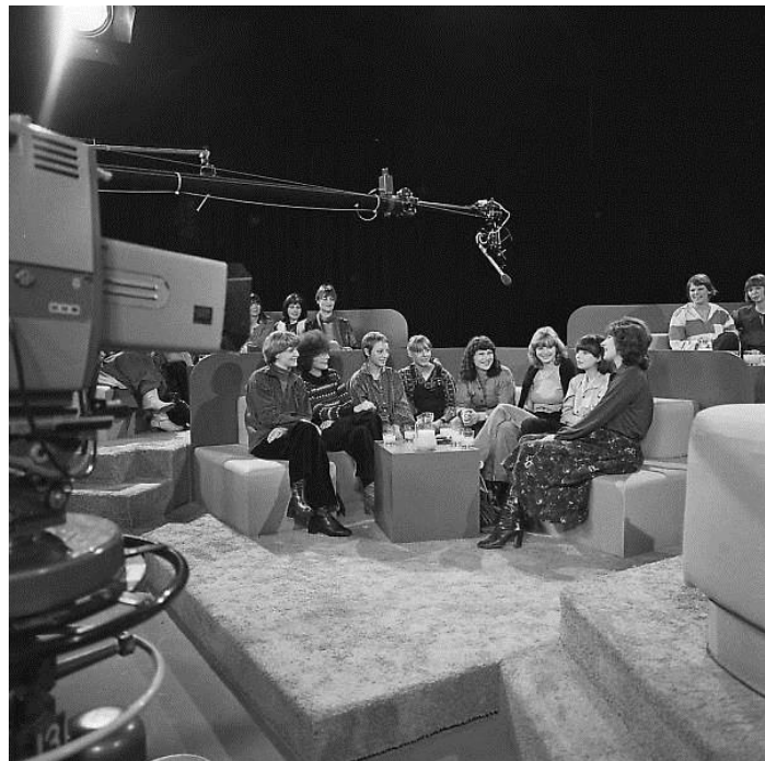
Figuur 1: Decor van Ot... en hoe zit het nou met Sien? NOS, 1978

andere mensen te horen hoe zij seksuele voorlichting gaven aan hun kinderen of hoe hun eerste keer was. De televisie gaf de antwoorden op de vragen die mensen wellicht niet aan hun ouders of vrienden durfden te stellen. Zo zit in een aflevering van Ot... en hoe zit het nou met Sien? uit 1978 een studio vol moeders en dochters die praten over hoe bij hen de seksuele voorlichting verliep. De moeders vertellen over wat zij te horen kregen van hun ouders, en hoe ze vervolgens hun eigen kinderen