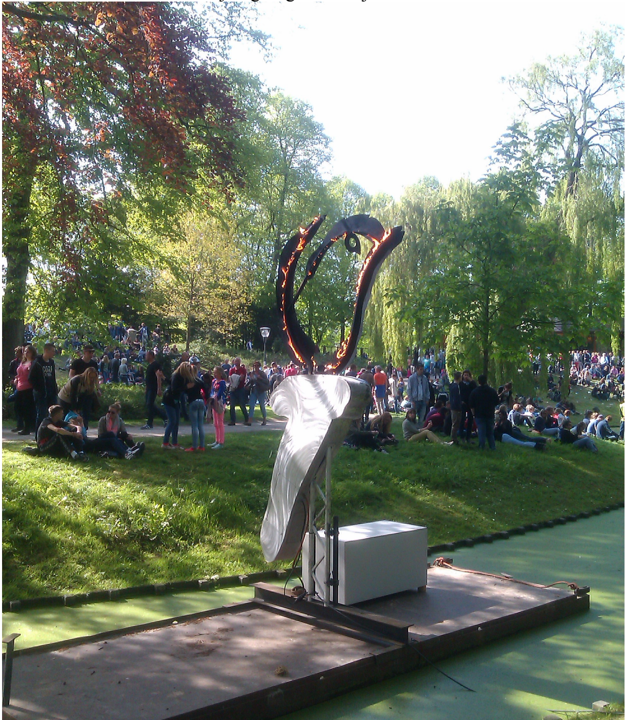
Het Bevrijdingsvuur in het fakkellogo op Bevrijdingsfestival Leeuwarden 2014 1