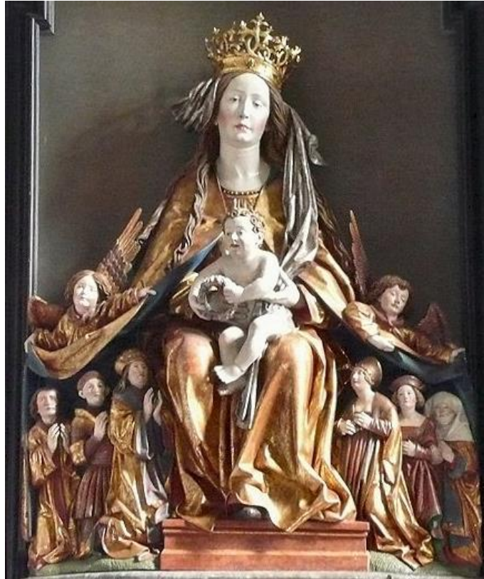
Afb. 7. Gregor Erhart, Madonna Misericordia , 1501-14, steensculptuur, Wallfahrtskirche, Frauenstein, Oostenrijk.

http://upload.wikimedia.org/wikipedia/commons/4/49/Schutzmantelmadonna - Frauenstein.jpg (12-06-2014)