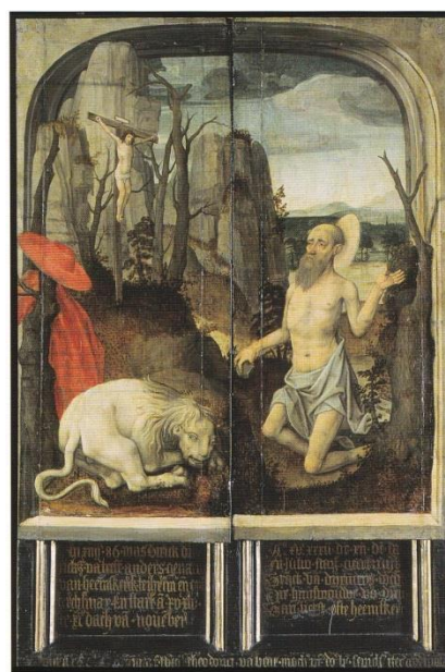
Afb. 6. Meester van Delft, Sint Hiëronymus in de woestijn , 1514 (luiken), ca. 1606 (tekstbord), paneel, 75 x 33 cm, Suermondt-Ludwig Museum, Aken. Uit: Truus van Bueren en W.C.M. Wüstefeld, Leven na de dood. Gedenken in de late Middeleeuwen , Turnhout 1999, p. 228.