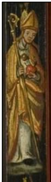
Afb. 16a. Detail van afb. 16.

http://memodatabase.hum.uu.nl/memo-is/advancedSearch/search?max=10&membersOfCommemoratedParty=%5B%22religiousOrder.id%22%3A%22585%22%2C+%22religiousOrder%22%3A%5B%22id%22%3A%22585%22%5D%5D&membersOfCommemoratedParty.on (12-06-2014)