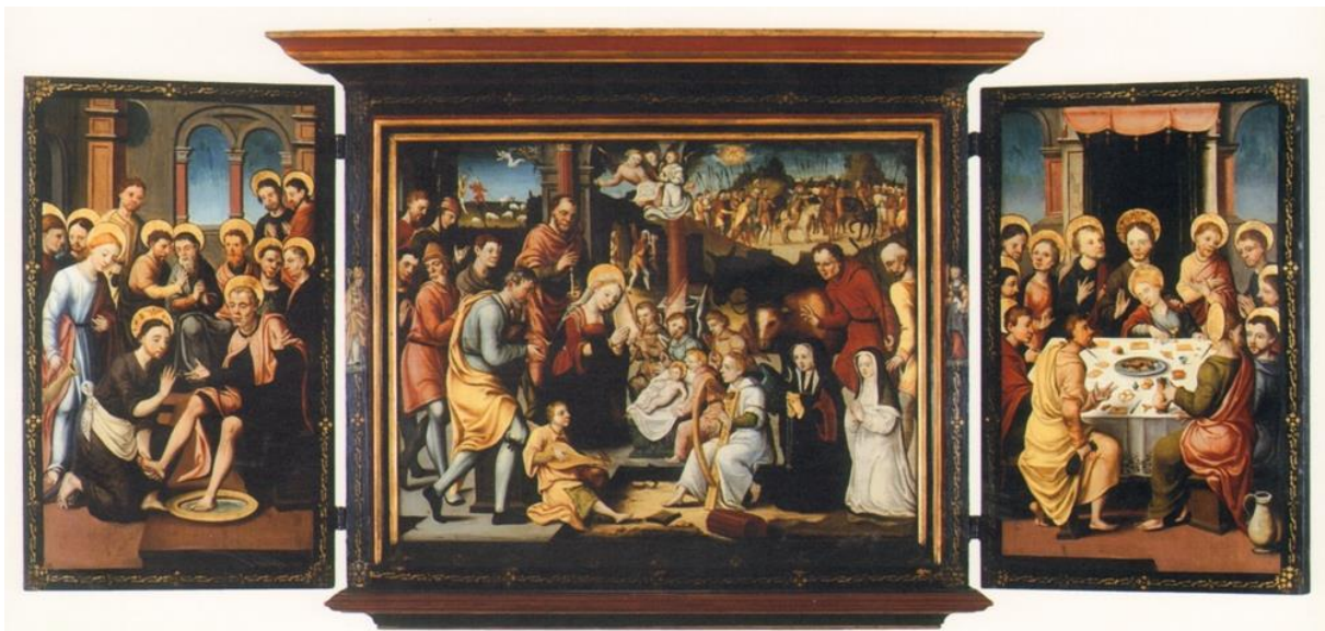
Afb. 15. Jacob of Albert Maier (omgeving), Aanbidding door de herders , ca. 1546, olieverf op paneel, 62 x 69 cm (middenpaneel met lijst), 44 x 57,5 cm (middenpaneel zonder lijst), 55 x 32 cm (luiken), privé-collectie, Nederland.

http://memodatabase.hum.uu.nl/memo-is/advancedSearch/search?max=10&membersOfCommemoratedParty=%5B%22religiousOrder.id%22%3A%22585%22%2C+%22religiousOrder%22%3A%5B%22id%22%3A%22585%22%5D%5D&membersOfCommemoratedParty.on (12-06-2014)