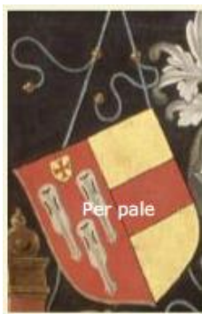
Afb. 3b. Wapenschild van Ludgard van Nijenrode.