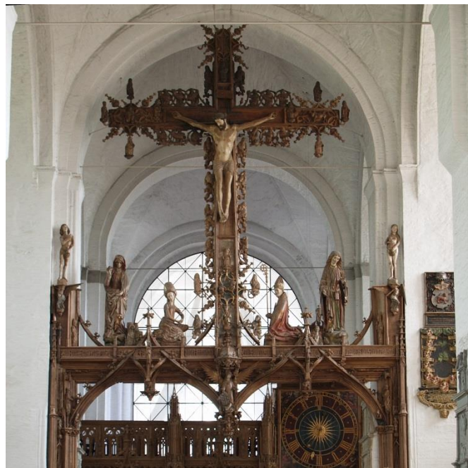
Afb. 8. Bernd Notke, Kruisigingsgroep , 1477, houtsculptuur, kathedraal Lübeck, Duitsland.

http://upload.wikimedia.org/wikipedia/commons/4/49/Schutzmantelmadonna - Frauenstein.jpg (12-06-2014)