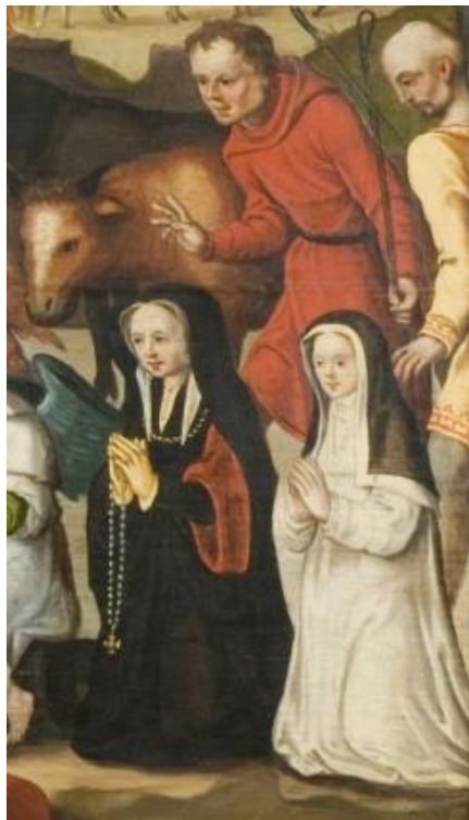
Afb. 18. Detail van middenpaneel op afb. 16