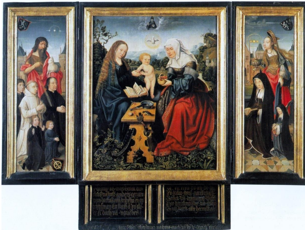
Afb. 5. Meester van Frankfurt (middenpaneel), Meester van Delft (zijluiken), Anna-te-drieën met gebedsportretten van de familie Van Beesd van Heemskerck-Van Diemen , ca.1509 (middenpaneel), 1514 (luiken), ca. 1606 (tekstbord), paneel, 94 x 62 cm (middenpaneel, inclusief tekstbord), 75 x 33 cm (luiken), Suermondt-Ludwig Museum, Aken. Uit: Truus van Bueren en W.C.M. Wüstefeld, Leven na de dood. Gedenken in de late Middeleeuwen , Turnhout 1999, p. 229.