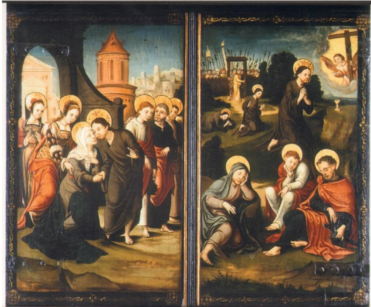
Afb. 17. Buitenluiken van Aanbidding door de herders