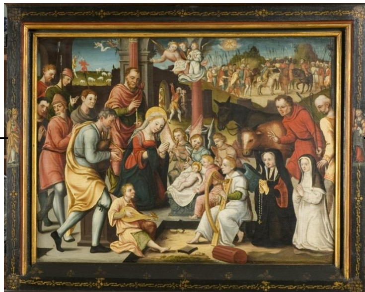
Afb. 16. Middenpaneel van Aanbidding door de herders