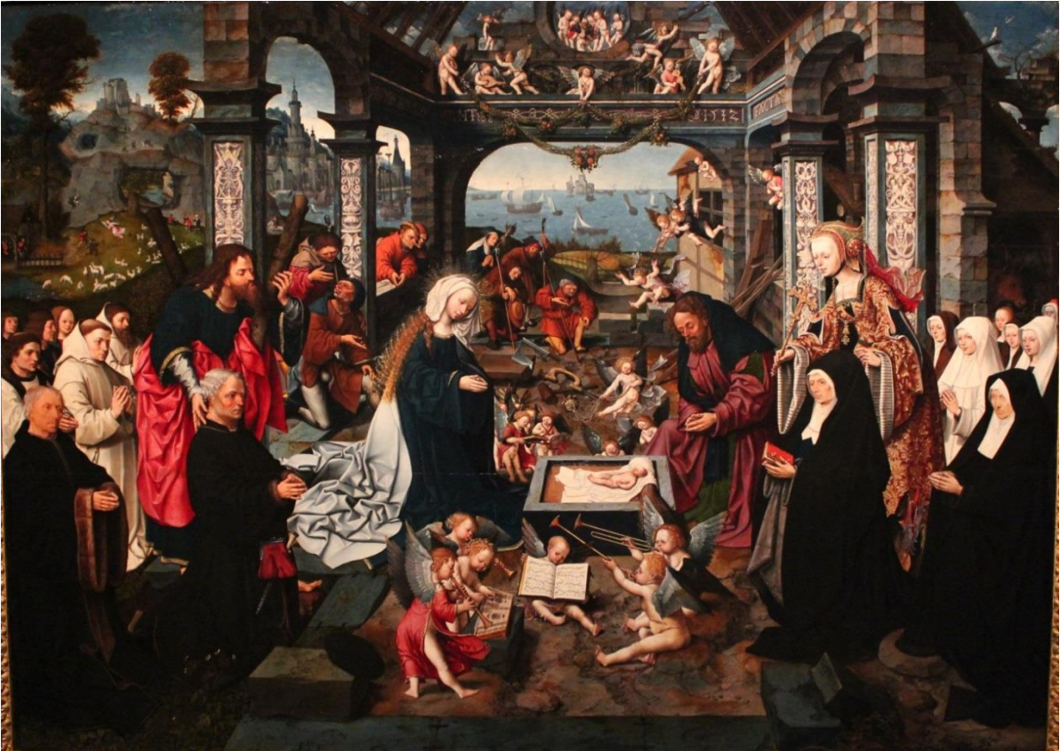
Afb. 9. Jacob Cornelisz van Oostsanen, De geboorte van Christus , 1512, olieverf op paneel, 128 x 177 cm, Museo Nazionale di Capodimonte, Napels.