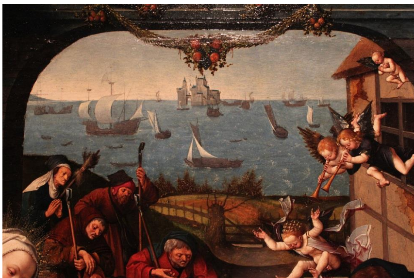
Afb. 14. Detail van afb. 9. Haven met schepen.