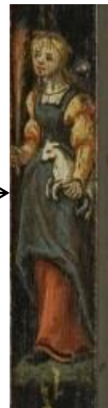
Afb. 16b. Detail van afb. 16