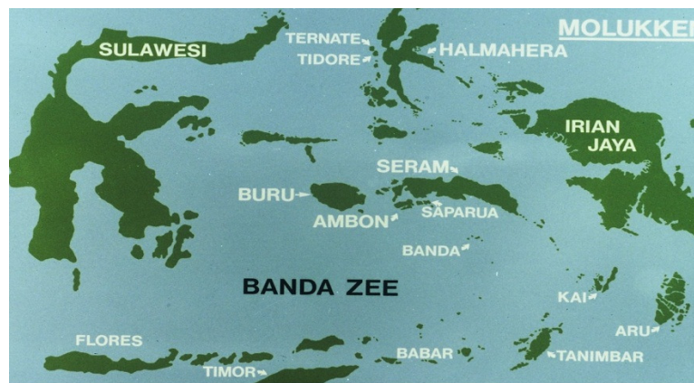
Kaart van de Molukken

Voormalig KNIL-kapitein Andi Azis probeerde in april 1950 de opheffing van de NIT nog te voorkomen. Nadat KNIL-eenheden bij de overgang naar het Indonesische federale leger bijeen wilden blijven, besloot Azis de enkele strategische punten in Makassar te bezetten. Hij wordt hierbij gesteund door groepen KNIL-militairen. 11 Vanuit Java worden eenheden van het federale leger naar Makassar gestuurd. De coup van Azis mislukt en het lot van de NIT is bezegeld, ook de NIT zal als deelstaat opgeheven worden. 12