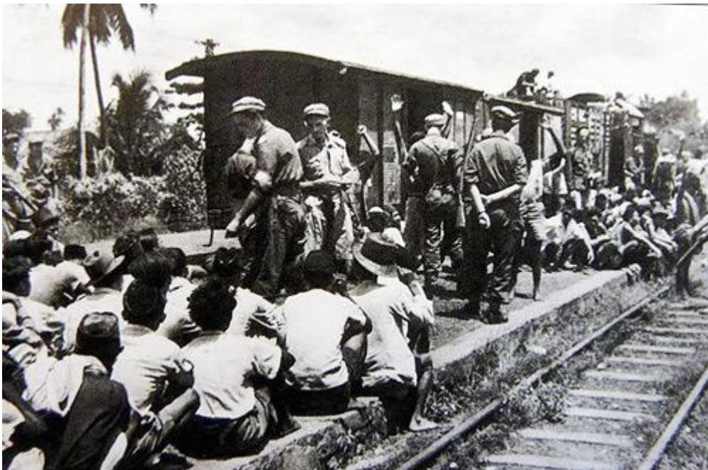
Gevangenentransport Bondowoso-Soerabaja, 1947.

De internering van Indonesiërs onder Nederlands gezag, 1946-1949