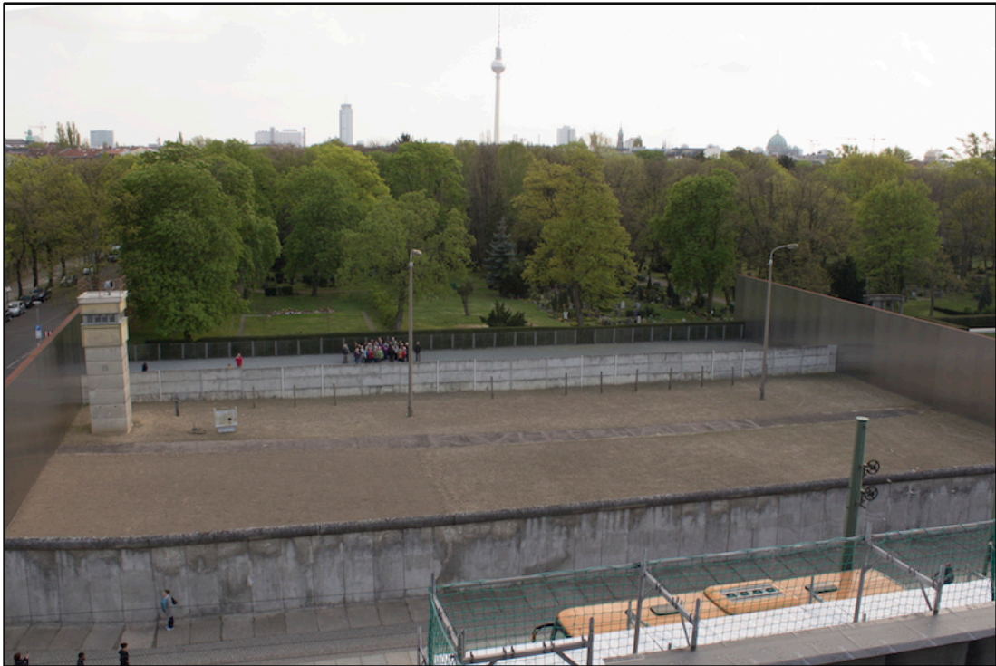
Het Berliner Mauer Gedenkstätte aan de Bernauerstrasse, gezien vanaf de toren.

Het Berliner Mauer Gedenkstätte werd in 2009 opgericht naar aanleiding van het coördinatieplan dat de Berlijnse Senaat in 2006 presenteerde. Het moest de centrale herdenkingsplek van de stad worden en werd om die reden als enige memorial gefinancierd door de Berlijnse Senaat. Het Berliner Mauer Gedenkstätte is onderdeel van de Berliner Mauer Stiftung . De Stichting organiseert rondleidingen langs het memorial , maar organiseert ook lezingen. Eens per maand vertellen Berlijners over hun ervaringen met de Berlijnse muur. Daarnaast heeft de stichting in samenwerking met het memorial de opdracht gekregen om dit jaar een bescheiden viering te organiseren, ten aanzien van het 25-jarig jubileum van de val van de muur.