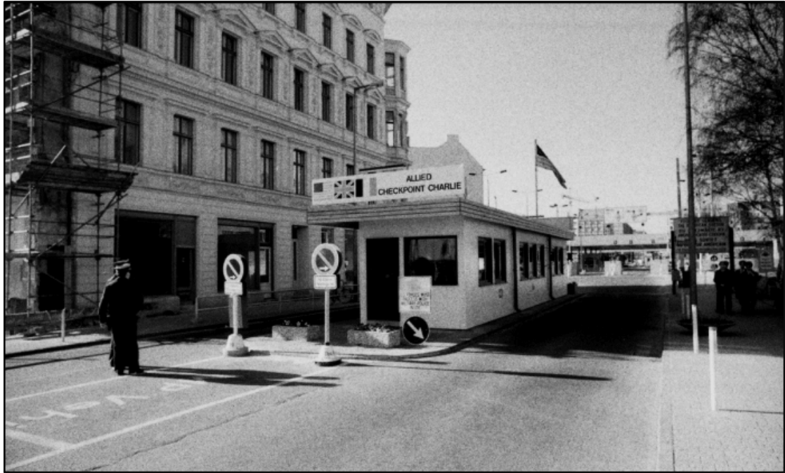
Checkpoint Charlie in 1988.