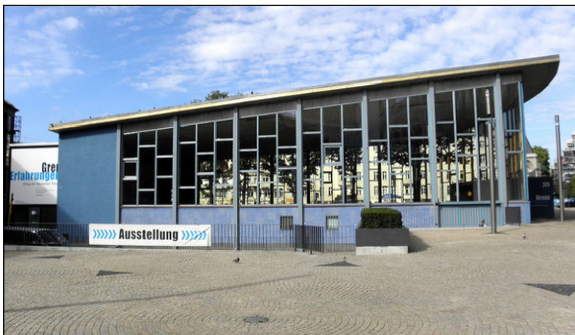
Het Tranenpaleis in september 2013, waar momenteel de tentoonstelling “ Alltag in der DDR ” gratis bezocht kan worden.