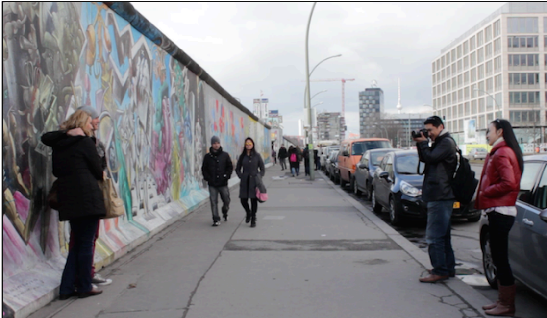
Toeristen poseren voor de East Side Gallery

De East Side Gallery is een stuk muur dat aan de oostzijde te zien was en ook wel de Hinterlandmauer wordt genoemd. Vanwege de gunstige locatie aan de Mühlenstraße in Oost-Berlijn kon het blijven staan na de val. Erachter lag niet de gebruikelijke grenszone met wachttorens, maar de rivier de Spree. Na het openstellen van de grenzen werd zichtbaar dat de muur aan de westzijde door creatieve geesten was beschilderd. Het inspireerde andere kunstenaars, die vanaf 1990 schilderijen maakten op het stuk Hinterlandmauer aan de Mühlenstraße. Uiteindelijk stonden er ruim 100 schilderijen op de muur, die van toen af aan de East Side Gallery werd genoemd. Uiteraard kreeg dit project al snel de publieke aandacht en veranderde het in een toeristische trekpleister.