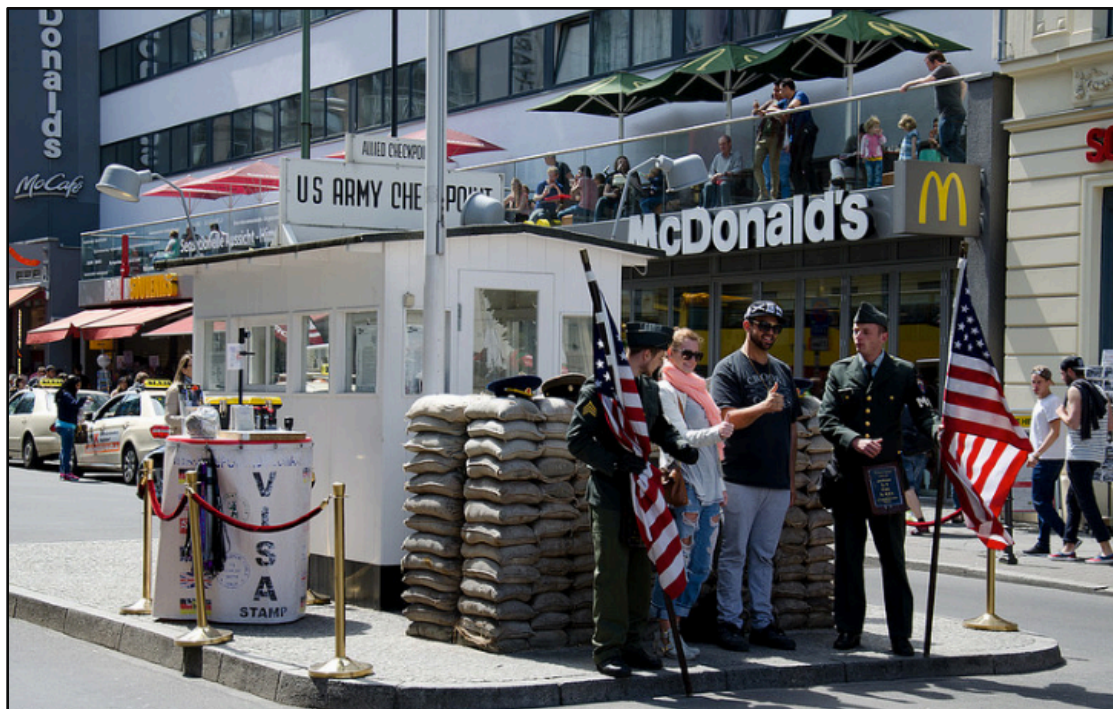
Checkpoint Charlie in 2014.