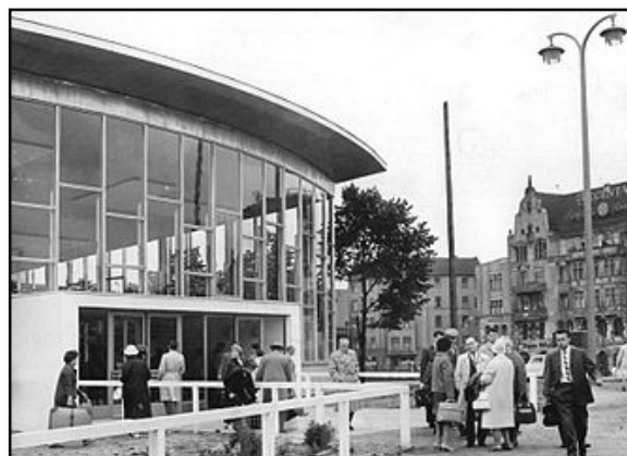
Het Tranenpaleis in 1962.

Met de val van de Berlijnse muur, verdween ook het Tranenpaleis als onderdeel daarvan. Hoewel het pand niet met de grond gelijk werd gemaakt, zoals gebeurde bij de betonnen stukken muur, werd het wel afgesloten van het station aan de Friedrichstraße en kreeg het pand verschillende bestemmingsplannen. Inmiddels biedt het Tranenpaleis ruimte voor een tentoonstelling. Hier is echter behoorlijk wat getouwtrek aan vooraf gegaan, met de nodige strubbelingen en controverse. Het kader bovenaan bladzijde 27 licht dit verder toe.