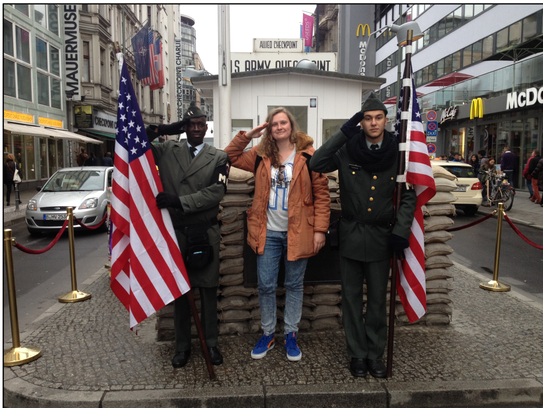
Participerende observatie bij Checkpoint Charlie .