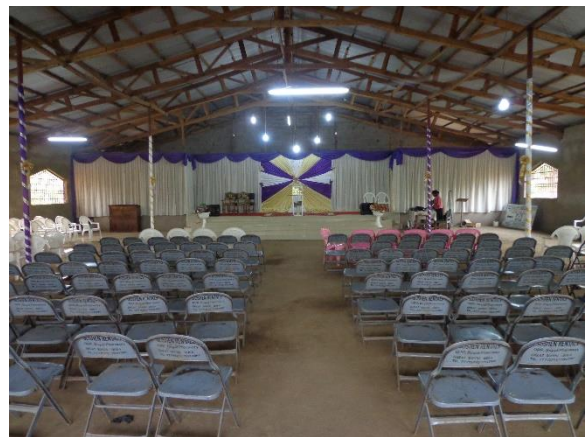
2. Interieur van de Deeper Life, Molyko