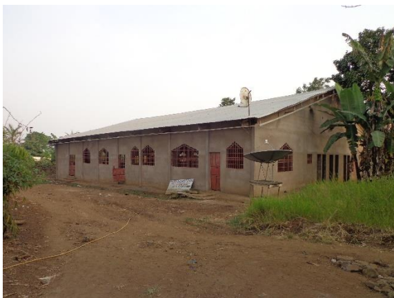
1. Exterieur van de Deeper Life, Molyko, met de schotelantenne voor het ontvangen van de diensten van Kumuyi vanuit Lagos, Nigeria.