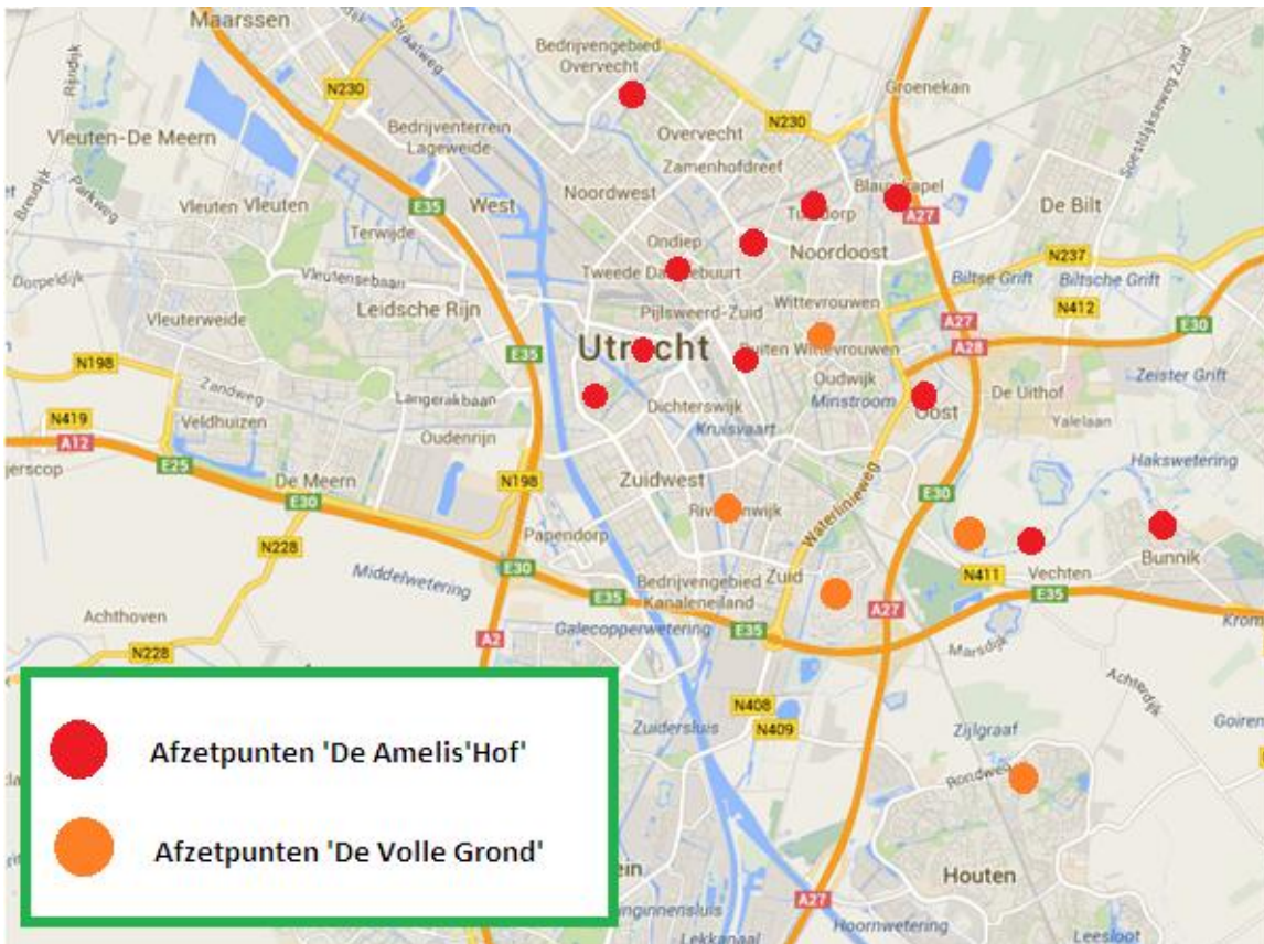
Afbeelding 3: Afzetzpunten groentepakketten 'De Amelis'Hof' en 'De Volle Grond'.

Daarbij is 'De Volle Grond' een CSA bedrijf. Dit staat voor 'Community Supported Agriculture' en houdt in dat er een samenwerkingsverband bestaat tussen een groep betrokken klanten, de deelnemers en de coördinatoren. Hiermee gaat een open boekhouding, gezamenlijke prijsvorming en oogst-ricodeling gepaard. Zo is het project niet afhankelijk van de onzekere markt en de tussenhandel. Bovendien stelt de tuin zich open op door mee te doen aan verschillende open dagen, waar ook activiteiten speciaal voor kinderen te doen zijn (Tuinderij De Volle Grond, 2014).