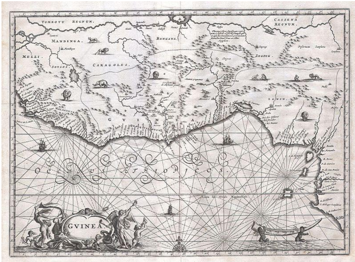
Kaart van West-Afrika uit 1670 met in het zuiden de Guinese kust met de vele Europese nederzettingen. 18

De WIC voerde op de Guinese kust een uiterst monopolistisch beleid en oorlogen met buitenlandse compagnieën of Afrikaanse machthebbers om de eigen handel te beschermen werden dan ook niet vermeden. Dit agressieve karakter van het WIC-beleid in West-Afrika toont gelijk de grote economische waarde die dit gebied voor de WIC had. De meest belangrijke producten die de WIC vanuit Guinea naar de rest van de wereld verhandelde waren goud, ivoor en slaven. 19 Niet voor niets werden de verschillende gebieden van de Guinese kust dan ook aangeduid als de Goud-, Tand- en Slavenkust.