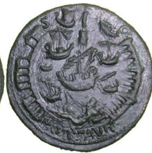
Afbeelding 4: Sestertius met aan de linkerkant Nero en aan de rechterkant de haven van Ostia. Opschrift: NERO CLAVD CAESAR AVG GER P M TR P IMP P P (voorzijde) PORT AVG (keerzijde).