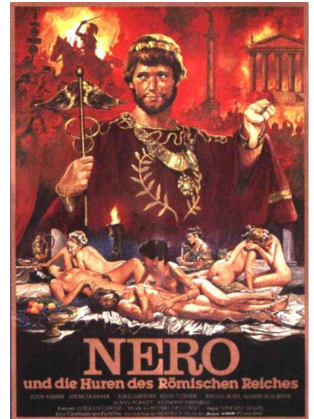
Afbeelding 2: Duitse filmposter uit 1982 waarin Nero als Tiran wordt verbeeld.