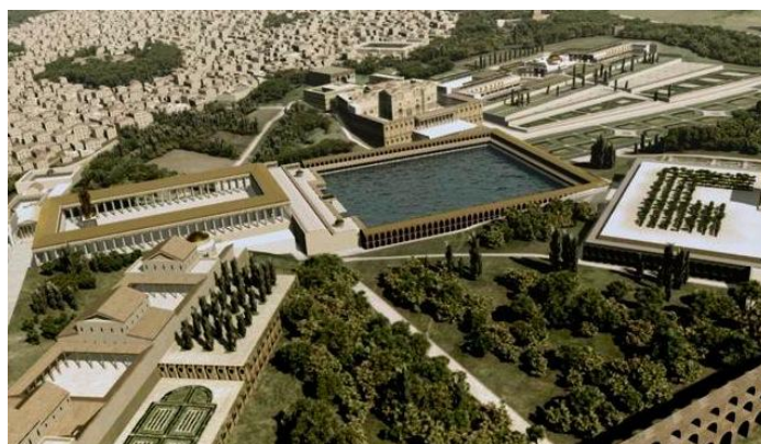
Afbeelding 5: Reconstructie van de domus aurea ten tijde van Nero, op de plek van de vijver zou later het Colosseum gebouwd worden.